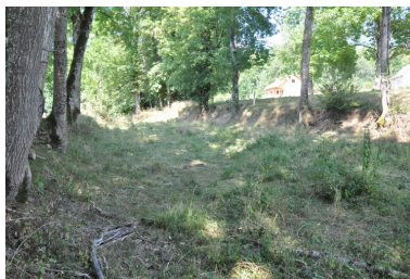
Vue de la réserve d'eau asséchée IVR82_20107300261NUCA