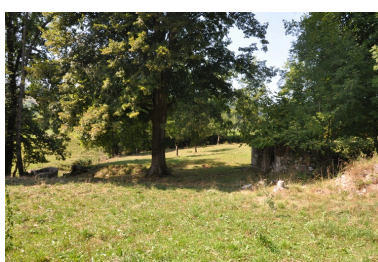
Vue générale IVR82_20107300258NUCA