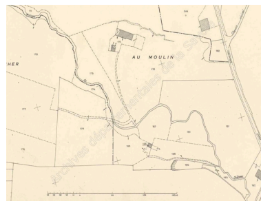
Cadastre rénové, 1936-1988. Cadastre de 1936-1988 AD Savoie. 3P 7036 IVR82_20107300257NUCA