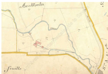
Premier cadastre français, 1906. Cadastre de 1906 AD Savoie. 3P 7035 IVR82_20107300256NUCA