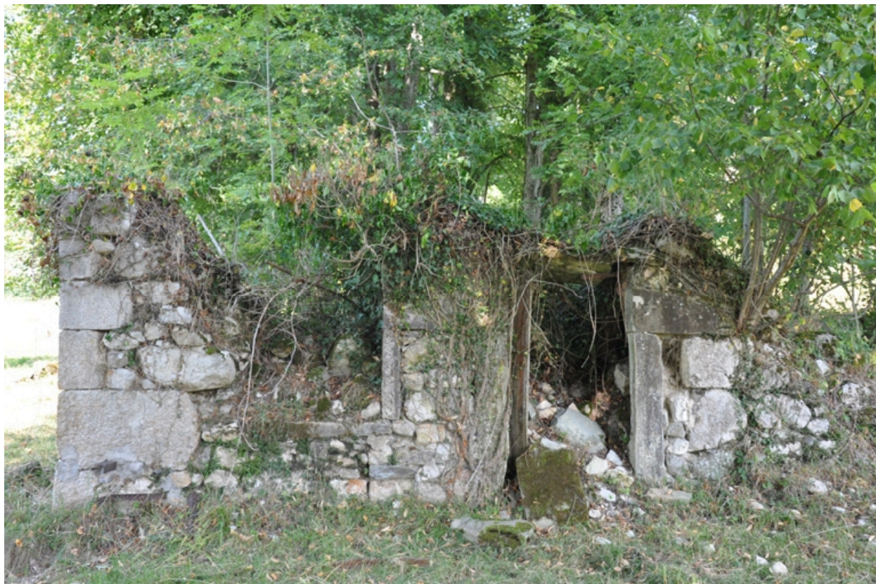
Vue façade sud