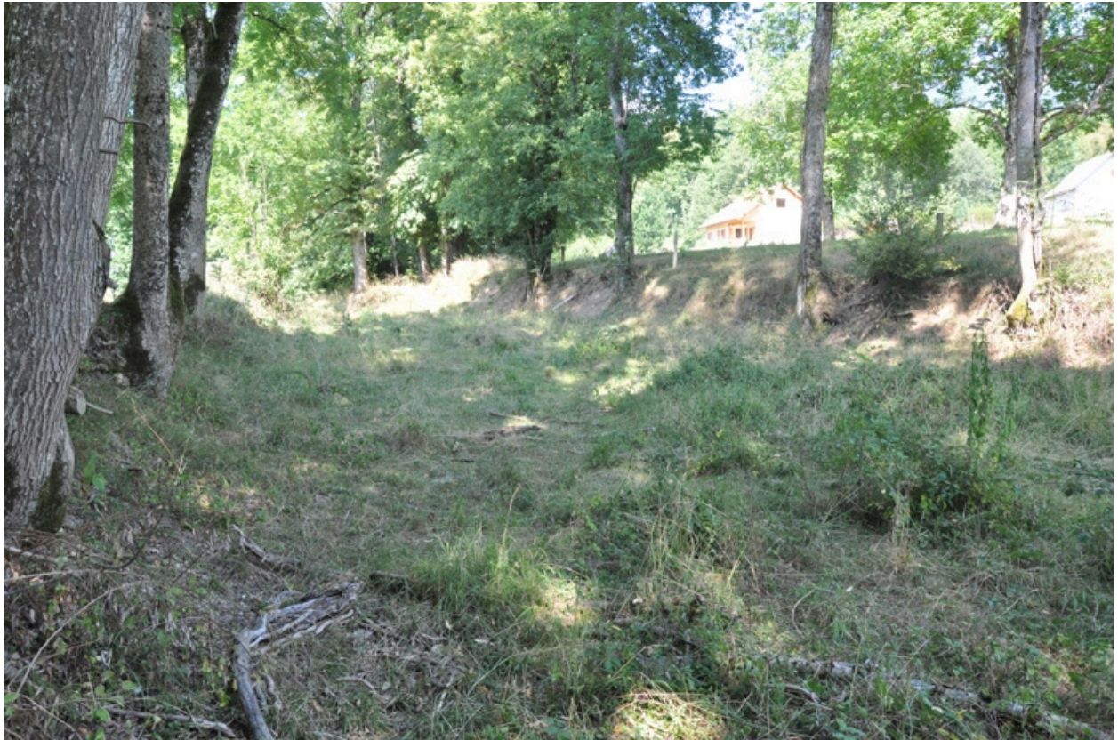
Vue de la réserve d'eau asséchée