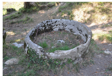
Meule du moulin aval IVR82_20107300262NUCA