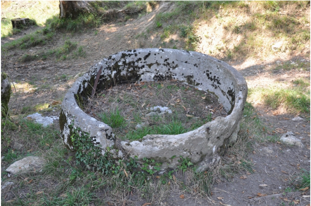
Meule du moulin aval