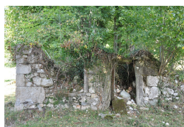
Vue façade sud IVR82_20107300259NUCA