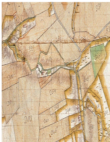
Cadastre de 1732. Cadastre de 1728 AD Savoie. C2148 IVR82_20107300255NUCA