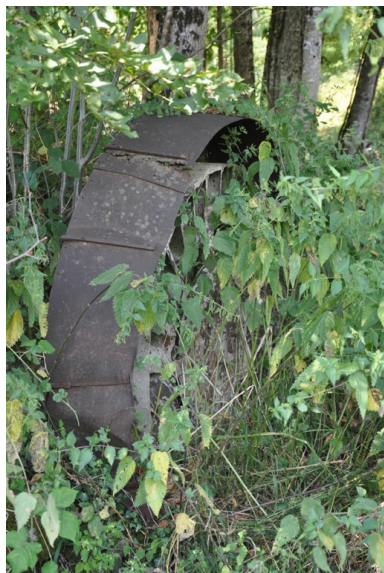
Roue verticale métallique IVR82_20107300260NUCA