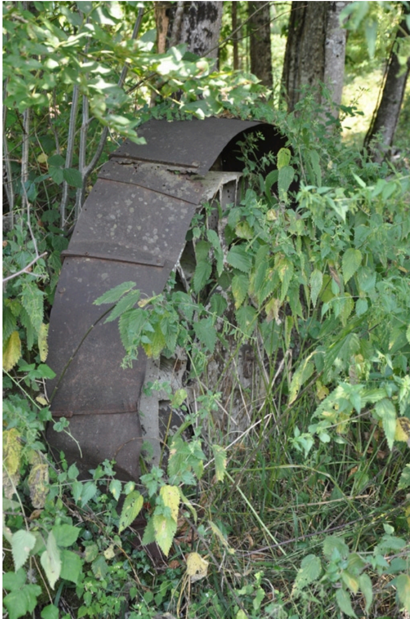
Roue verticale métallique