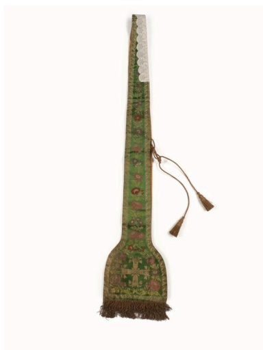
Vue générale du revers de l'étole. IVR83_20156300050NUC4A