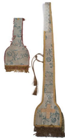
Vue générale de l'étole et du manipule