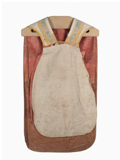
Vue du devant de la chasuble IVR83_20156300044NUC4A