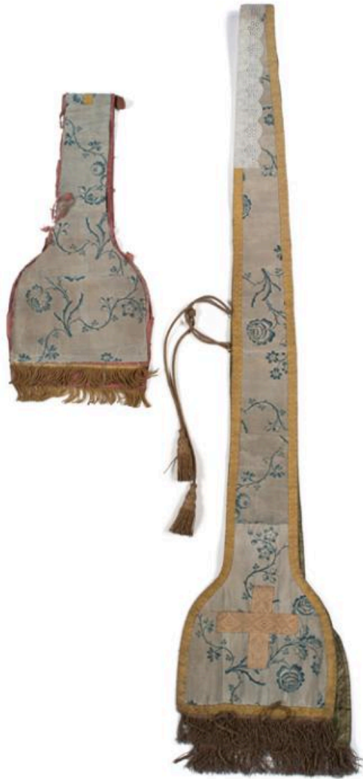
Vue générale de l'étole et du manipule