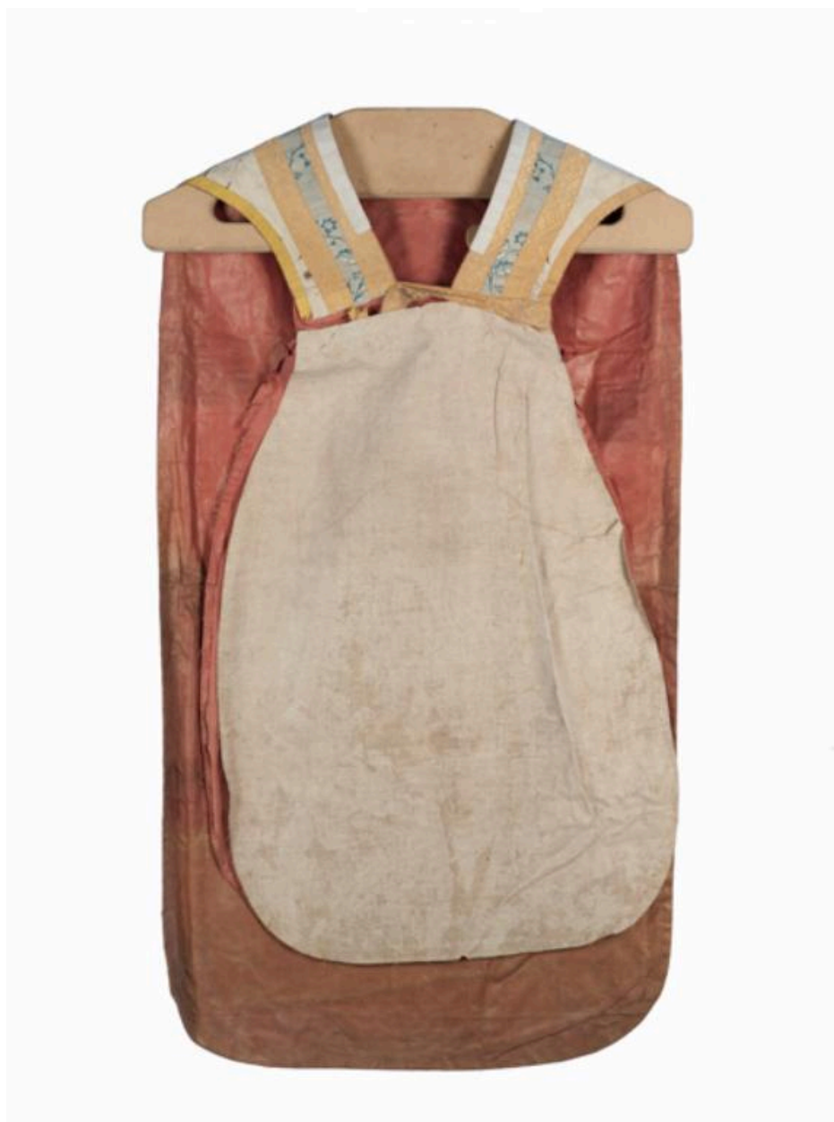
Vue du devant de la chasuble