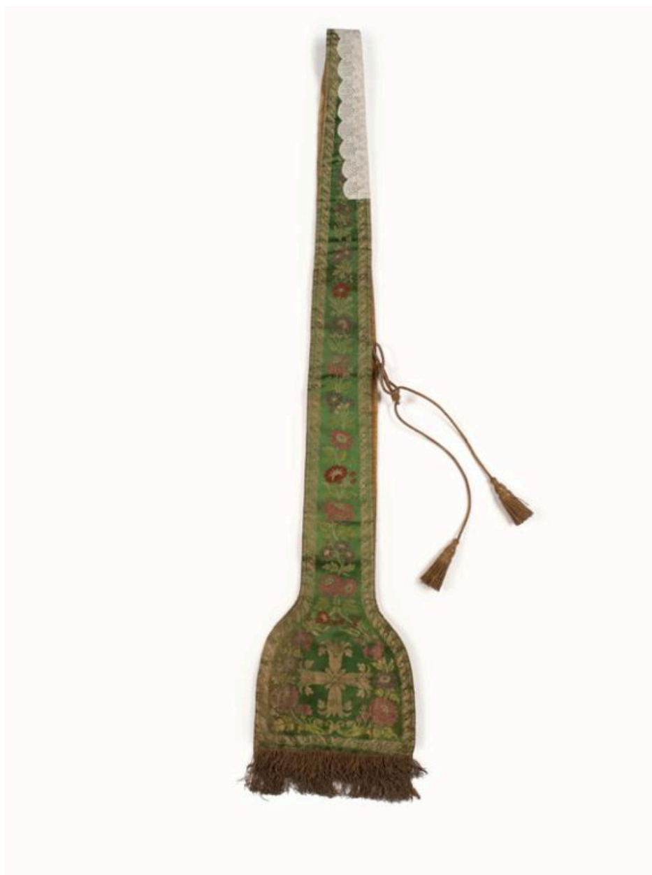
Vue générale du revers de l'étole.