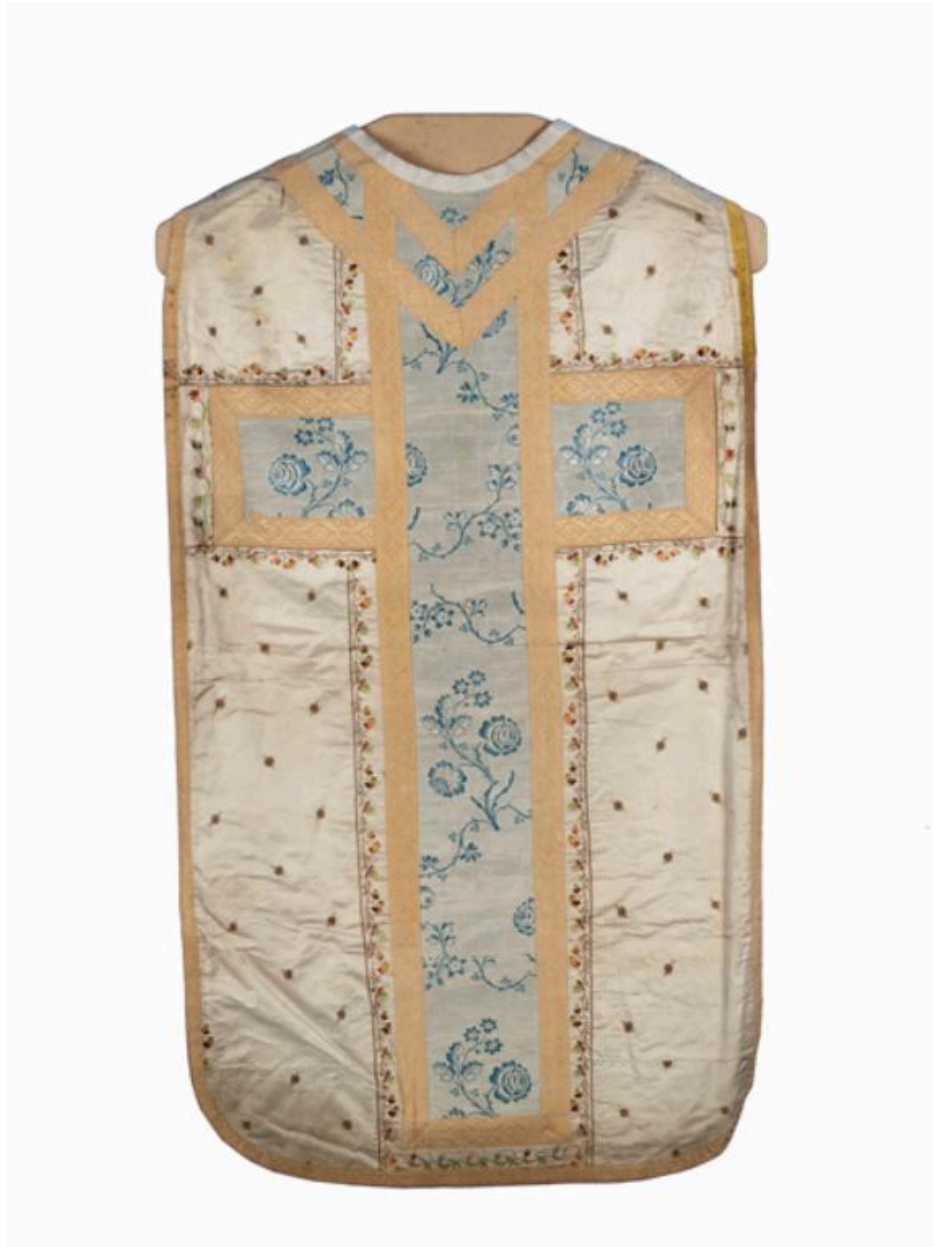
Vue générale du dos de la chasuble.