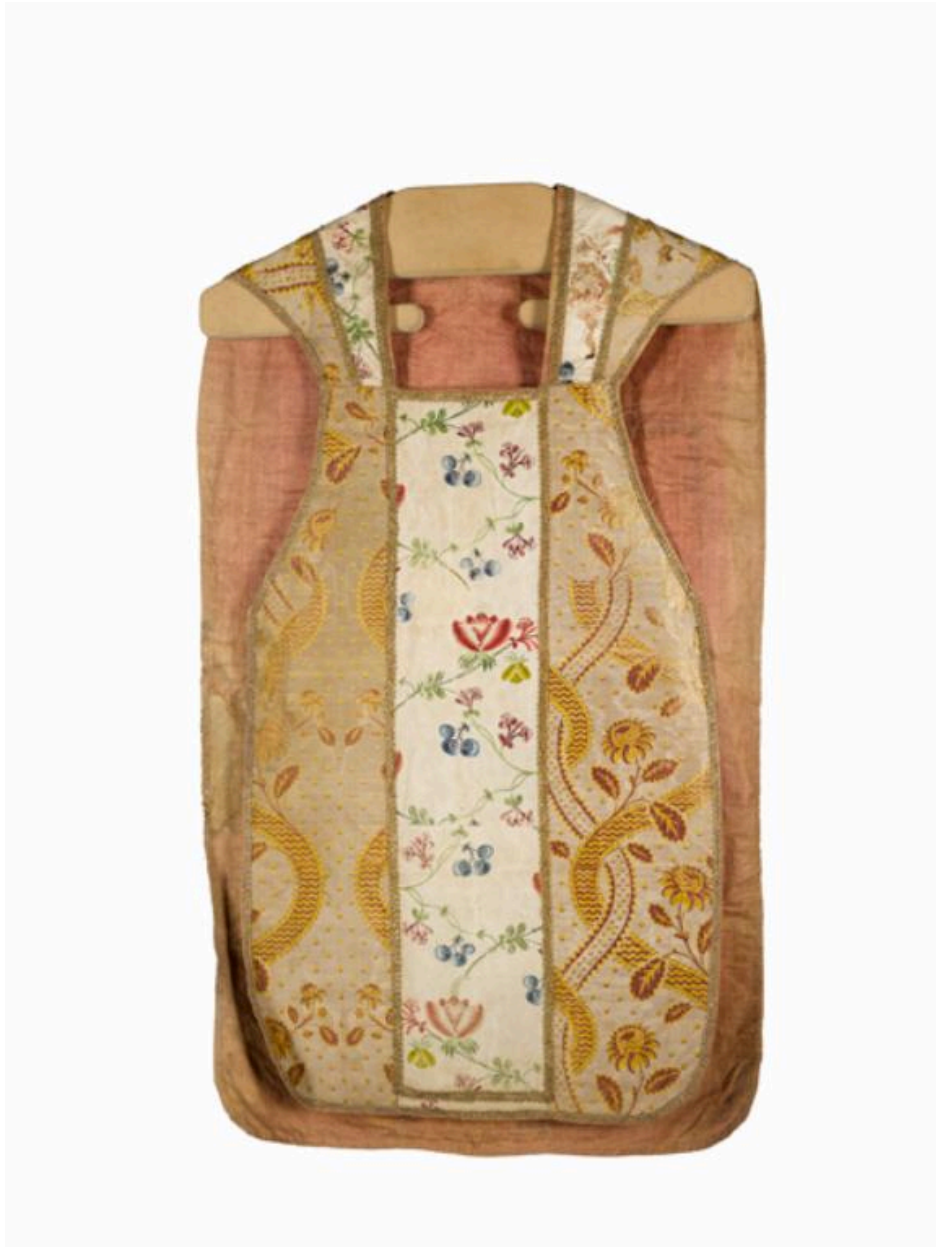
Vue du devant