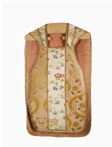
Vue du devant IVR84_20174300494NUC4A