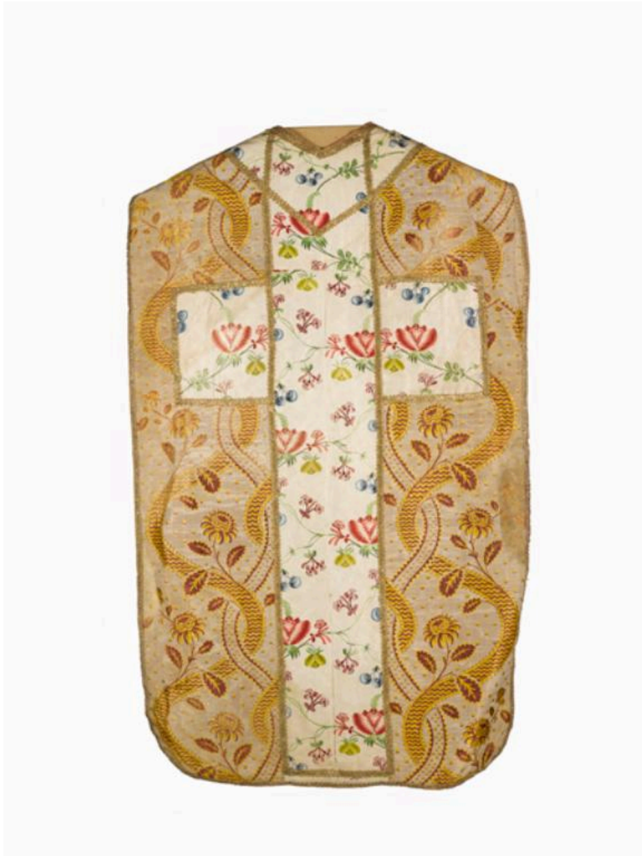
Vue du dos