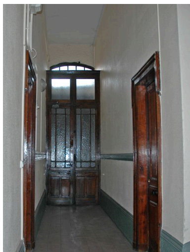
Vestibule depuis le fond IVR82_20076900298NUCA