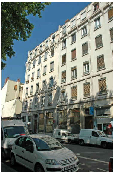
Vue d'ensemble depuis le nord-est IVR82_20076900296NUCA