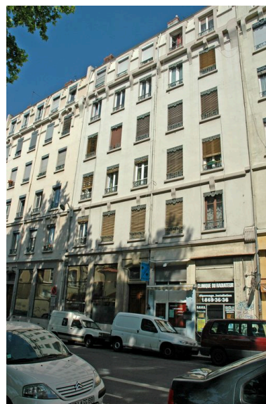
Elévation principale IVR82_20076900297NUCA