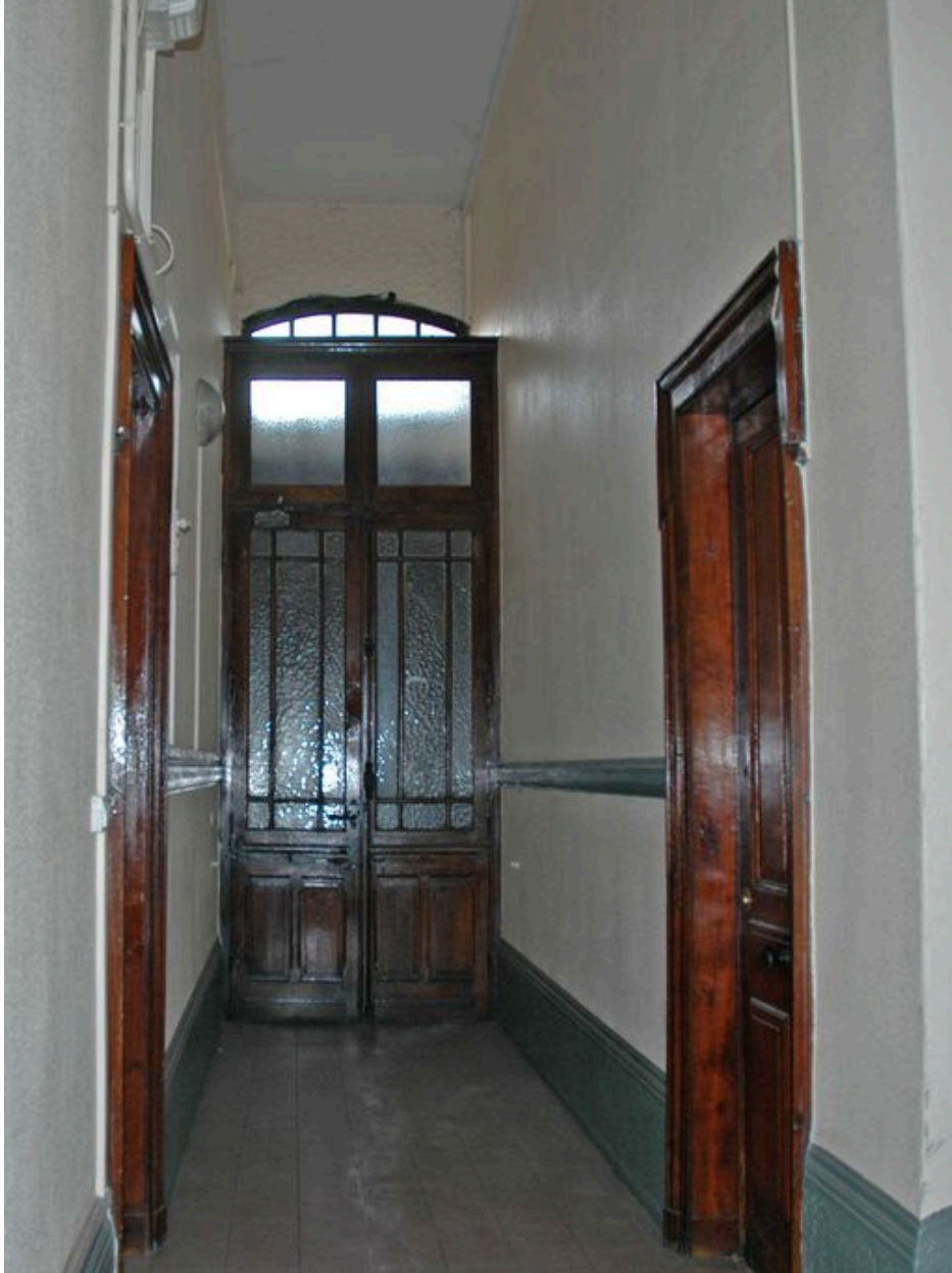
Vestibule depuis le fond