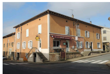
Vue d'ensemble, depuis le sud. IVR84_20190100347NUCA