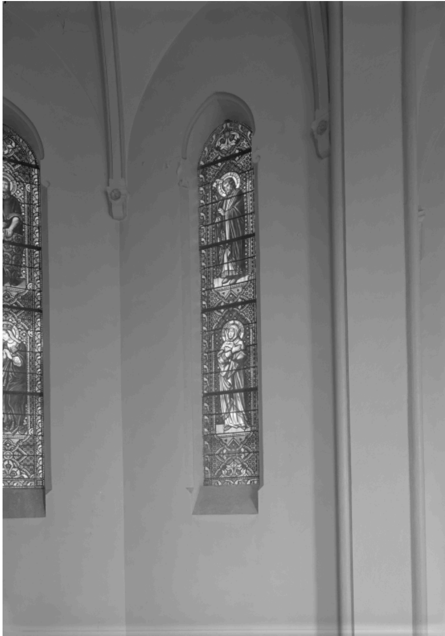
Baie 4 : saint Joseph, sainte Anne.