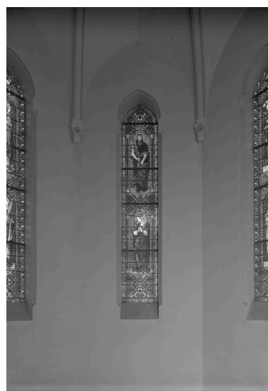
Baie 2 : saint Maurice, sainte Adèle.