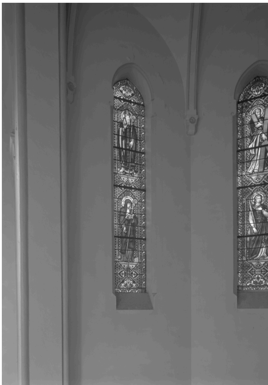
Baie 3 : saint Augustin, sainte Angèle.