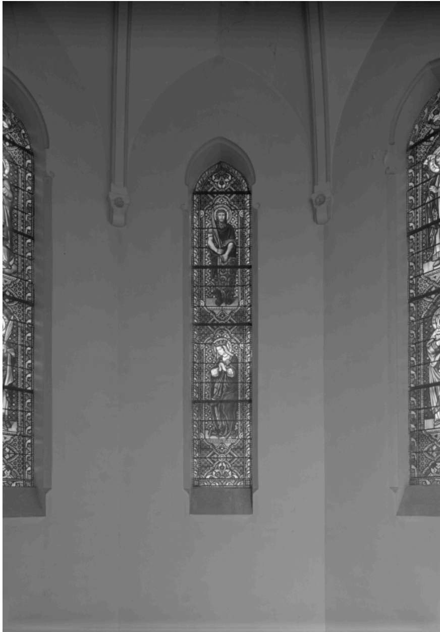
Baie 2 : saint Maurice, sainte Adèle.