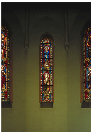
Baie 0 : Immaculée Conception, sainte Ursule.