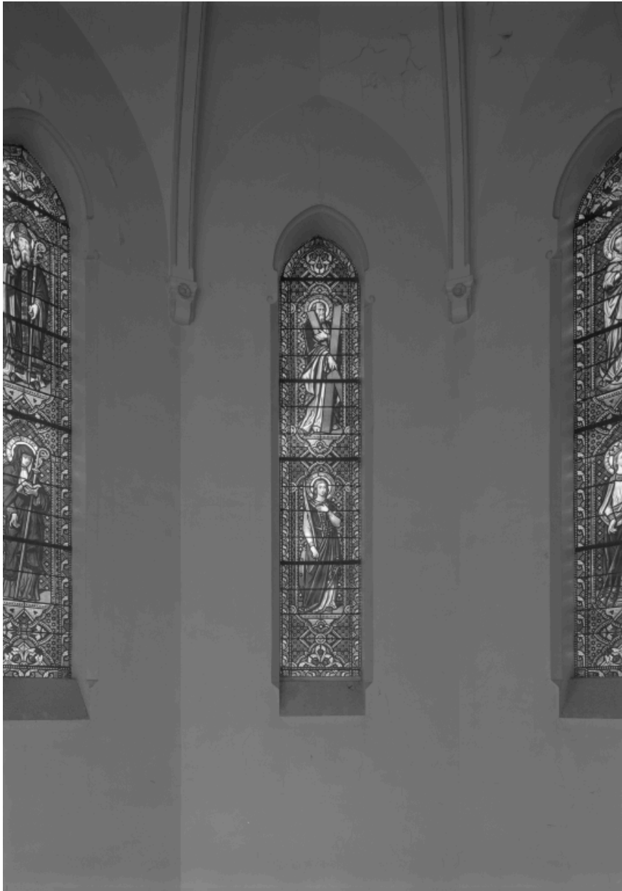
Baie 1 : saint André, sainte Catherine.