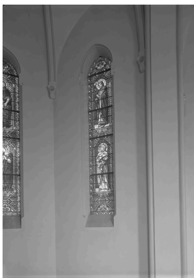
Baie 4 : saint Joseph, sainte Anne.

IVR82_19910100023P