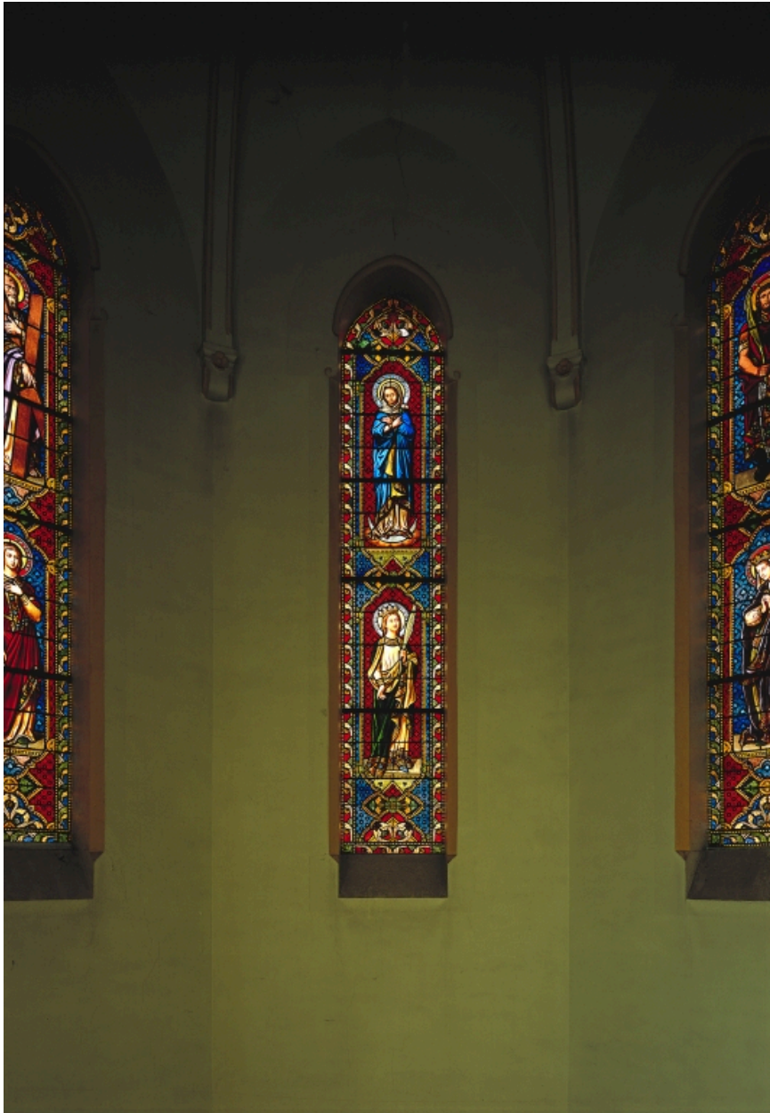
Baie 0 : Immaculée Conception, sainte Ursule.