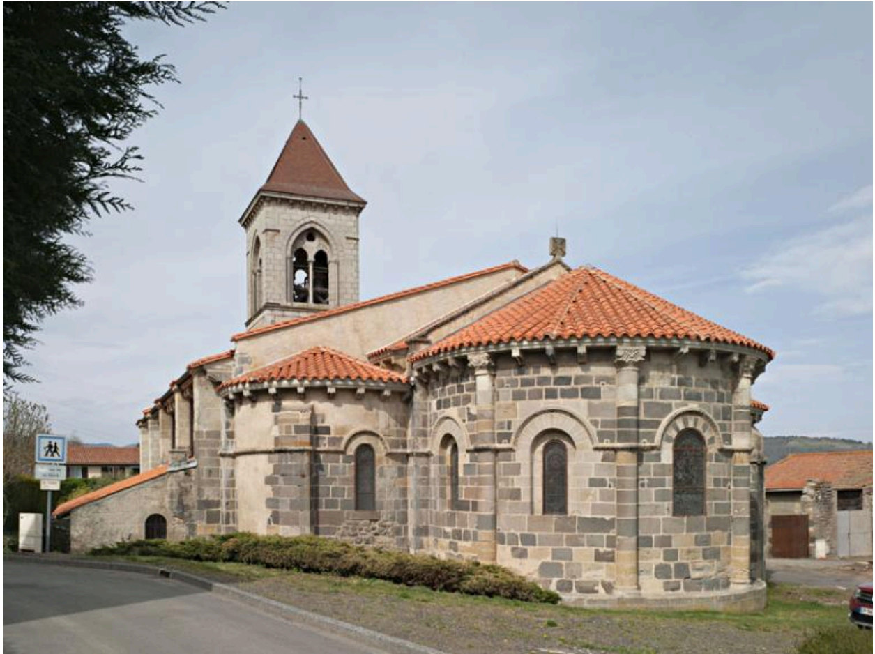
Vue générale de l'église.