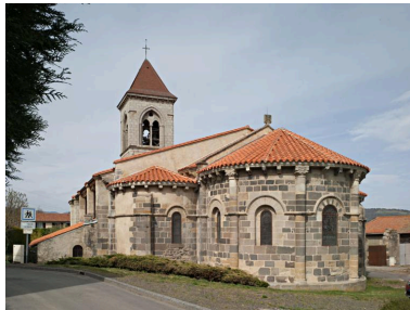
Vue générale de l'église.