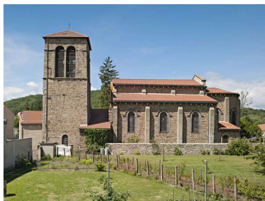
Vue générale. IVR83_20146300348NUC4A