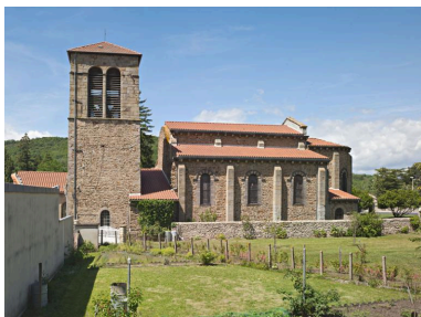
Vue générale. IVR83_20146300349NUC4A