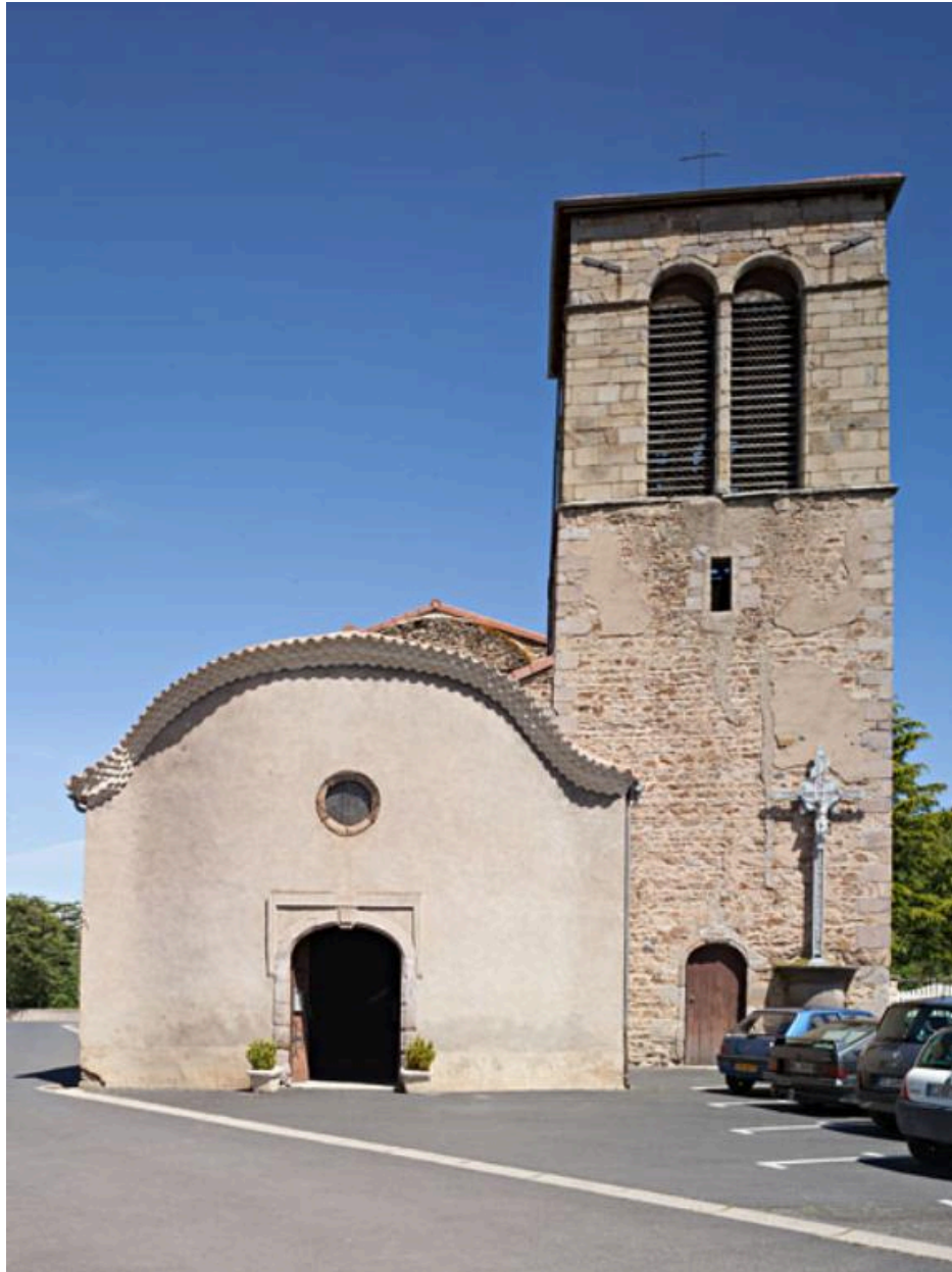
Vue de la façade occidentale.