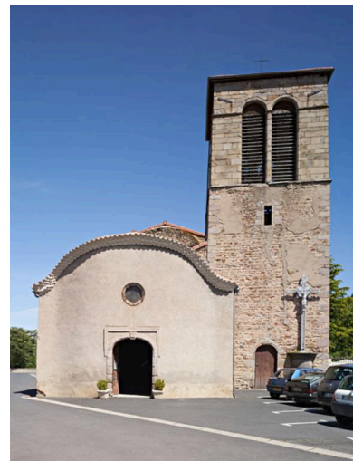
Vue de la façade occidentale. IVR83_20146300346NUC4A