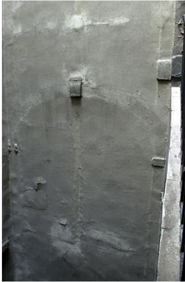
Corps de galeries séparant les deux cours, vue d'un arc murée depuis l'escalier IVR82_20046900088NUCA