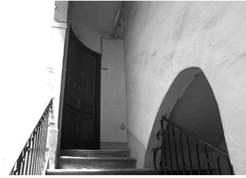
Escalier, vue prise vers un palier. La porte marque l'entrée de la galerie entre les 2 cours