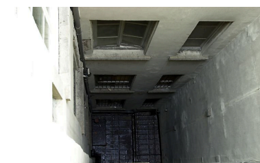
Cour à l'arrière du 1er corps de bâtiment prise depuis l'escalier. A droite, corps de galeries aux ouvertures murées séparant les deux cours IVR82_20046900087NUCA