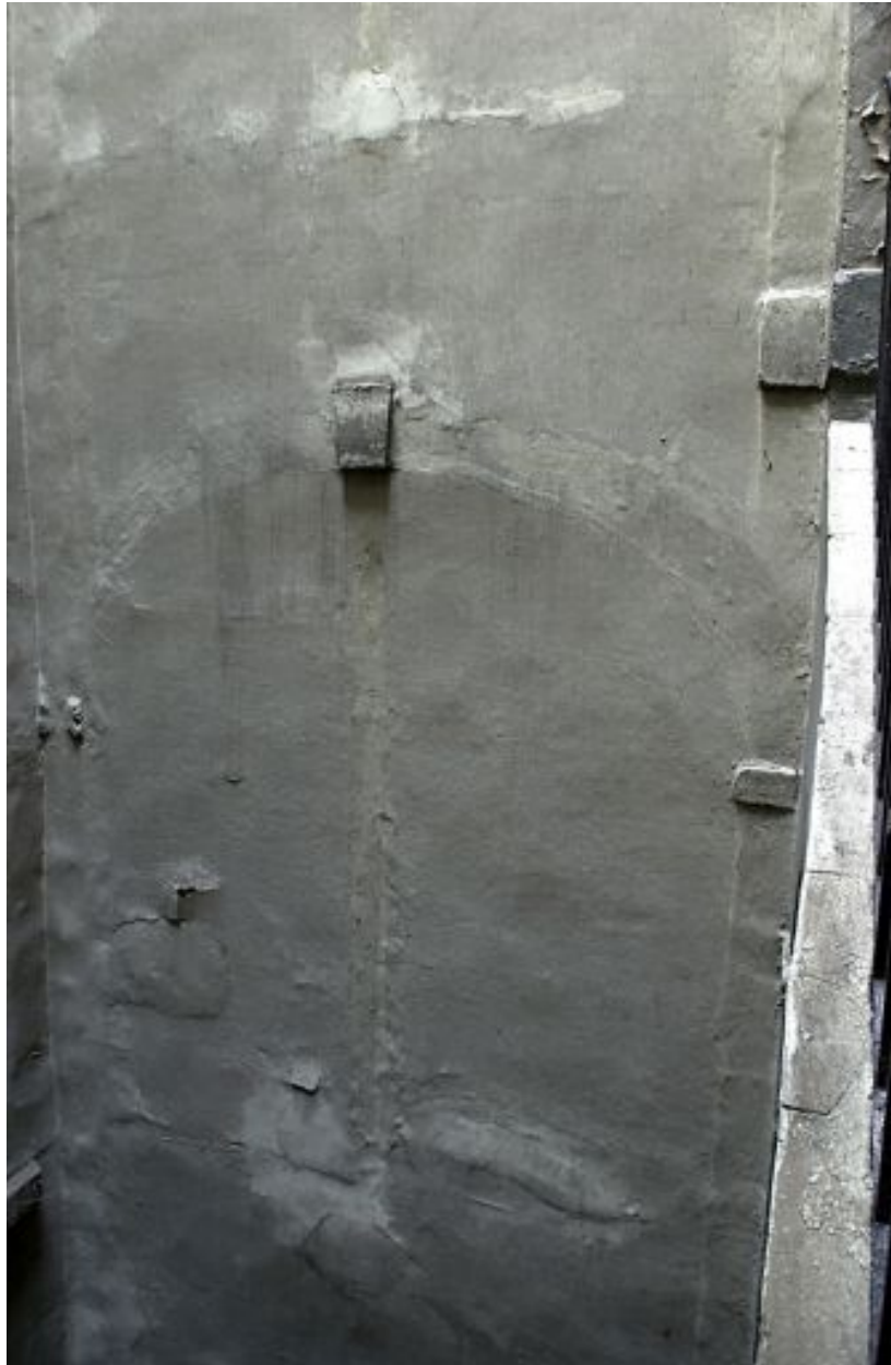
Corps de galeries séparant les deux cours, vue d'un arc murée depuis l'escalier