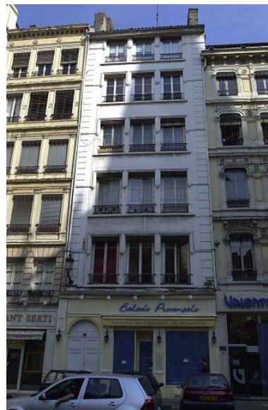
Vue générale de la façade sur rue IVR82_20046900084NUCA