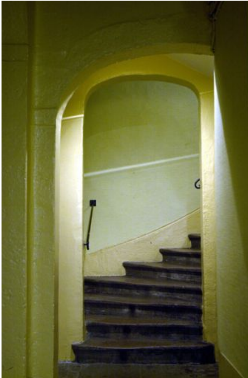
Départ de l'escalier