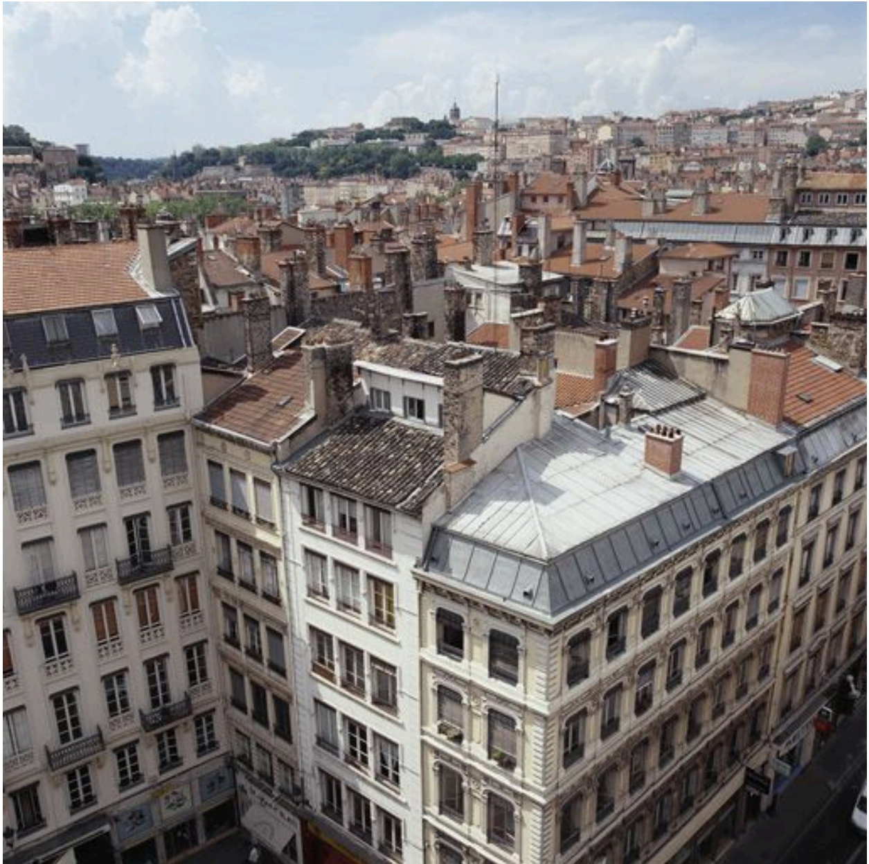
Vue générale de situation depuis la tour nord de la collégiale Saint-Nizier