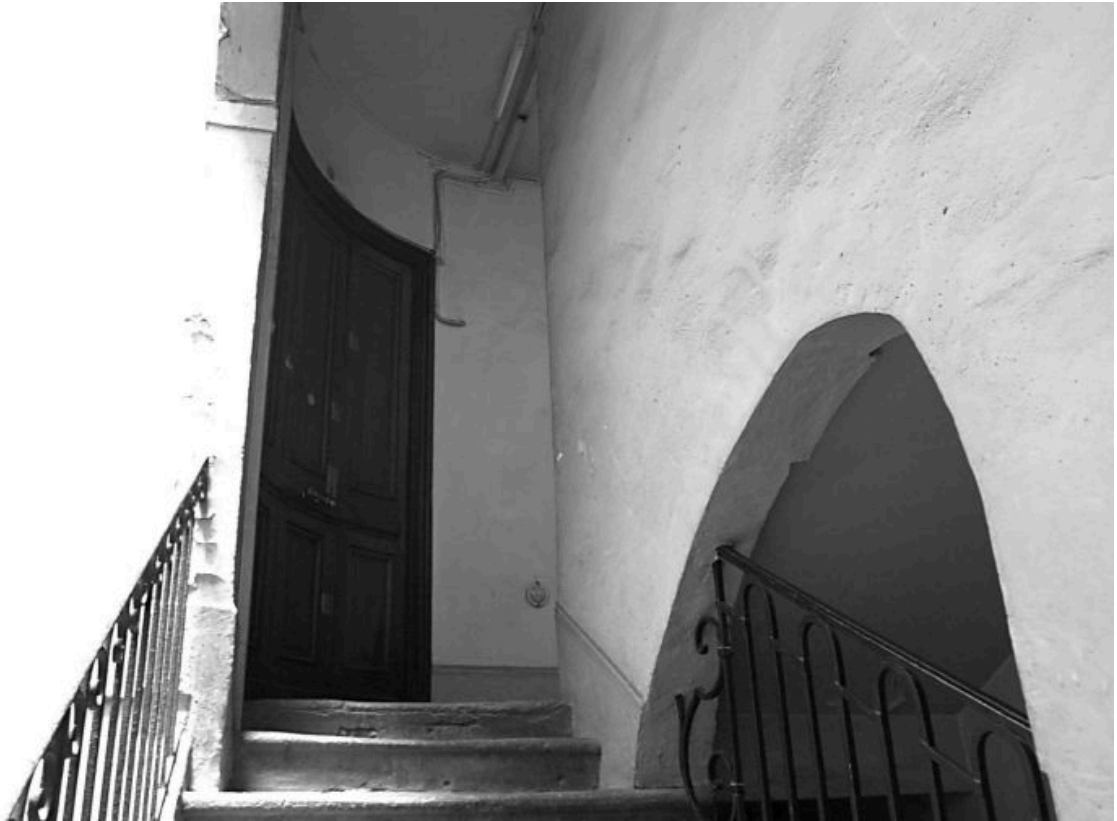
Escalier, vue prise vers un palier. La porte marque l'entrée de la galerie entre les 2 cours