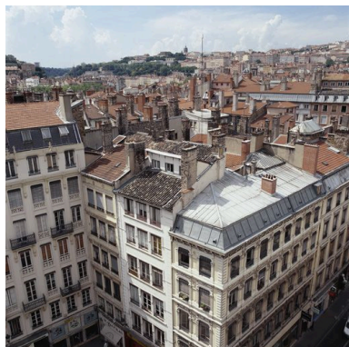
Vue générale de situation depuis la tour nord de la collégiale Saint-Nizier