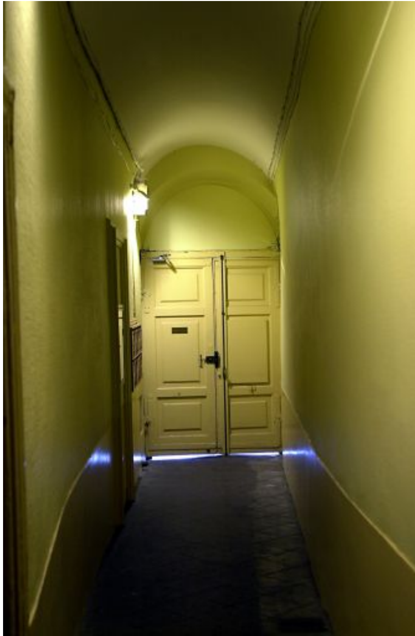
Allée vue en direction de la porte d'entrée