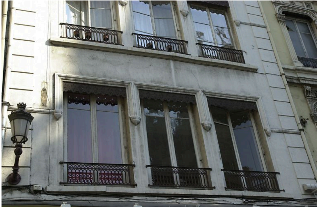
Façade principale, détail des fenêtres du 1er étage