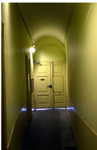
Allée vue en direction de la porte d'entrée