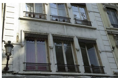
Façade principale, détail des fenêtres du 1er étage IVR82_20046900085NUCA