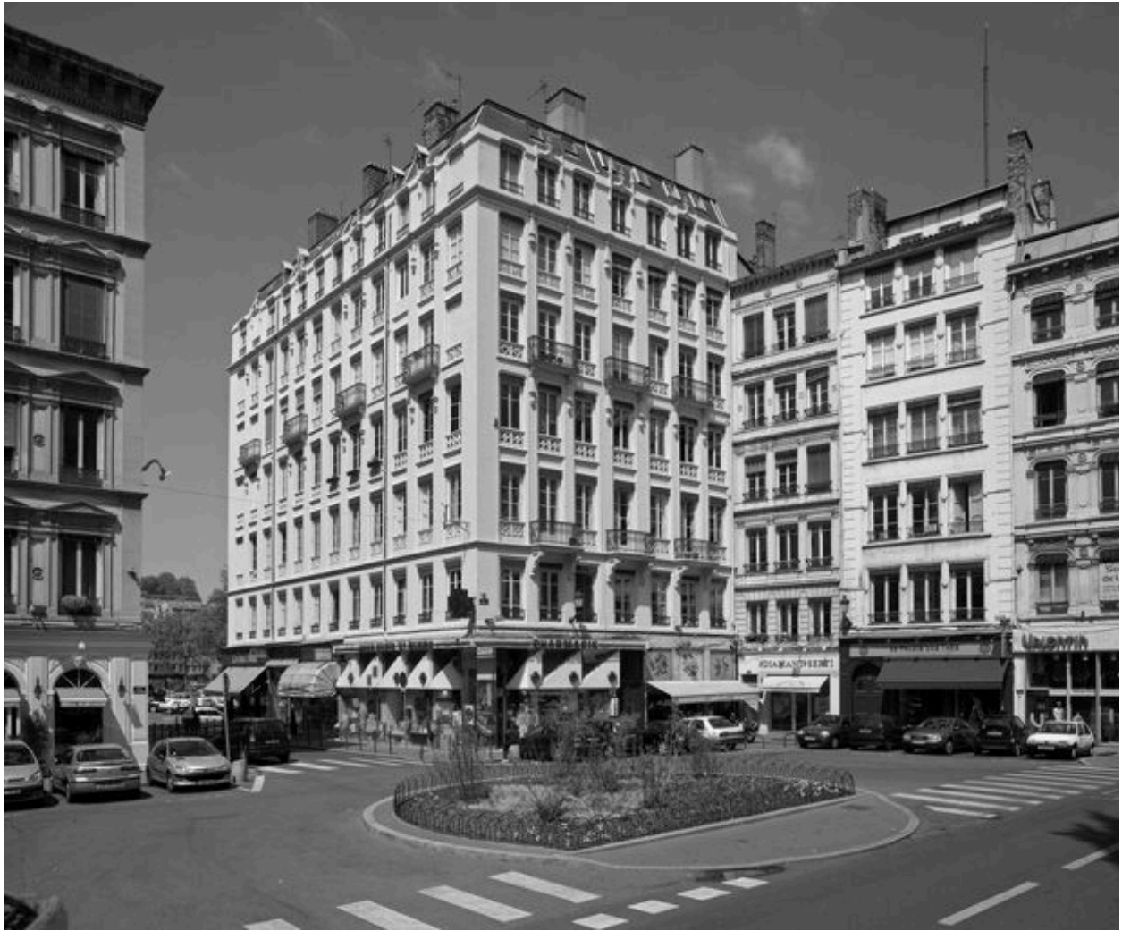
Vue générale de situation