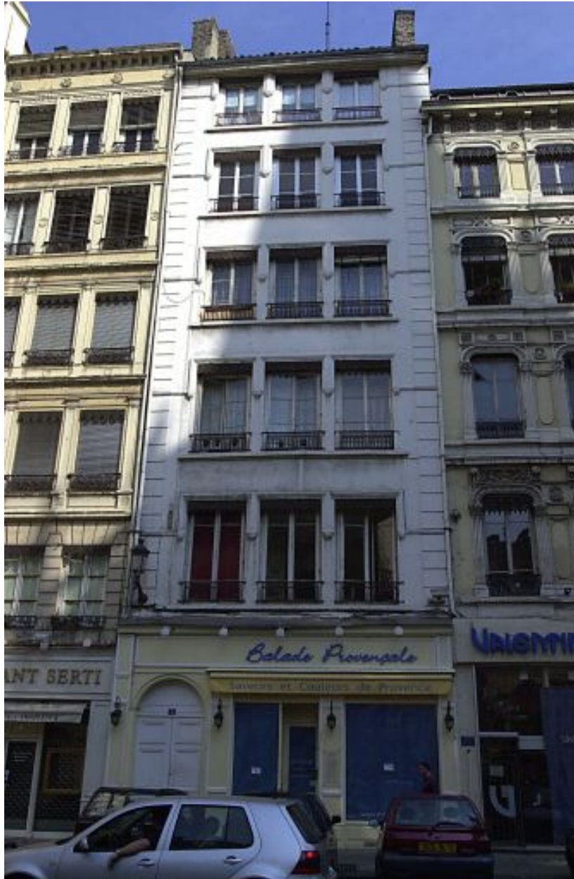
Vue générale de la façade sur rue