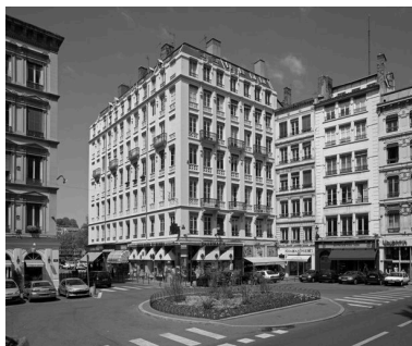
Vue générale de situation IVR82_20056901709NUC