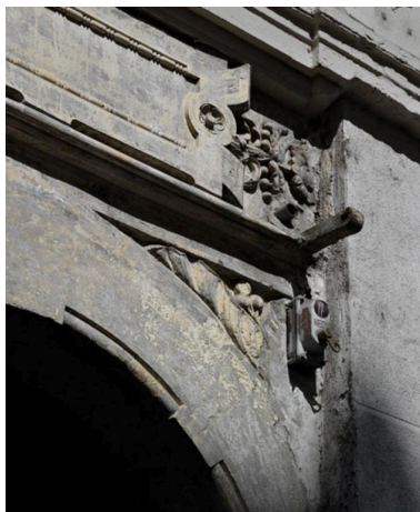
Ornementation de la porte : des crochets ont été fixés dans l'arum de droite, précisément dans la partie sculptée