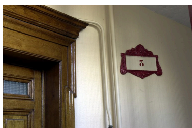
Plaque indiquant l'étage IVR82_20046905306NUCA