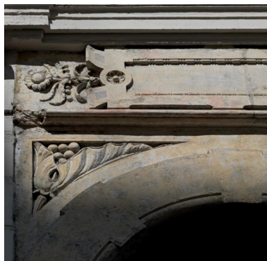
Ornement sculpté de la porte : marguerite prolongeant une table et arum lové dans un écoinçon IVR82_20126901520NUCA