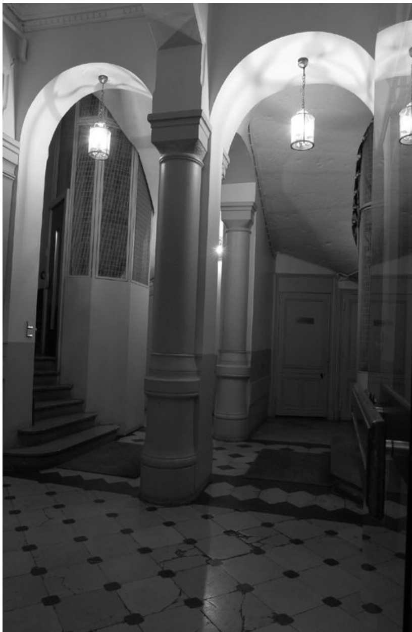
Le vestibule jumelé avec celui de l'immeuble sis au n°60