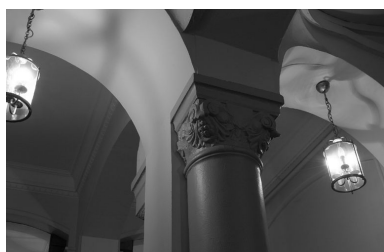
Le vestibule : détail d'un chapiteau