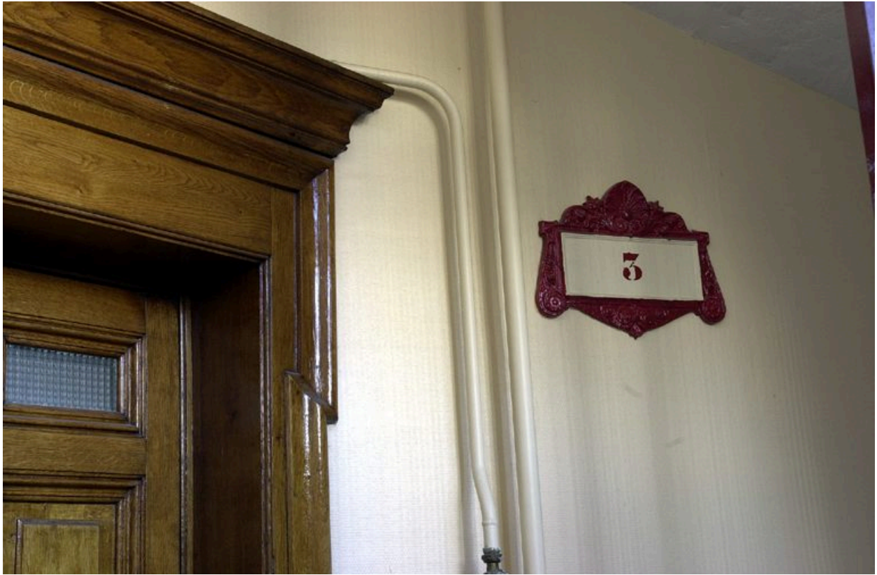
Plaque indiquant l'étage