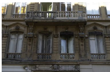
Elévation antérieure, premier étage carré : les travées centrales IVR82_20046905304NUCA