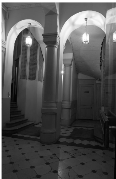
Le vestibule jumelé avec celui de l'immeuble sis au n°60 IVR82_20046905305NUC