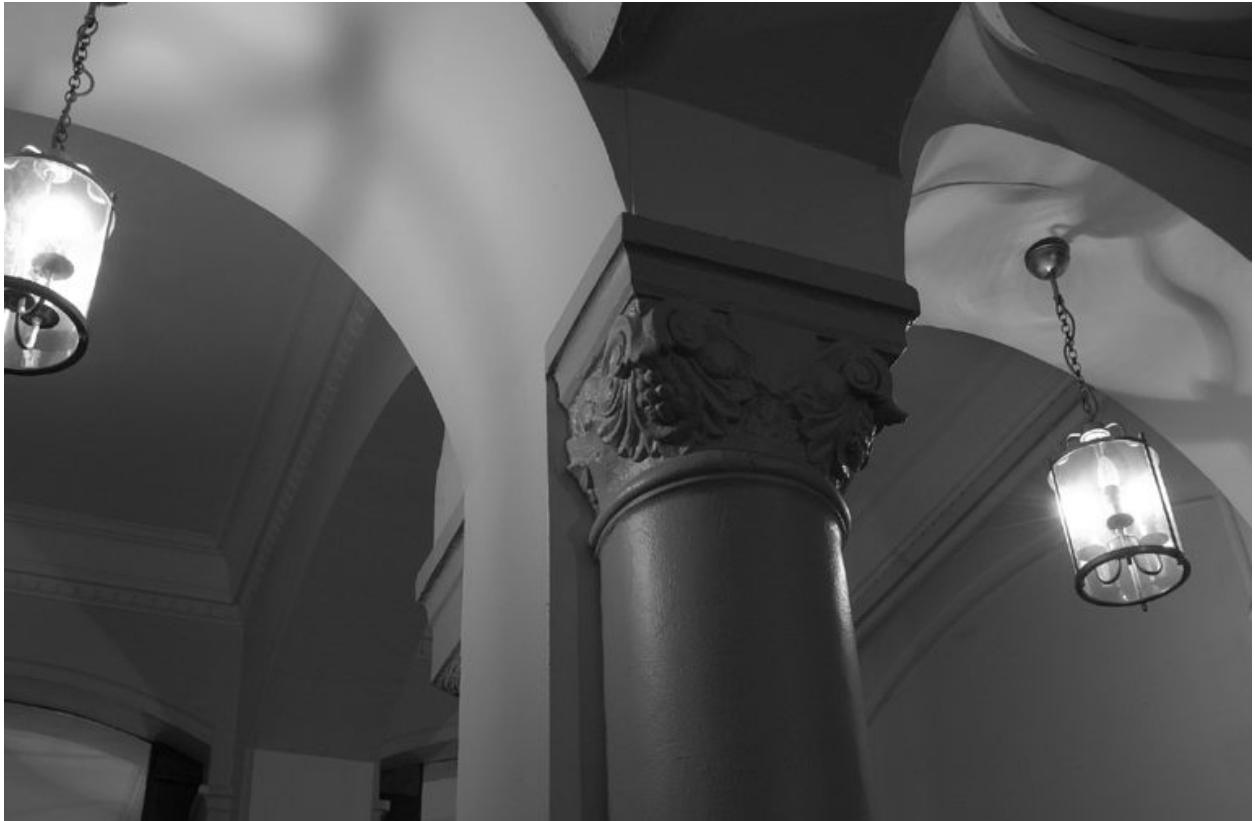
Le vestibule : détail d'un chapiteau