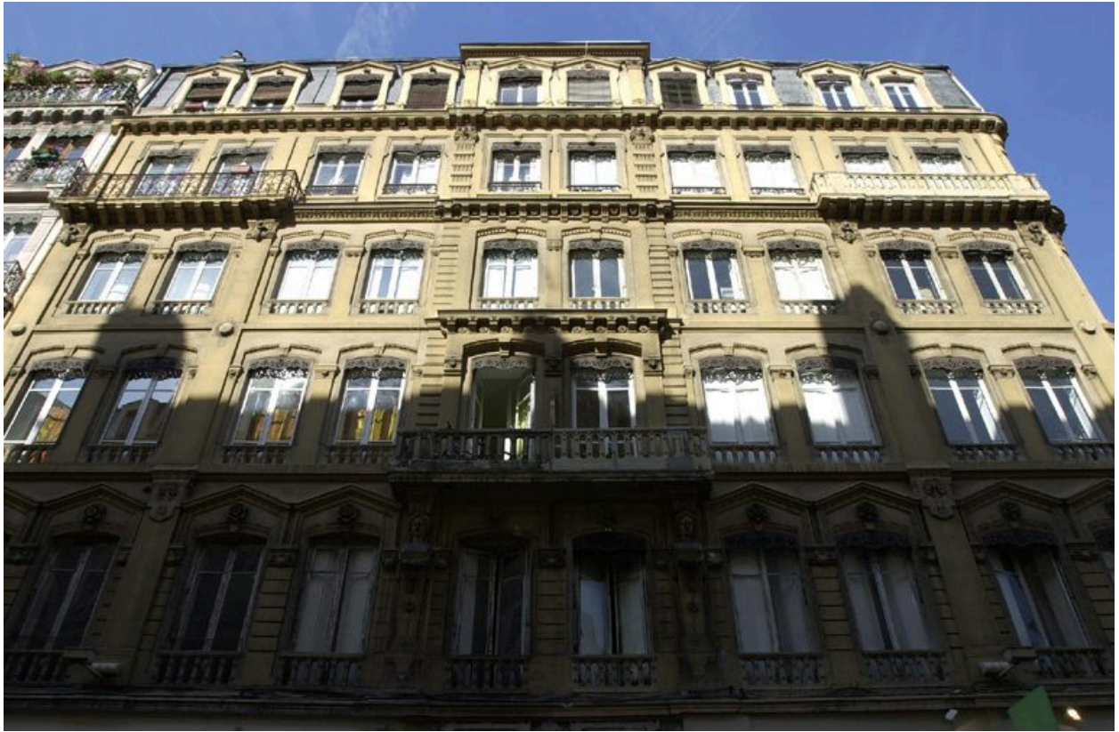
Élévation antérieure : les étages supérieurs