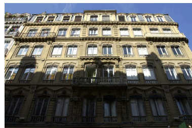
Elévation antérieure : les étages supérieurs IVR82_20046905303NUCA