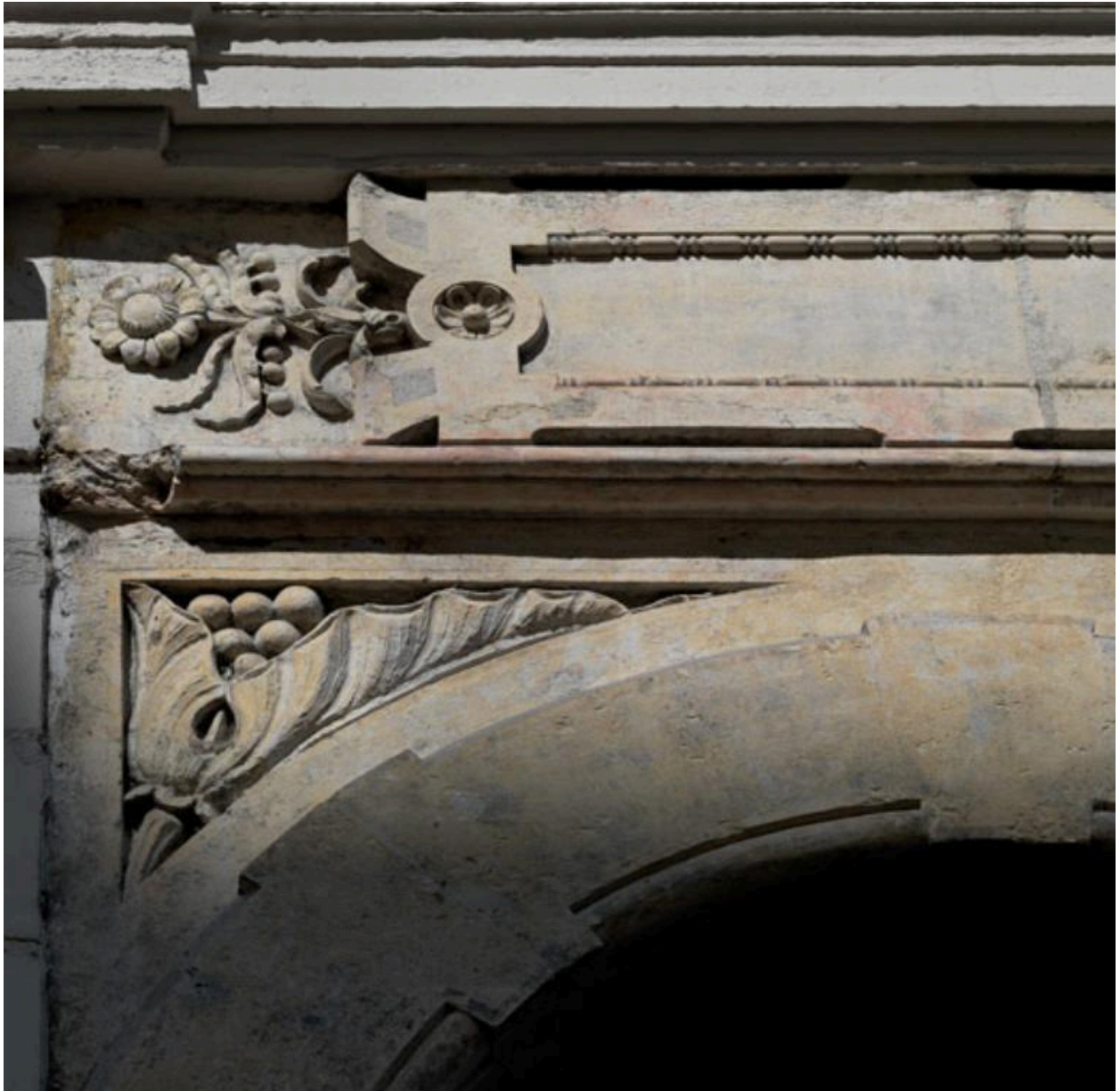
Ornement sculpté de la porte : marguerite prolongeant une table et arum lové dans un écoinçon