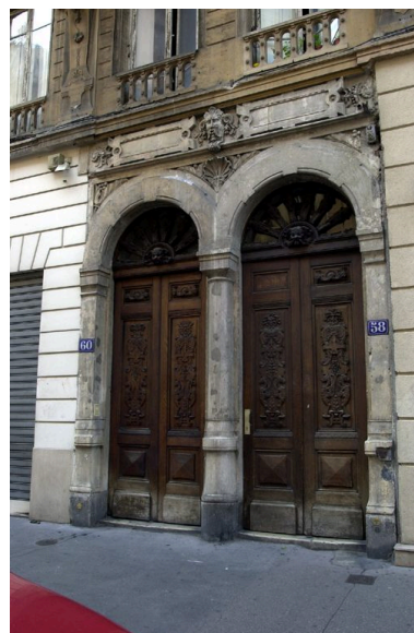
La porte jumelée avec celle de l'immeuble sis au 60