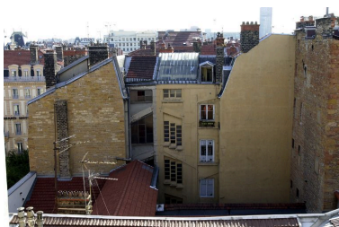
Elévations latérale et postérieure IVR82_20046905301NUCA