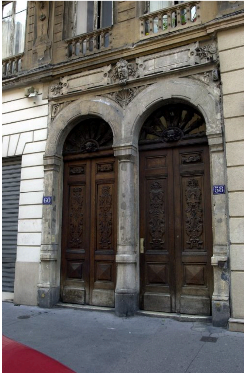
La porte jumelée avec celle de l'immeuble sis au 60