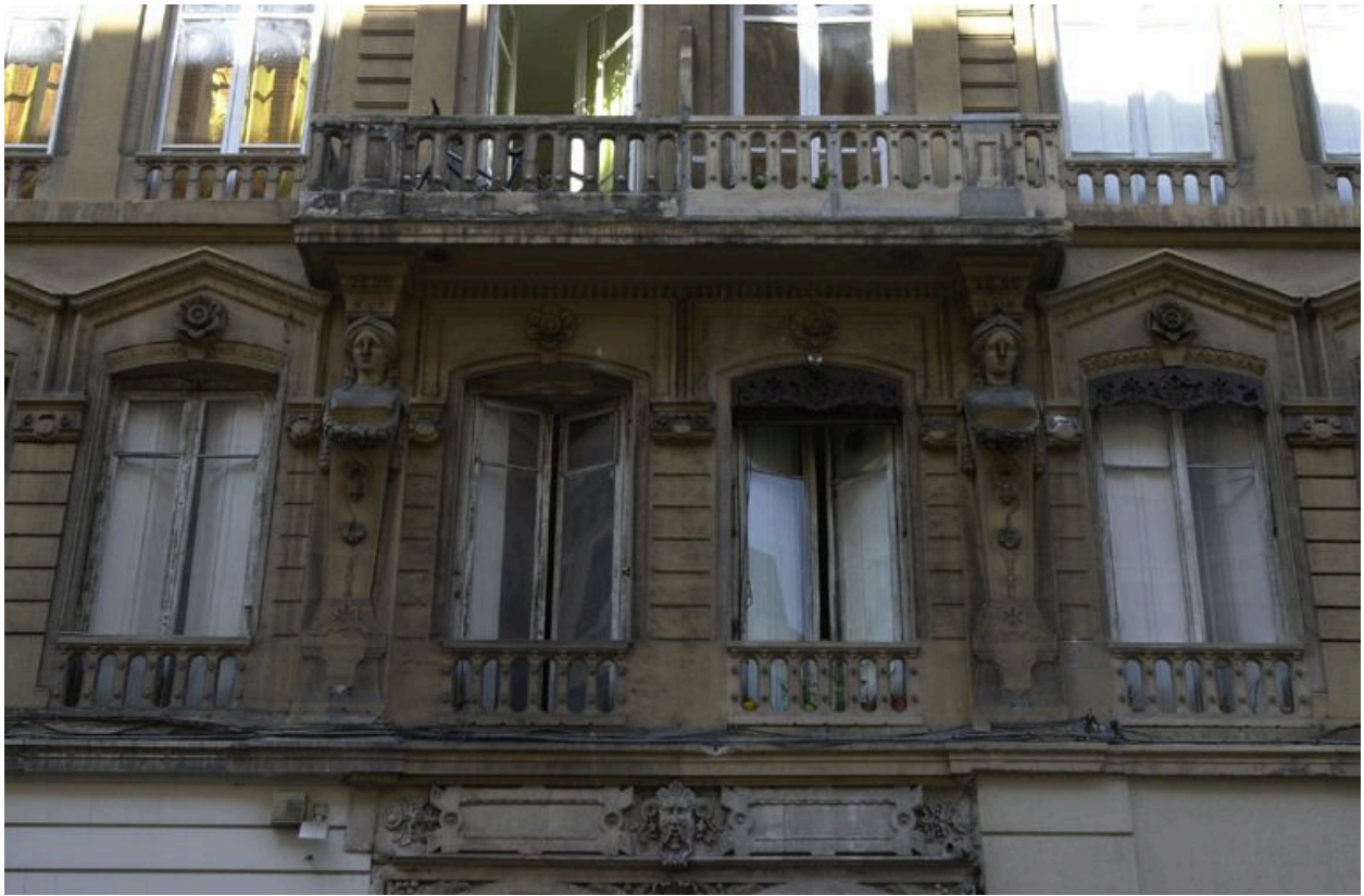
Élévation antérieure, premier étage carré : les travées centrales