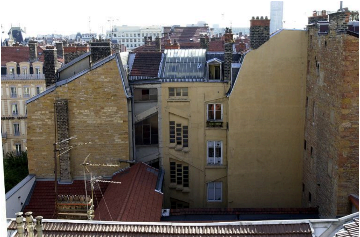
Elévations latérale et postérieure