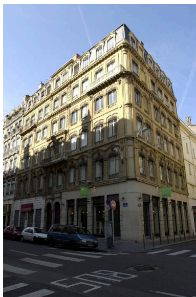
Vue générale IVR82_20046905300NUCA