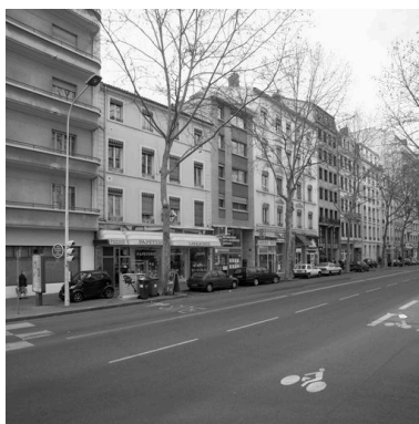
Vue générale depuis l'est IVR82_20056900611NUC