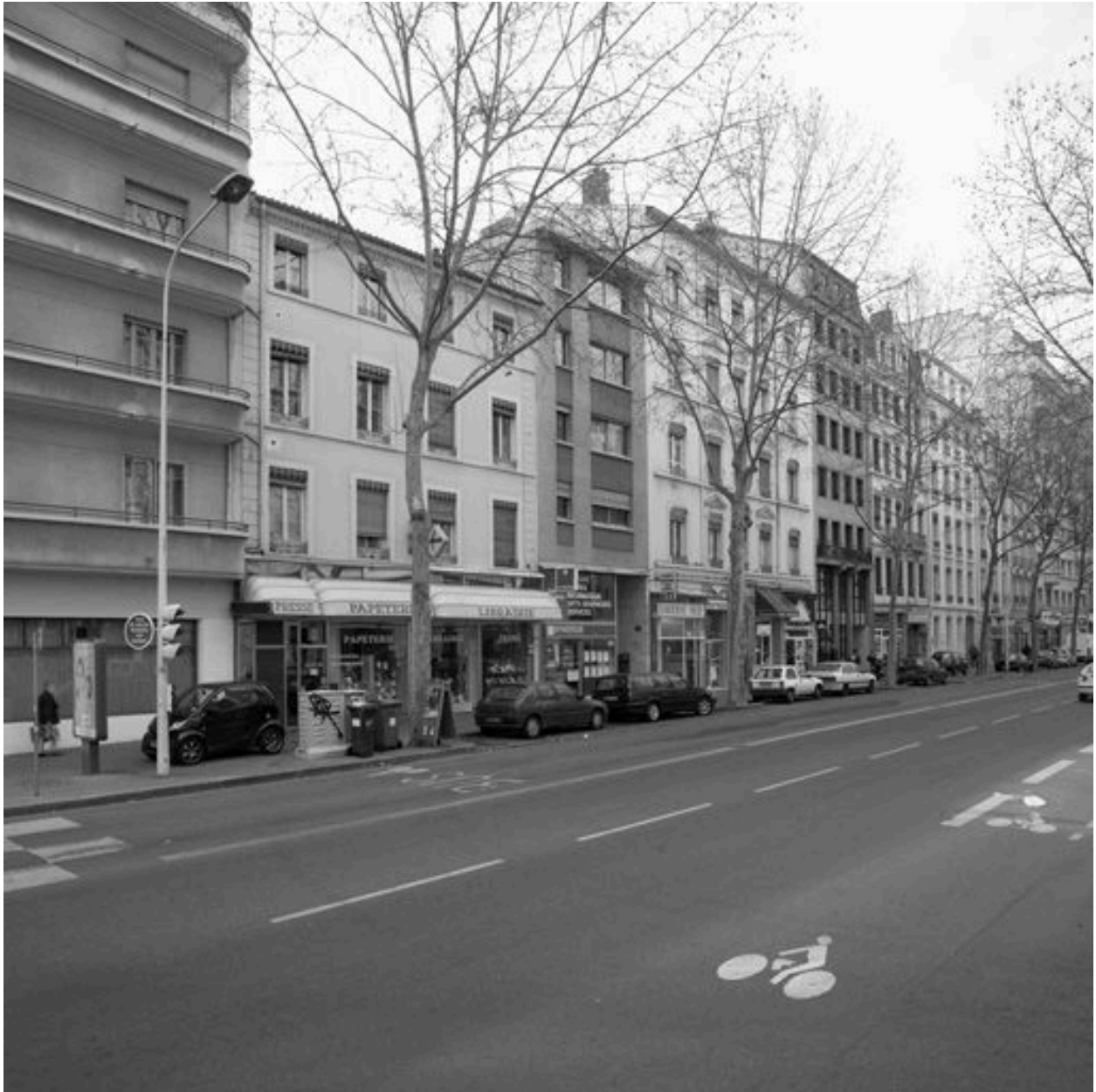
Vue générale depuis l'est