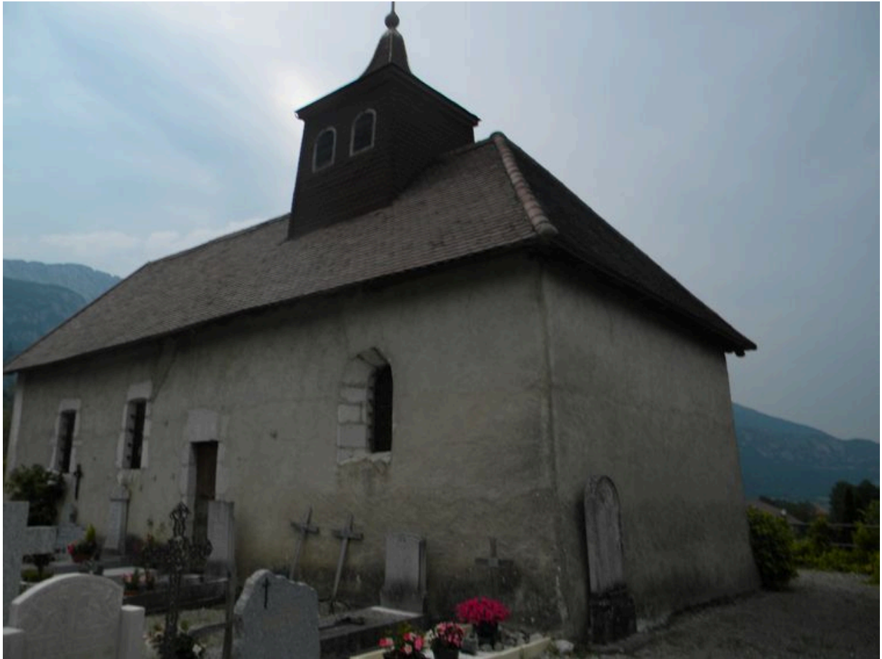
Vue du chevet plat.