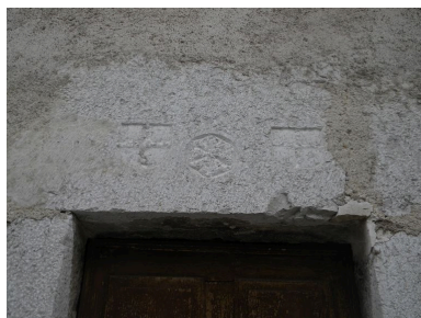
Détail des gravures sur le linteau de la porte latérale.