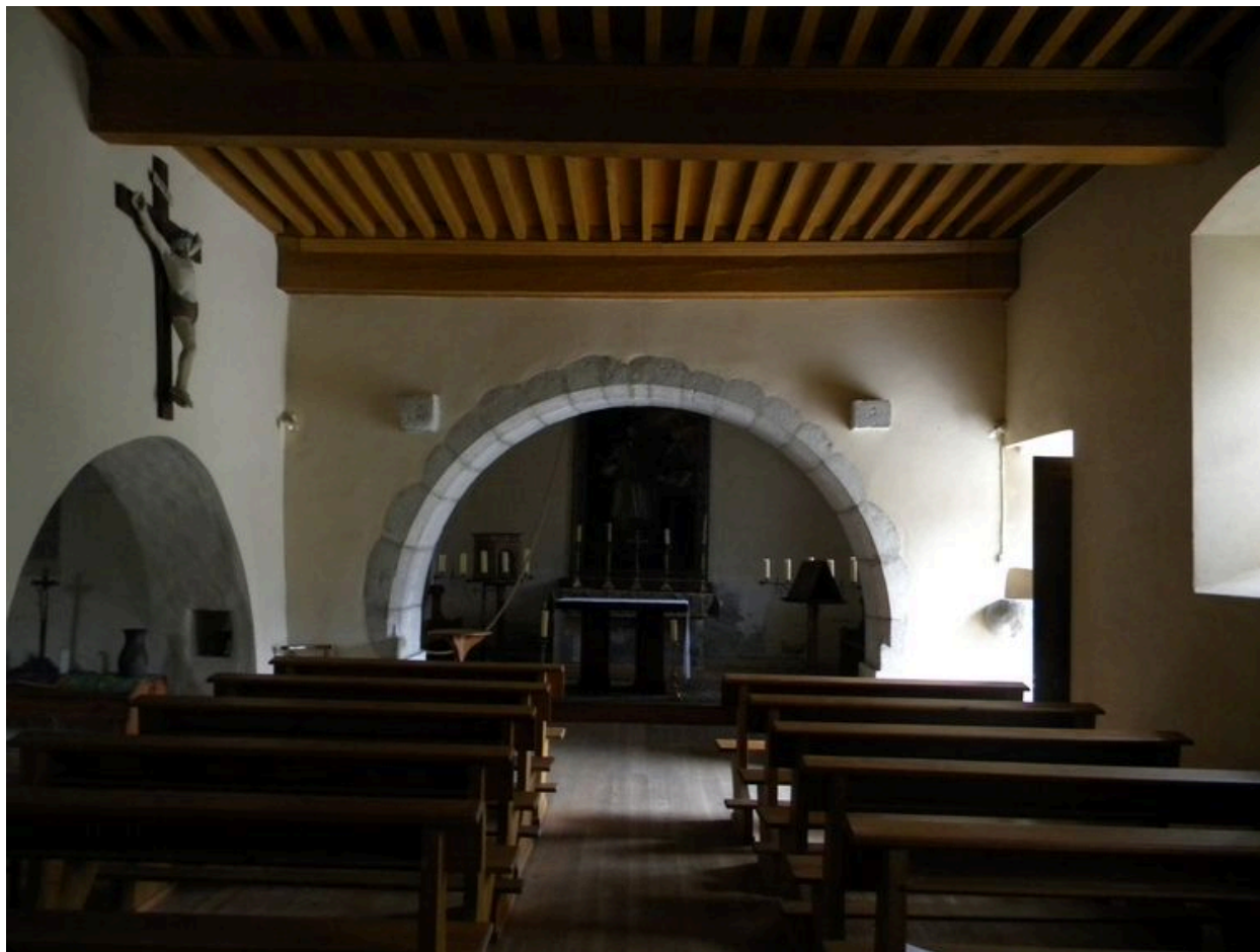
Vue de la nef avec son plafond apparent et du choeur en arrière plan.