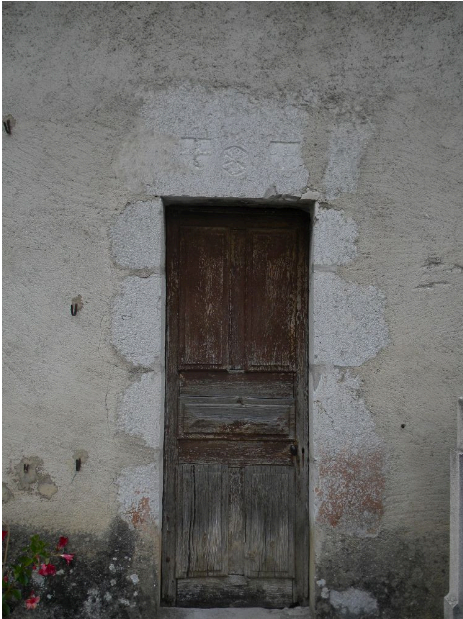
Vue de la porte latérale en façade sud.