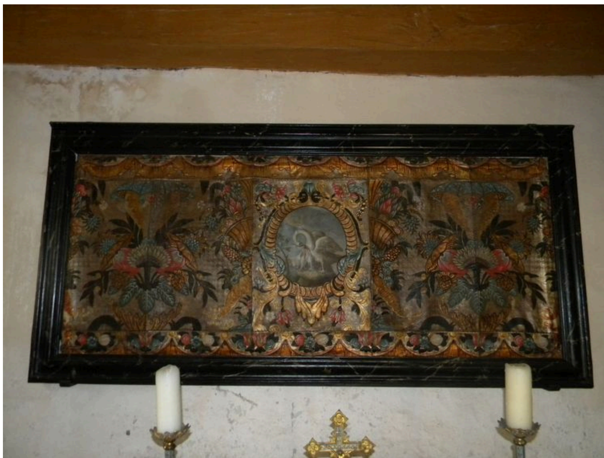
Détail de l'antependim dans la chapelle latérale.