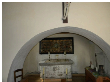
Autel latéral avec son antependium. IVR82_20127400595NUCA