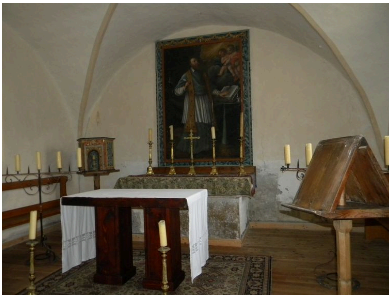
Détail du chœur voûté d'arêtes