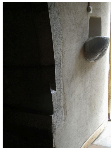
Détail d'un bénitier intégré dans la maçonnerie près du chœur.