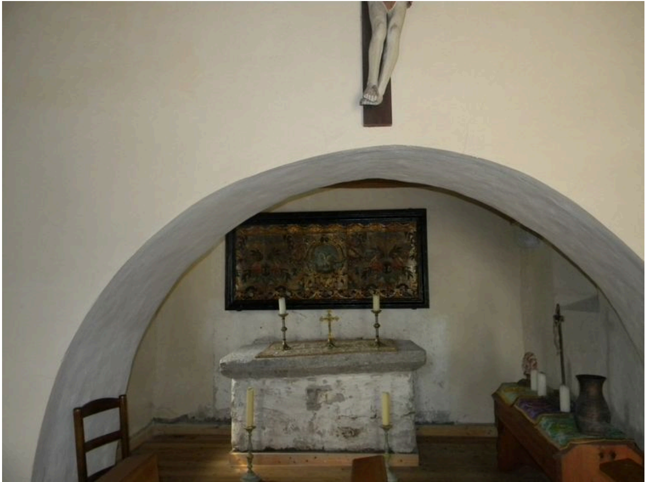
Autel latéral avec son antependium.