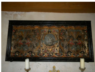
Détail de l'antependim dans la chapelle latérale.