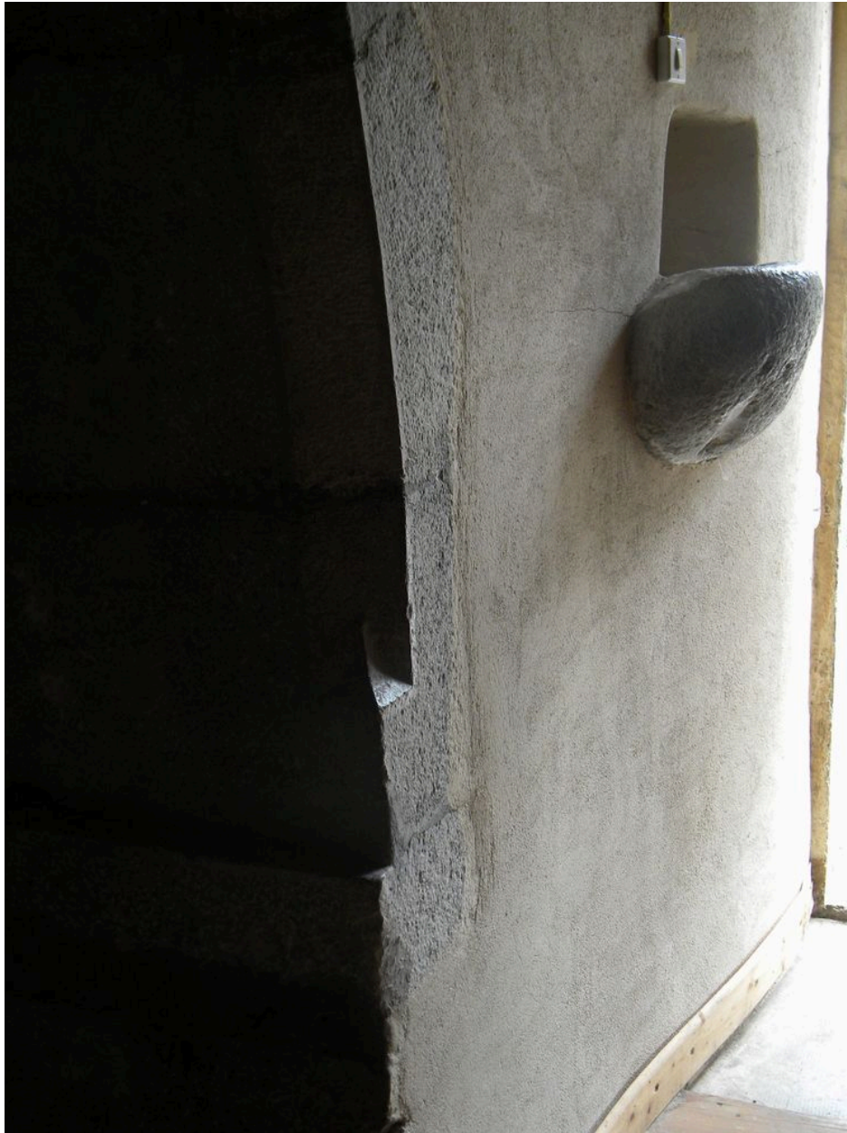
Détail d'un bénitier intégré dans la maçonnerie près du chœur.