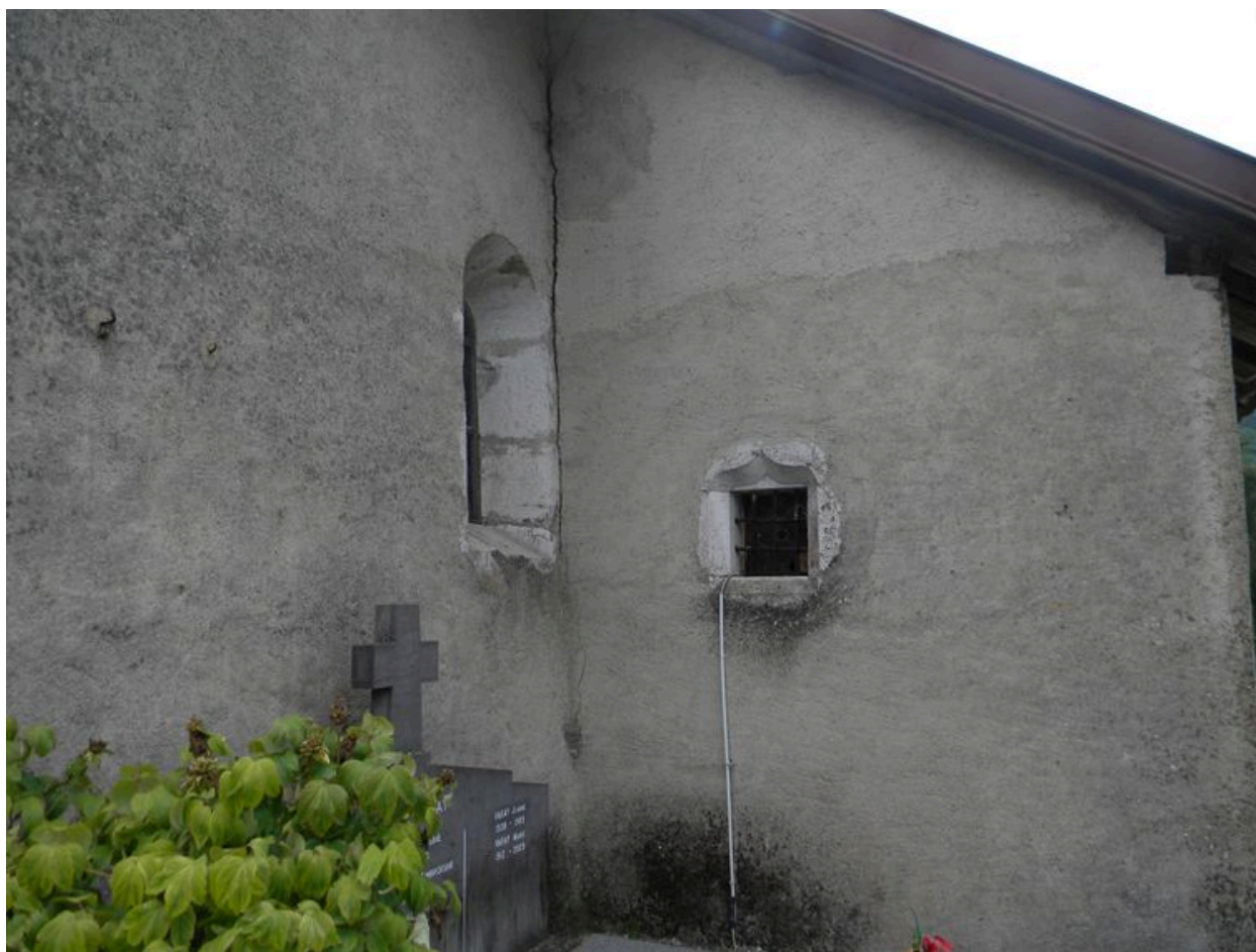
Vue extérieure de la chapelle latérale percée d'une fenêtre à accolade.