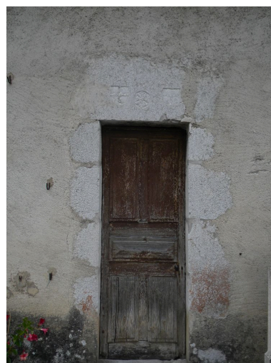
Vue de la porte latérale en façade sud.