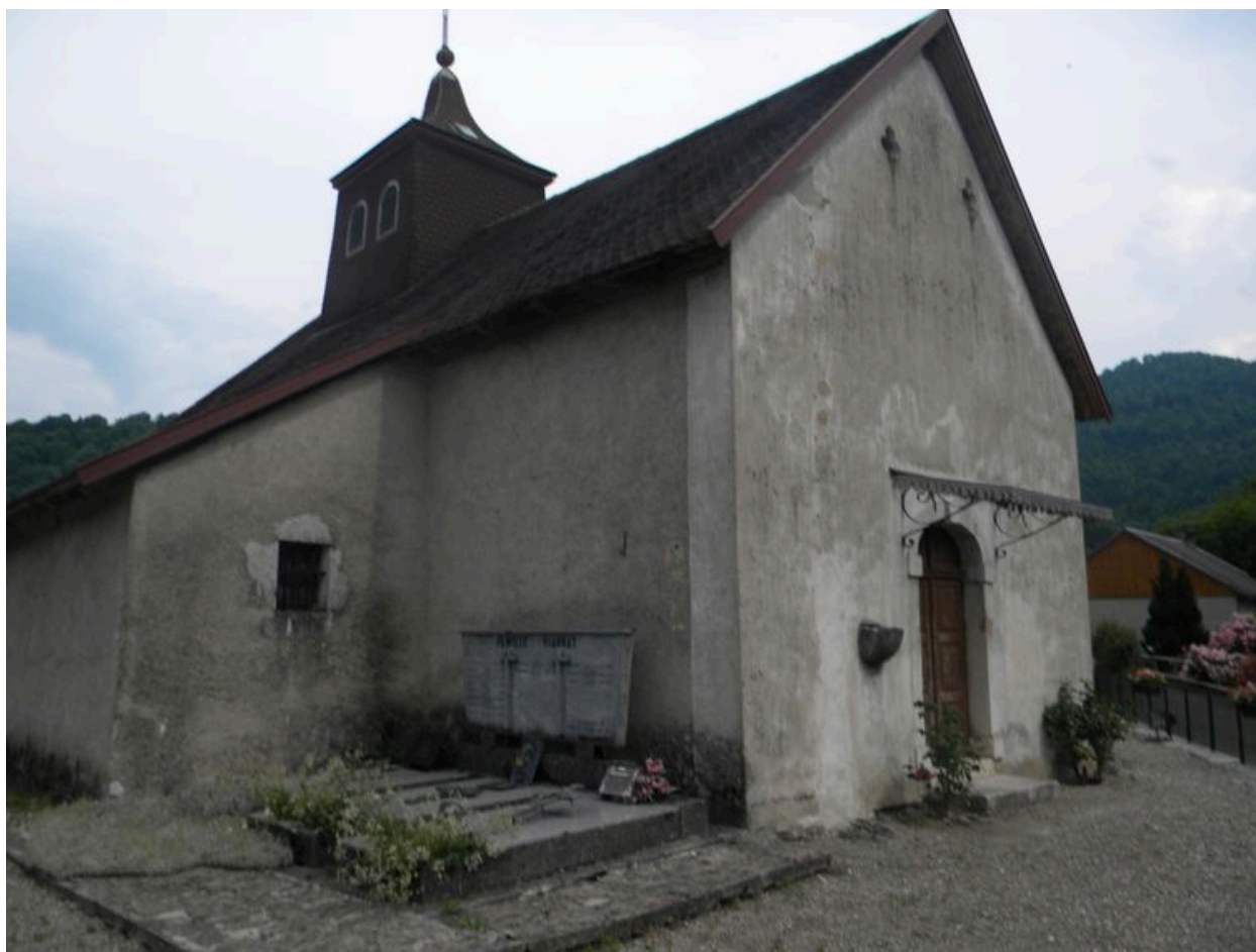
Vue de la façade nord.