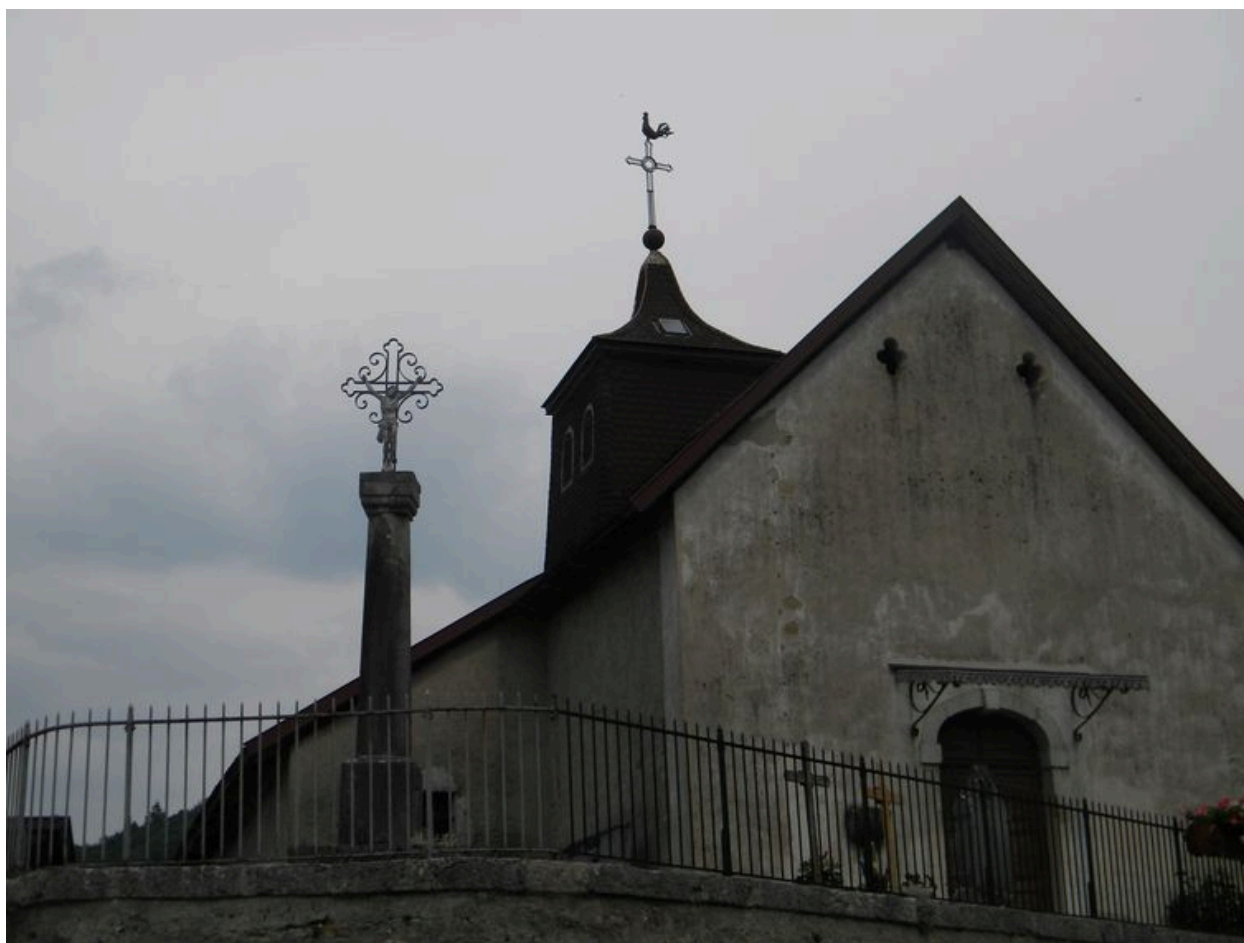
Vue de face en contre plongée.