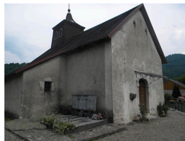
Vue de la façade nord. IVR82_20127400588NUCA