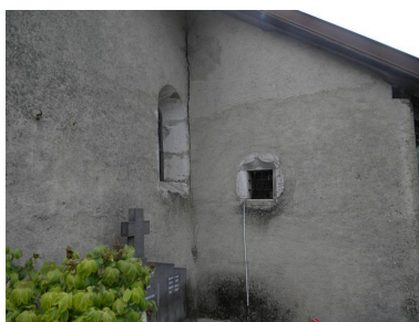
Vue extérieure de la chapelle latérale percée d'une fenêtre à accolade.