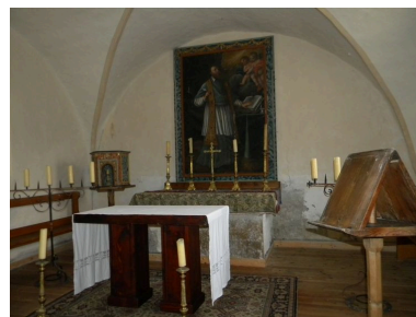
Détail du chœur voûté d'arêtes IVR82_20127400594NUCA