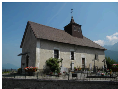
Vue générale. IVR82_20127400586NUCA