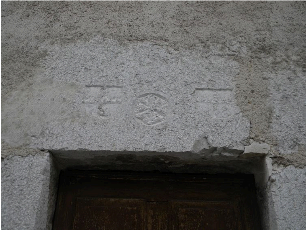
Détail des gravures sur le linteau de la porte latérale.