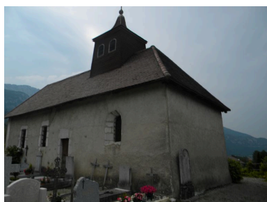
Vue du chevet plat.