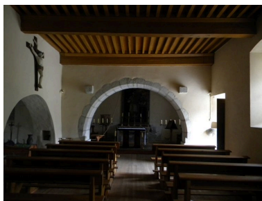
Vue de la nef avec son plafond apparent et du chœur en arrière plan.