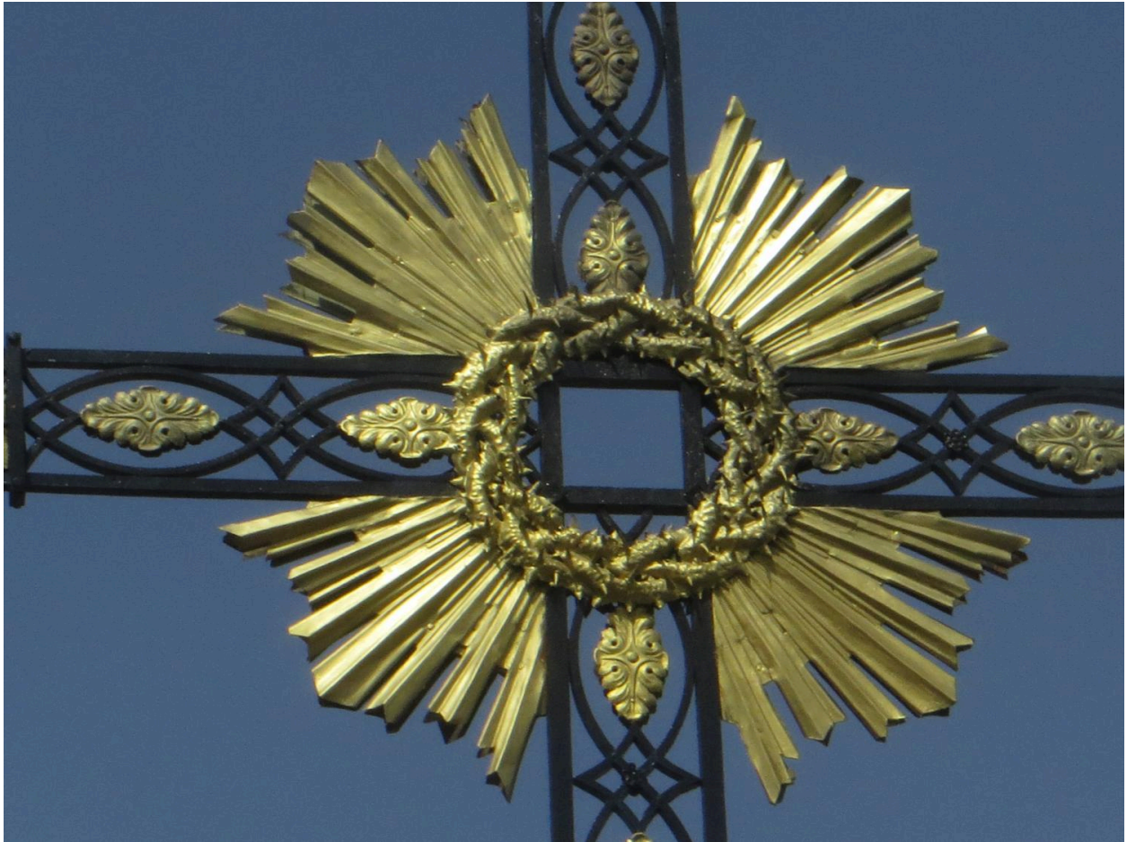
Couronne d'épines et nuées