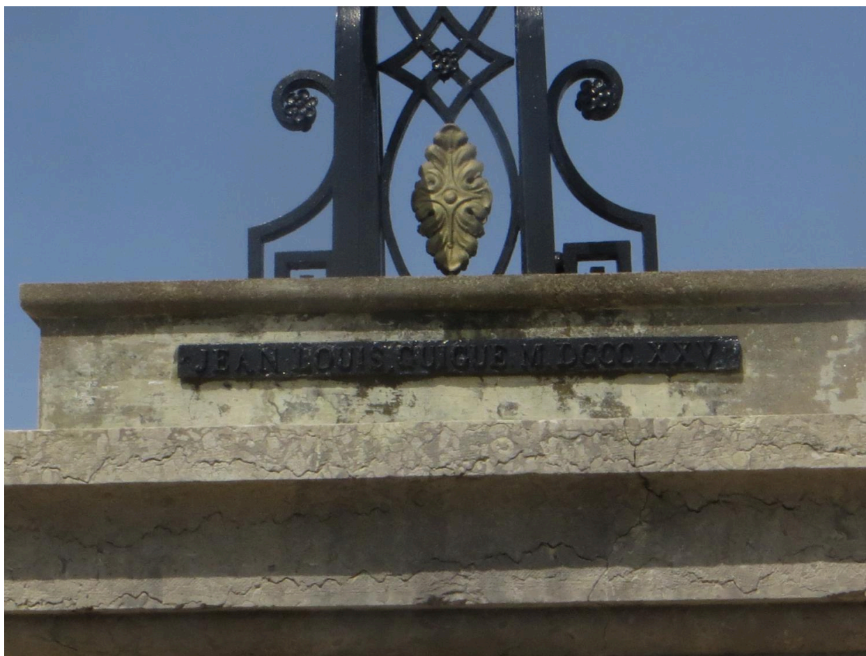
Inscription rapportée en haut du piédestal, sous la croix