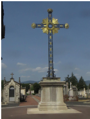
Vue générale IVR84_20216900585NUCA