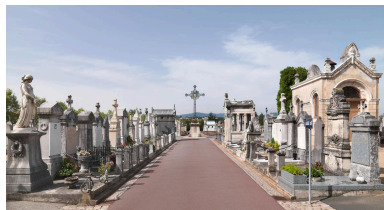
Vue de situation IVR82_20086902527NUCA