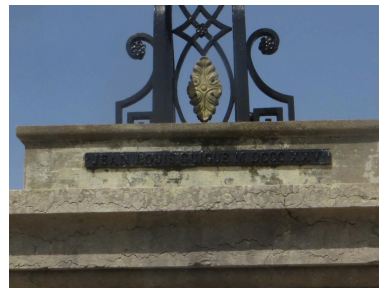
Inscription rapportée en haut du piédestal, sous la croix IVR84_20216900586NUCA