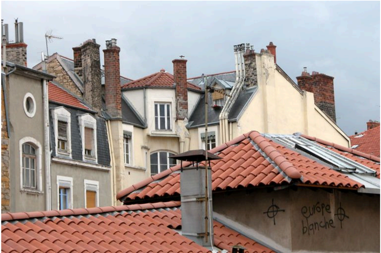
Élévation postérieure depuis le nord-ouest