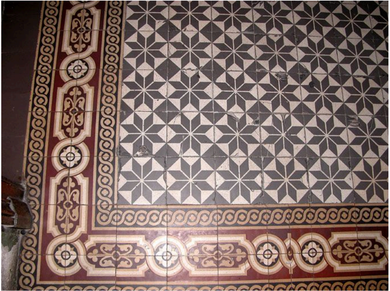
Carrelage en ciment moulé du vestibule