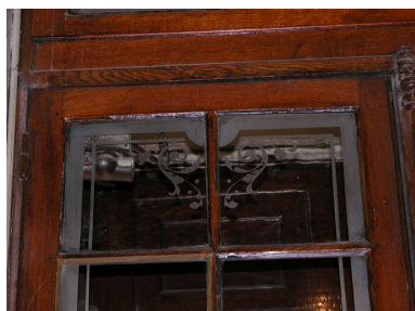
Détail des verres gravés de la porte du vestibule IVR82_20046904070NUCA