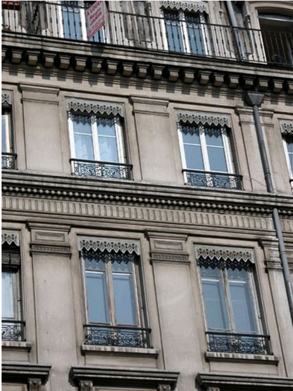
Détail des fenêtres des deux derniers étages