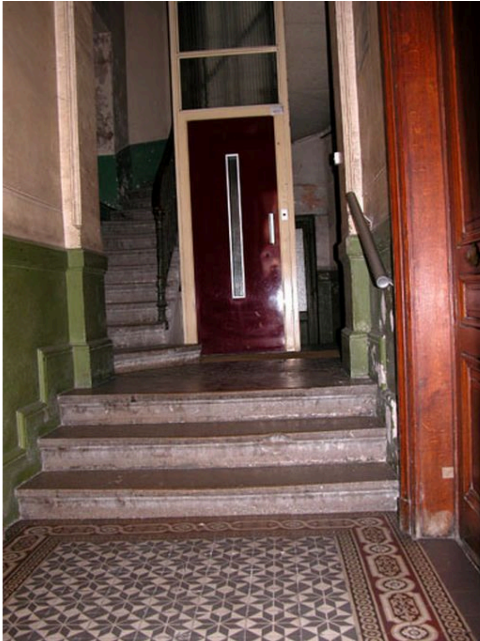
Vue d'ensemble du vestibule