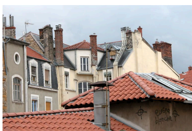
Elévation postérieure depuis le nord-ouest IVR82_20046904161NUCA