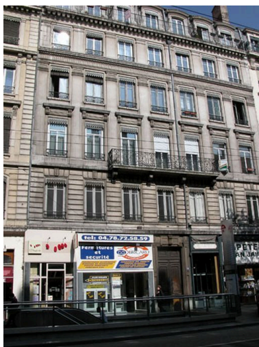
Elévation principale IVR82_20046904672NUCA