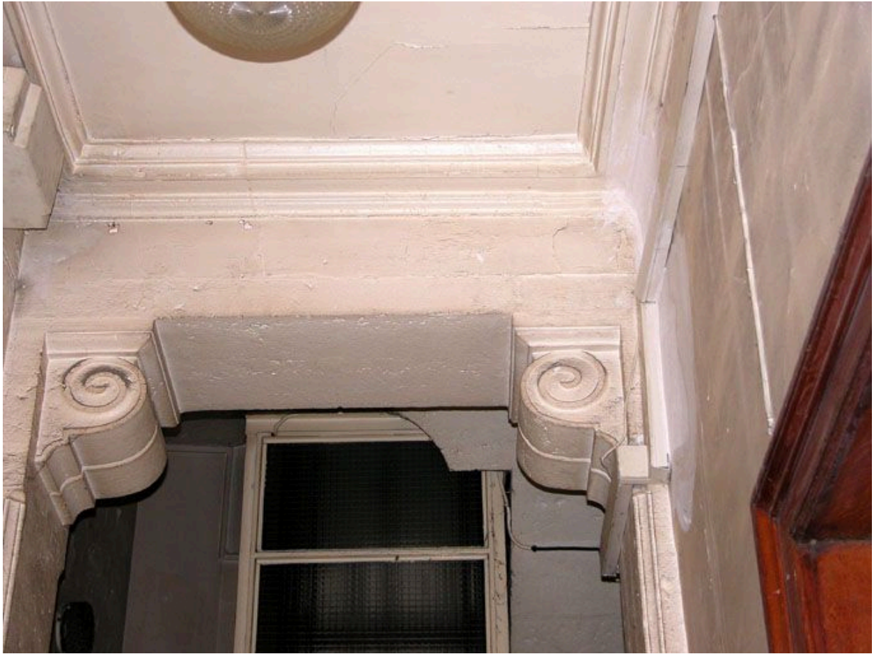
Détail de l'étrésillonement supportant le plafond du vestibule