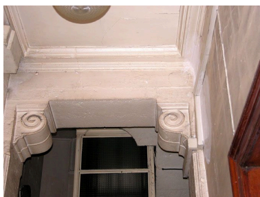
Détail de l'étrésillonement supportant le plafond du vestibule IVR82_20046904072NUCA