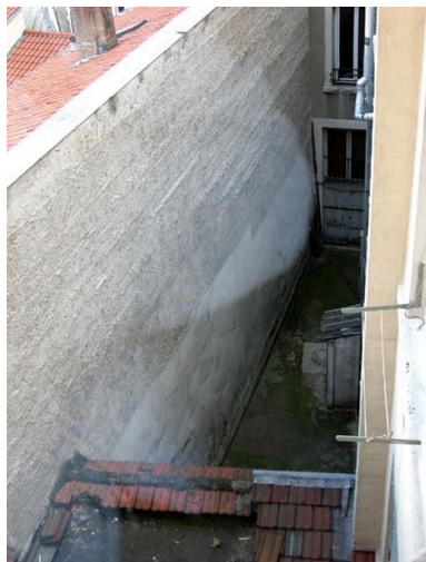
Vue de la cour depuis le 16 avenue Jean-Jaurès IVR82_20046904162NUCA

Rupture d'alignement des élévations postérieures des 12-16 avenue Jean-Jaurès IVR82_20046904683NUCA