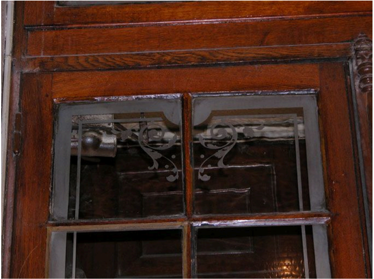
Détail des verres gravés de la porte du vestibule