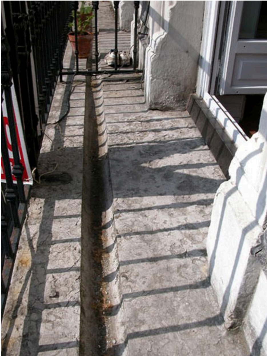
Détail de la rigole du balcon filant devant l'étage de comble