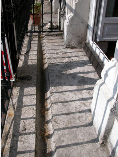
Détail de la rigole du balcon filant devant l'étage de comble