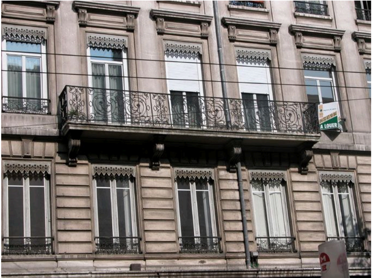
Détail du balcon central