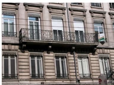
Détail du balcon central IVR82_20046904673NUCA