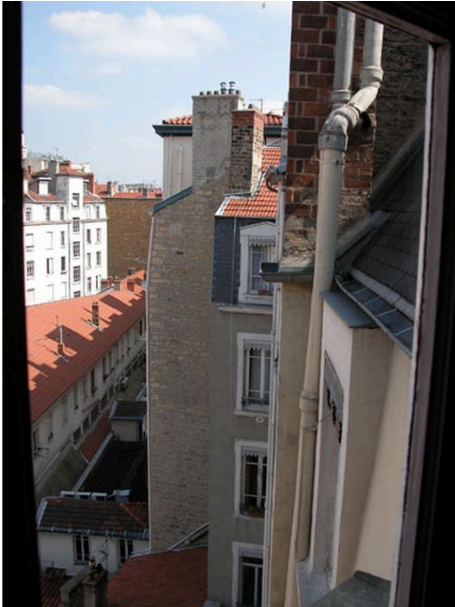
Rupture d'alignement des élévations postérieures des 12-16 avenue Jean-Jaurès