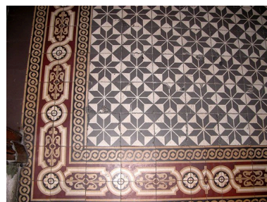
Carrelage en ciment moulé du vestibule IVR82_20046904073NUCA