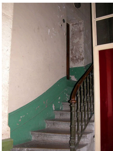
Départ de l'escalier et vue de la porte de la conciergerie IVR82_20046904074NUCA