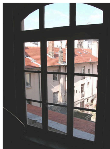
Vue d'une baie de l'escalier IVR82_20046904068NUCA