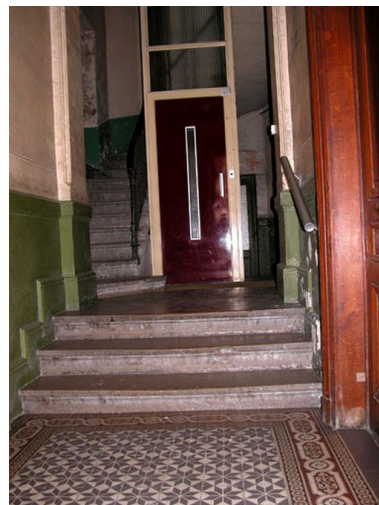
Vue d'ensemble du vestibule IVR82_20046904069NUCA