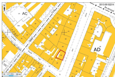
Plan masse et de situation, extrait de http://cadastre.gouv.fr IVR82_20136902214NUCA