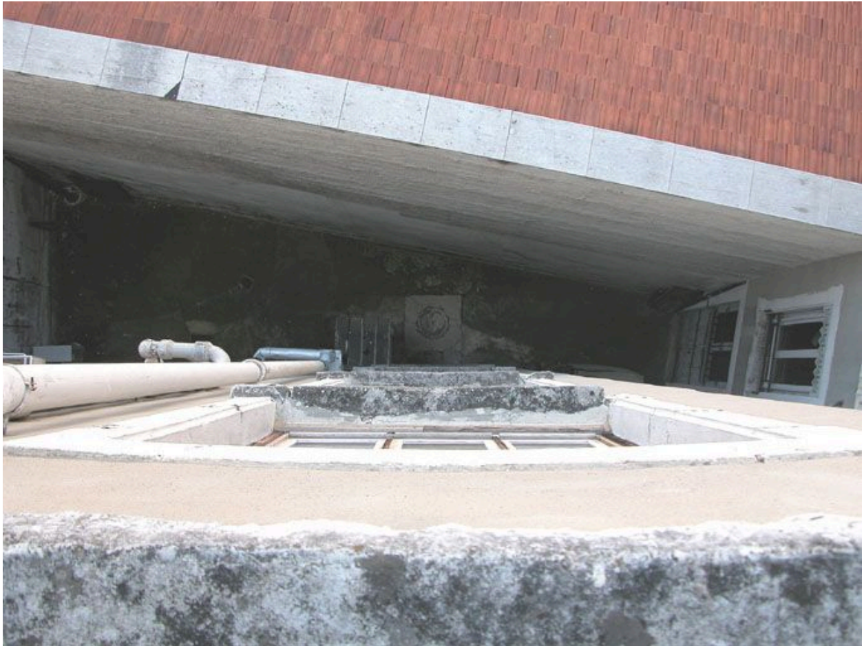
Vue de la cour depuis la cage d'escalier