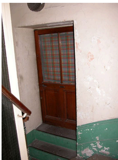
Porte de la conciergerie IVR82_20046904075NUCA