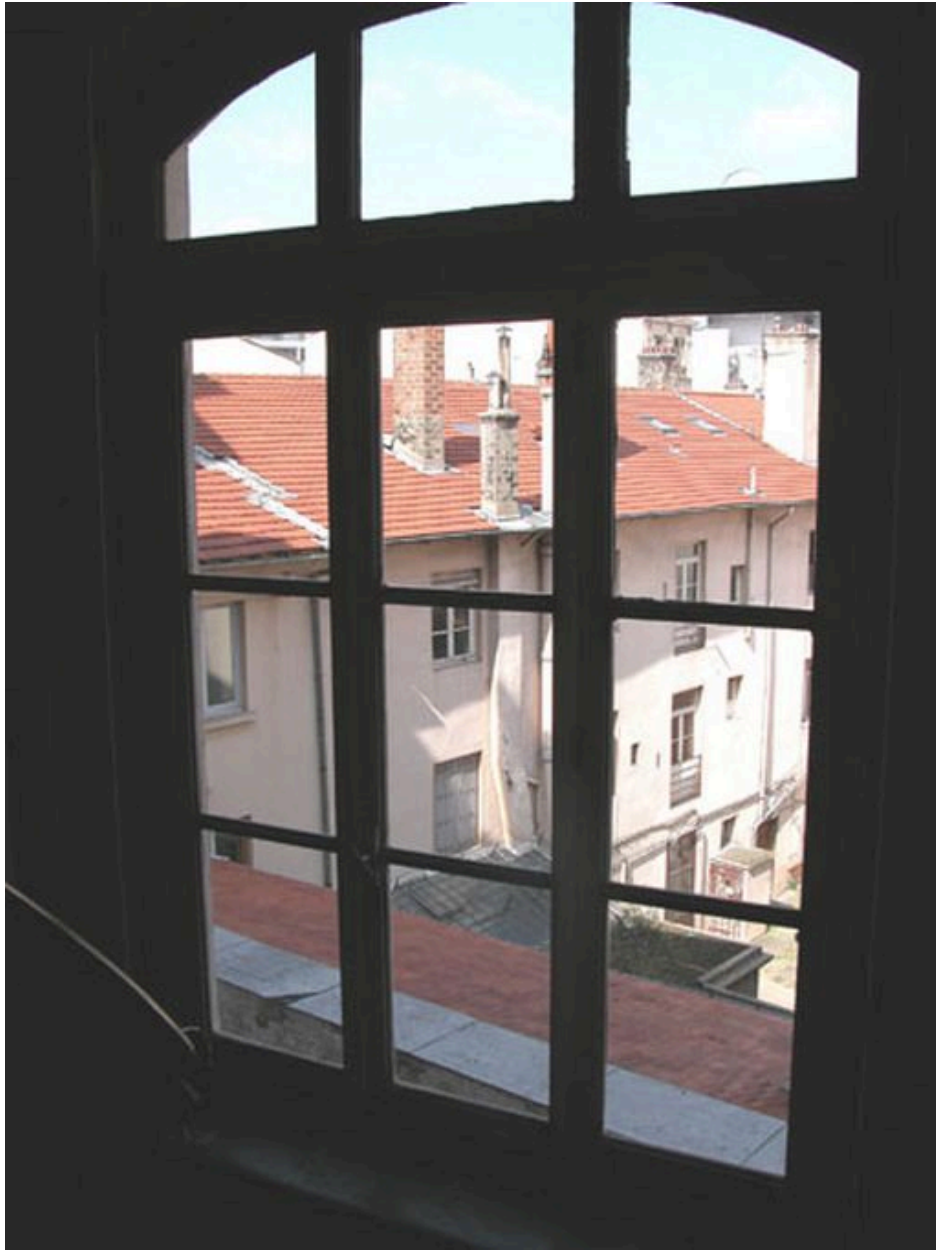
Vue d'une baie de l'escalier