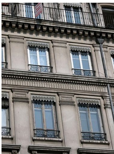
Détail des fenêtres des deux derniers étages IVR82_20046904674NUCA