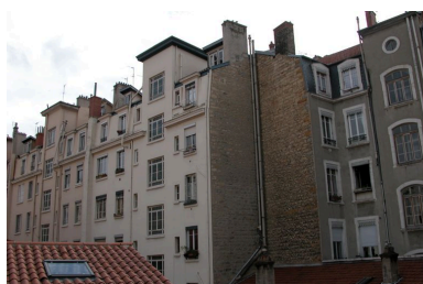
Elévation postérieure IVR82_20046904611NUCA