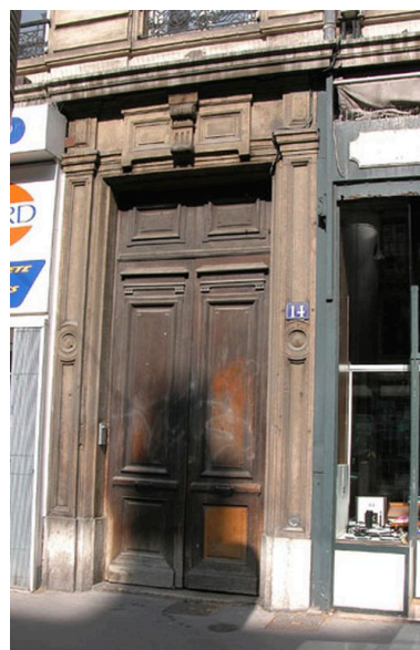
Porte d'entrée IVR82_20046904675NUCA