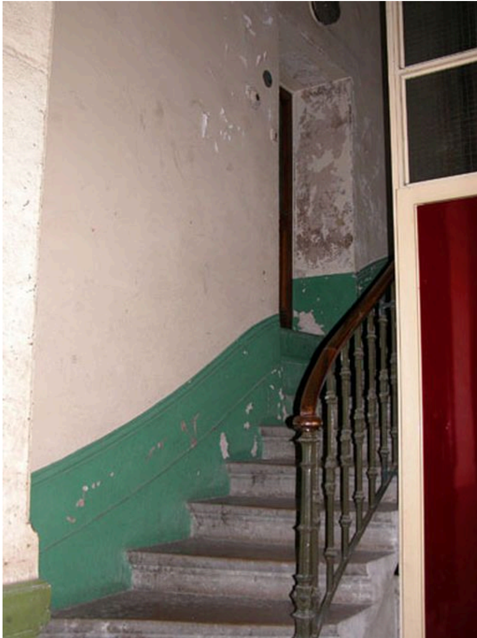
Départ de l'escalier et vue de la porte de la conciergerie