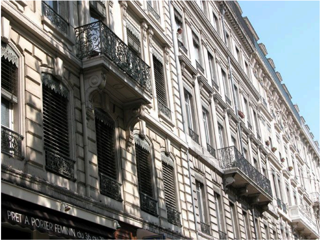
Alignement des façades 16-14-10 avenue Jean-Jaurès