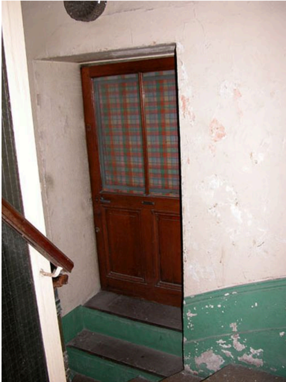
Porte de la conciergerie