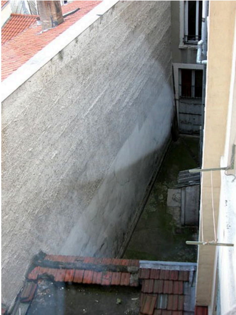
Vue de la cour depuis le 16 avenue Jean-Jaurès