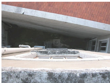
Vue de la cour depuis la cage d'escalier IVR82_20046904056NUCA