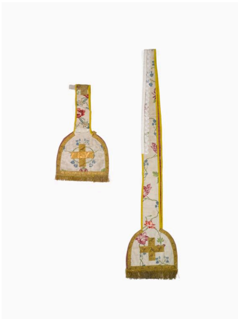
Vue générale de l'étole et du manipule