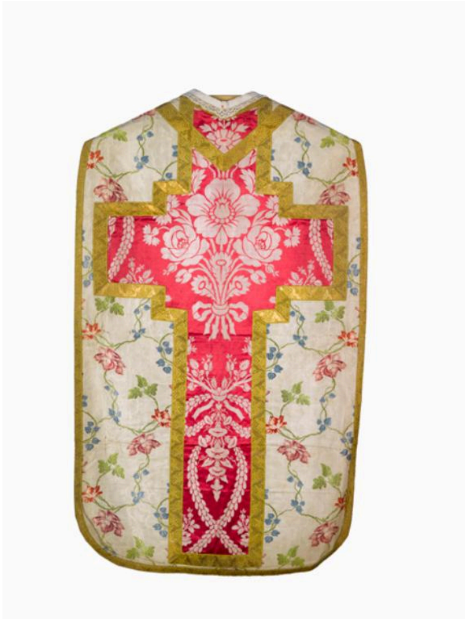
Vue générale du dos de la chasuble