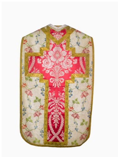
Vue générale du dos de la chasuble IVR84_20174300110NUC4A