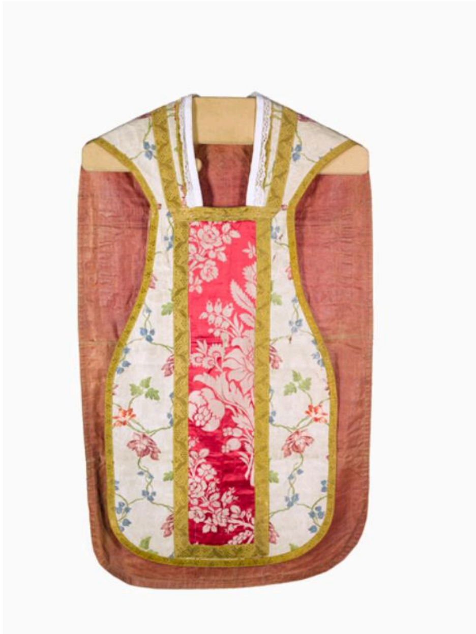
Vue du devant de la chasuble