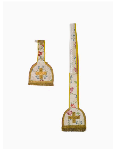
Vue générale de l'étole et du manipule