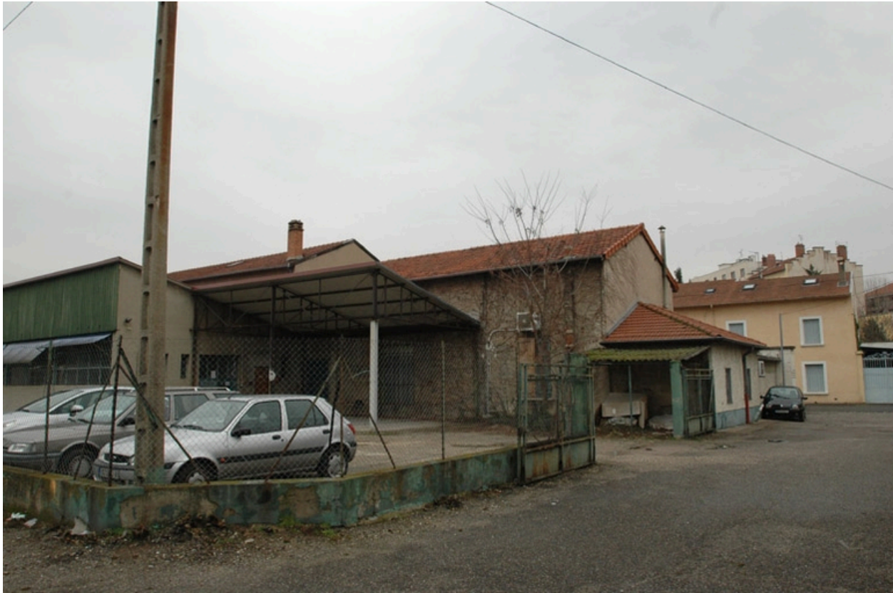
Vue sur cour, détail des entrepôt et hangars.