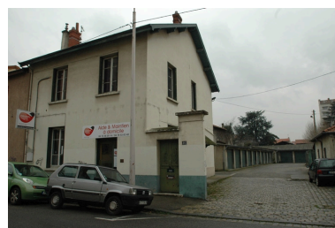
Entrée principale, angle nord est.