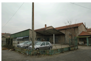
Vue sur la cour, angle sud ouest. IVR82_20096901683NUCA