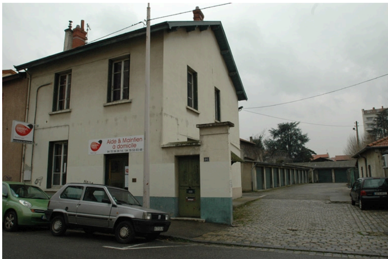
Entrée principale, angle nord est.