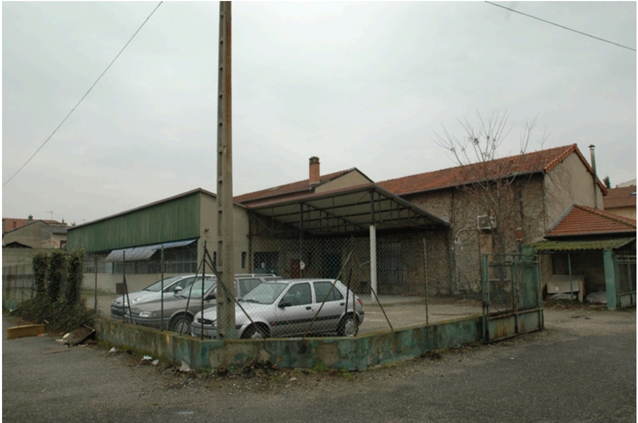
Vue sur la cour, angle sud ouest.