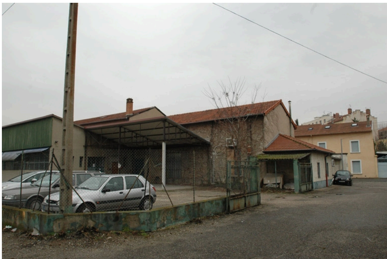
Vue sur cour, détail des entrepôt et hangars.