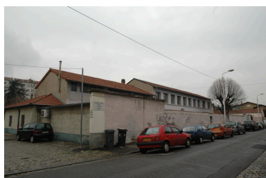
Vue générale, angle sud est. IVR82_20096901680NUCA