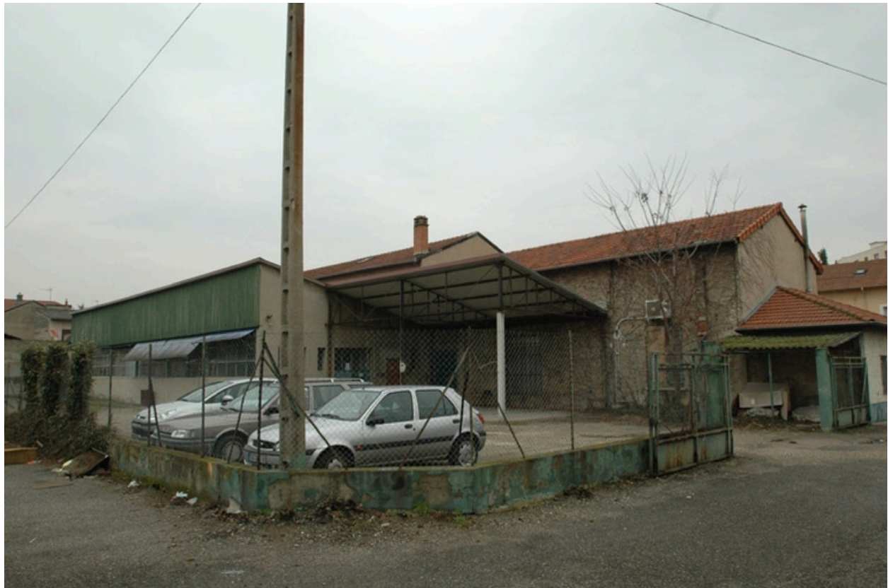
Vue sur cour, façade arrière des entrepôts et hangars.