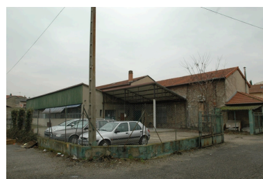
Vue sur cour, façade arrière des entrepôts et hangars. IVR82_20096901685NUCA