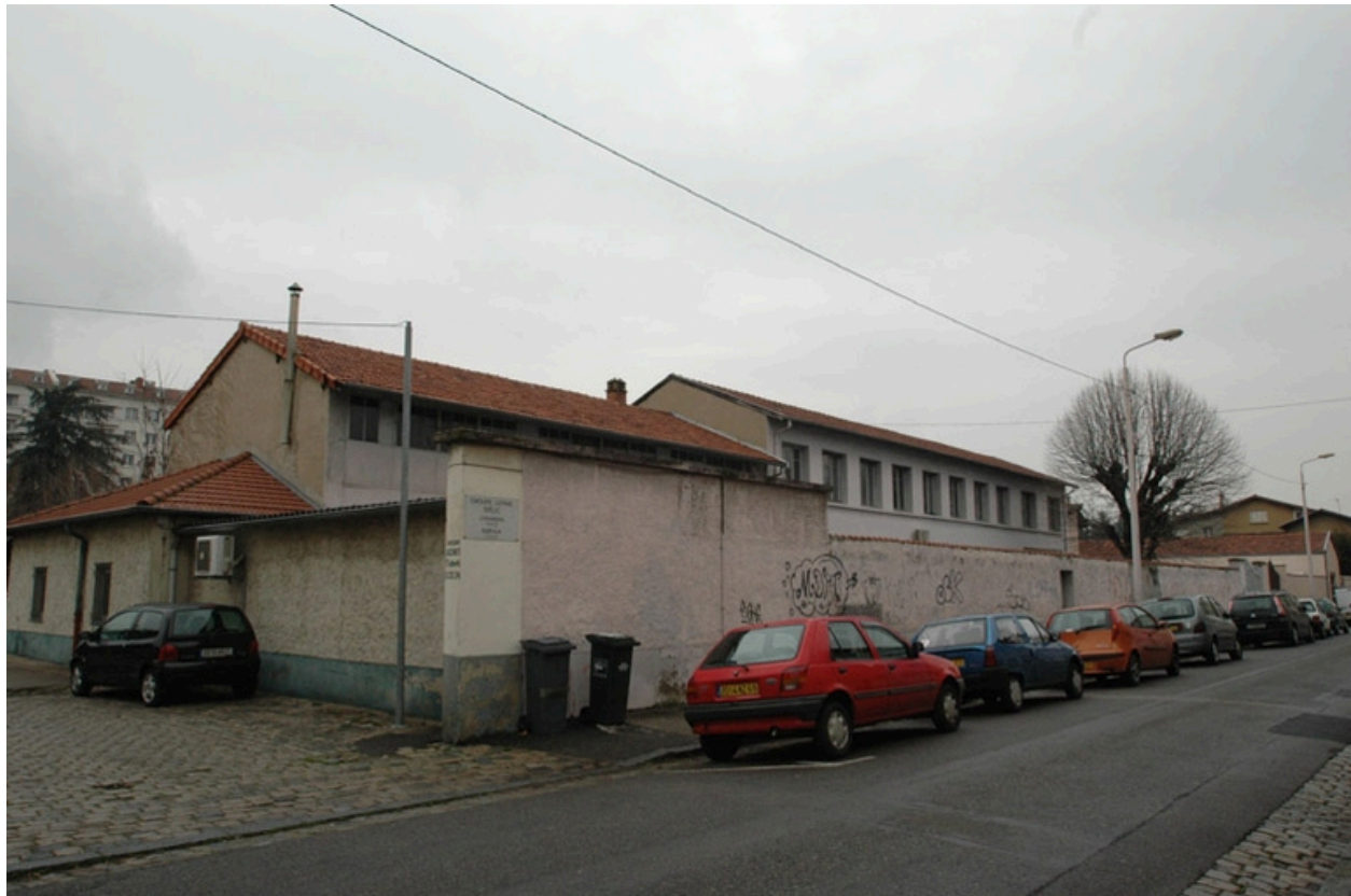
Vue générale, angle sud est.