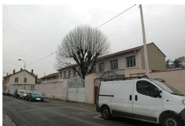
Façade principale, vue nord est.