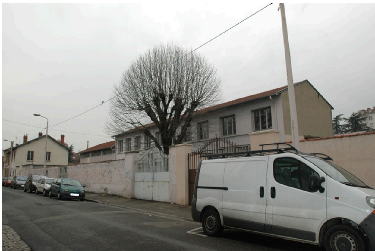
Façade principale, vue nord est.