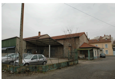
Vue sur cour, détail des entrepôt et hangars. IVR82_20096901684NUCA