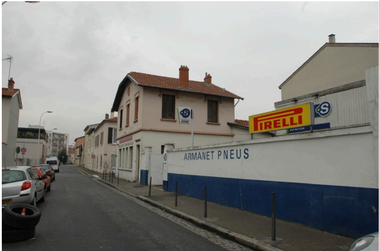
Vue est, rue du Capitaine.