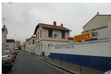
Vue est, rue du Capitaine. IVR82_20096901689NUCA