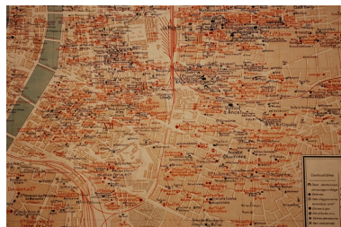
Extrait de la carte industrielle du Rhône (AMLyon), 1932, Pascal, constructions mécaniques