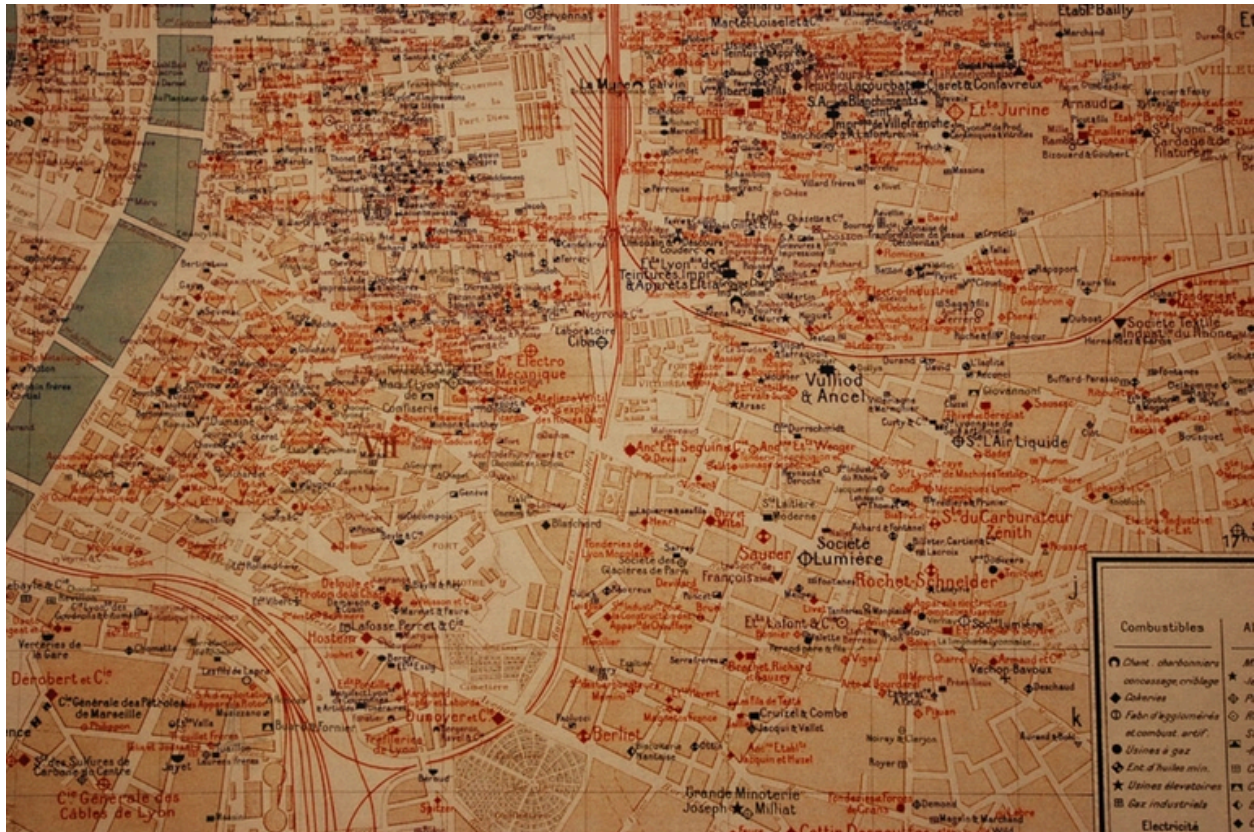
Extrait de la carte industrielle du Rhône, 1932, Pascal, constructions mécaniques