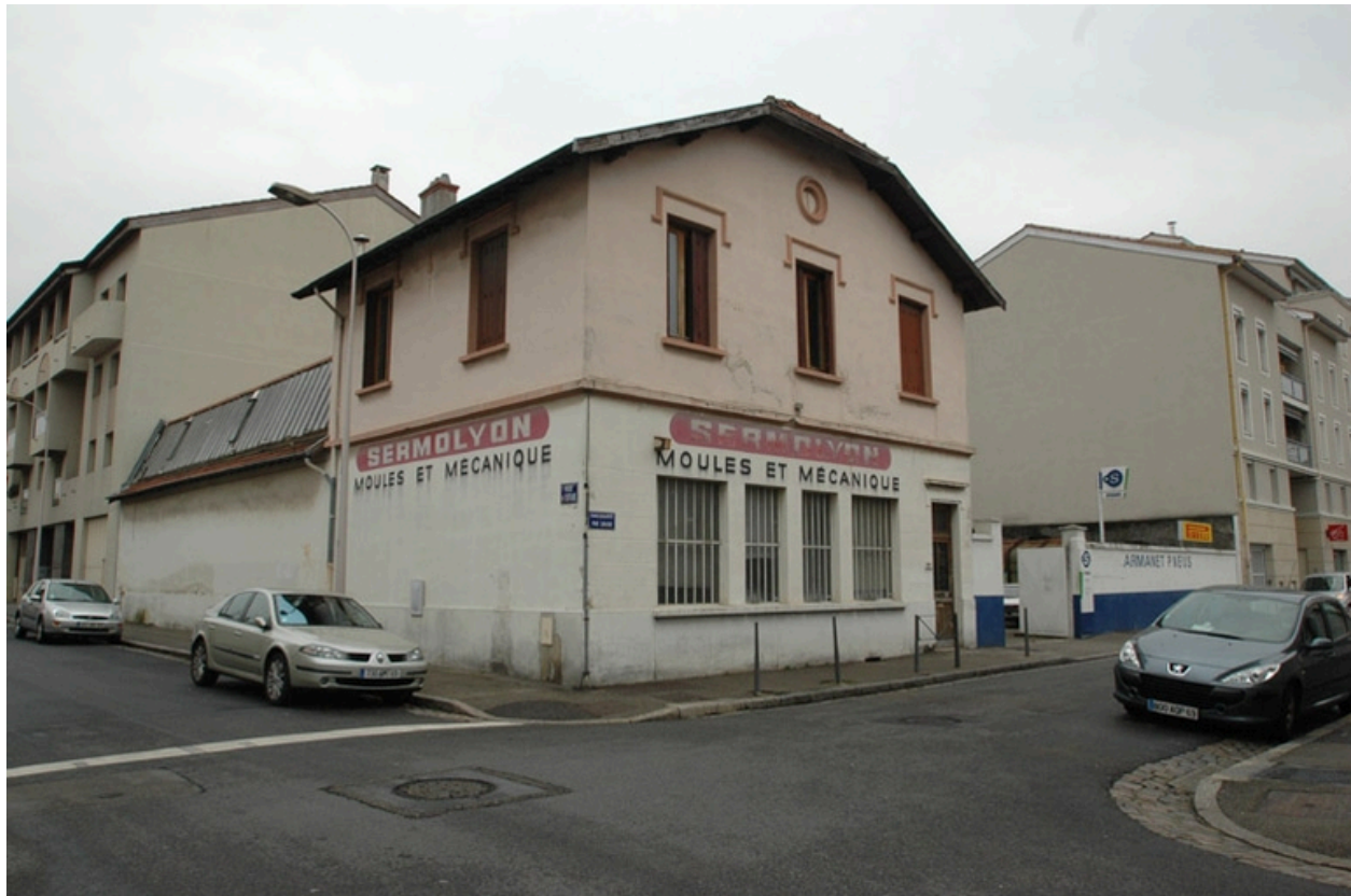
Vue générale, angle nord ouest.