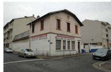
Vue générale, angle nord ouest. IVR82_20096901688NUCA