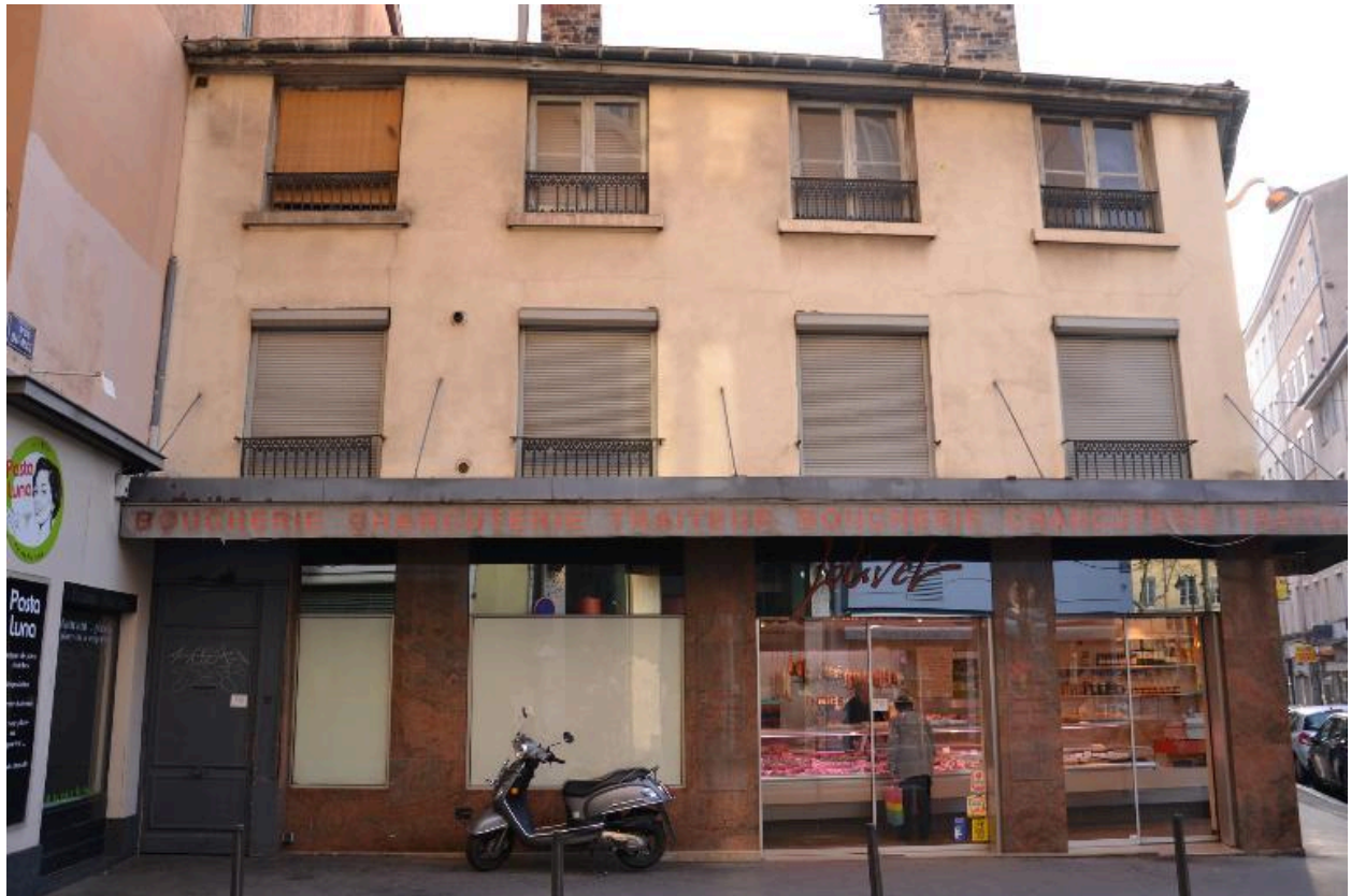
Vue d'ensemble façade ouest