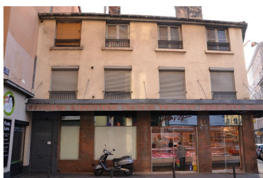
Vue d'ensemble façade ouest IVR82_20156900109NUCA