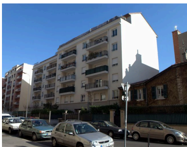
Vue générale depuis le sud-ouest IVR82_20116904973NUCA