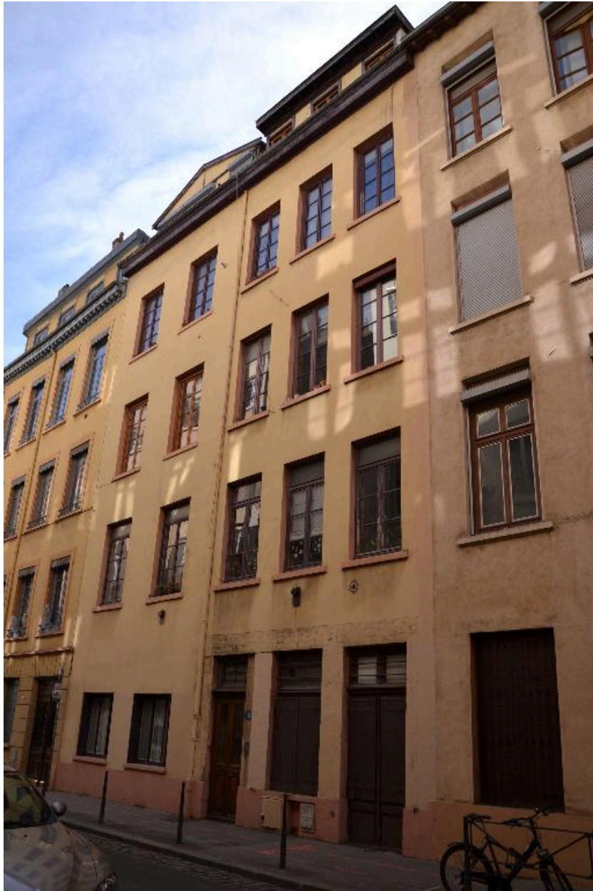
Vue d'ensemble façade nord