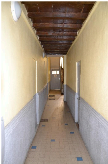
Entrée IVR82_20156900253NUCA