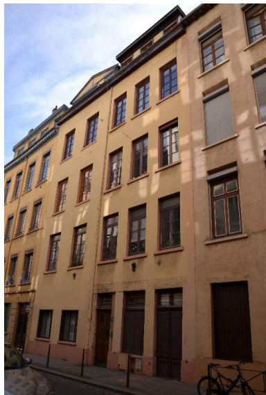
Vue d'ensemble façade nord IVR82_20156900252NUCA