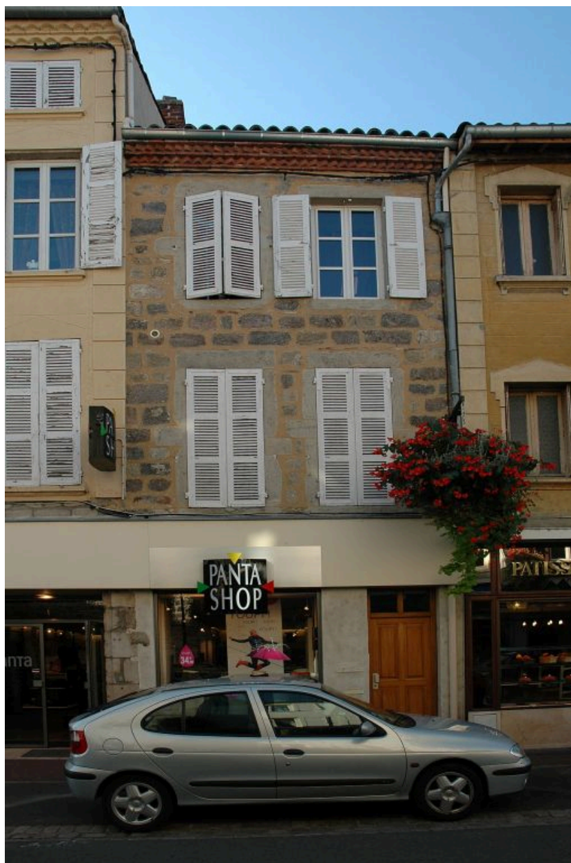
Vue générale sur la rue Tupinerie.