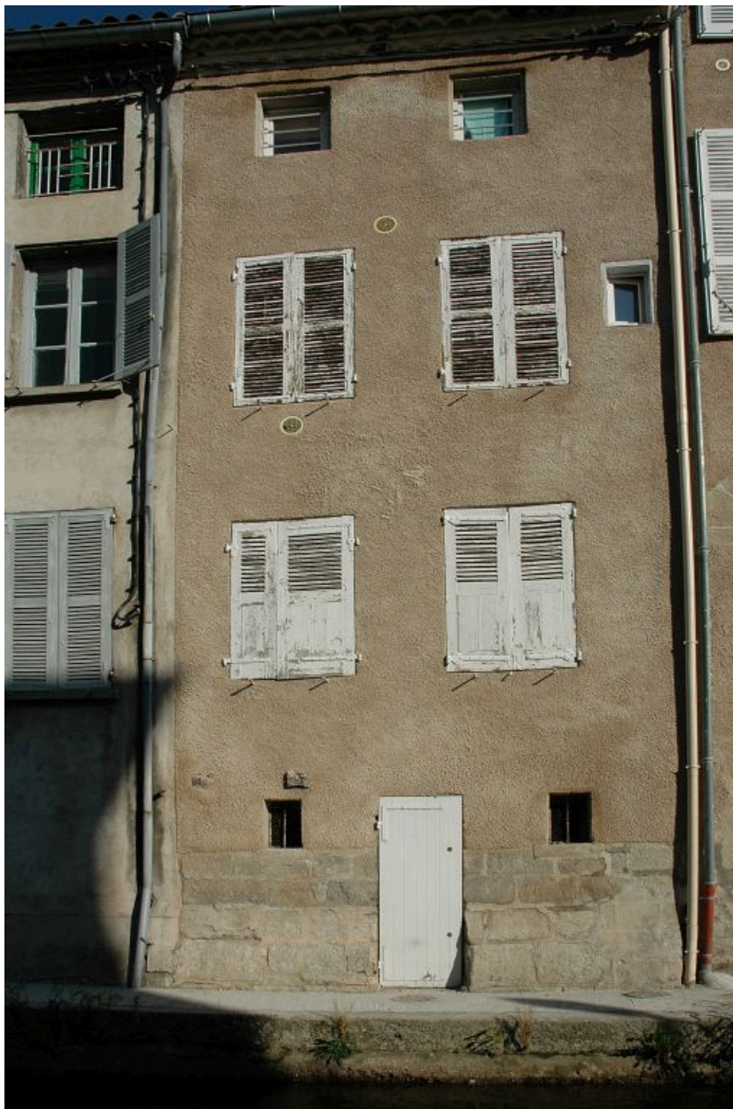
Elévation postérieure donnant sur les rives du Vizézy.