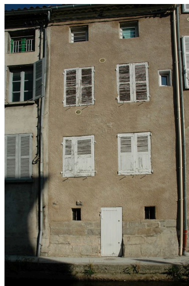
Elévation postérieure donnant sur les rives du Vizézy.