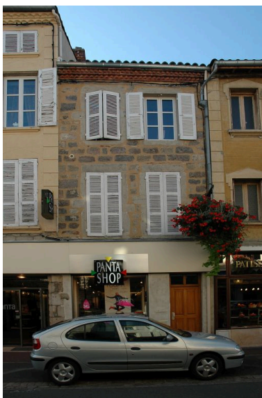
Vue générale sur la rue Tupinerie.