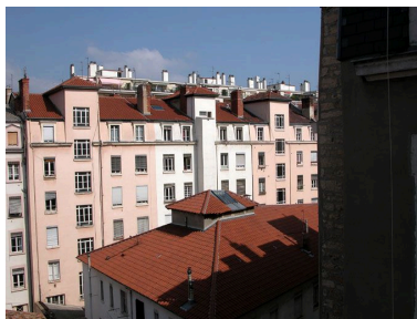
Vue générale depuis un immeuble de l'avenue Jean-Jaurès au sud-est