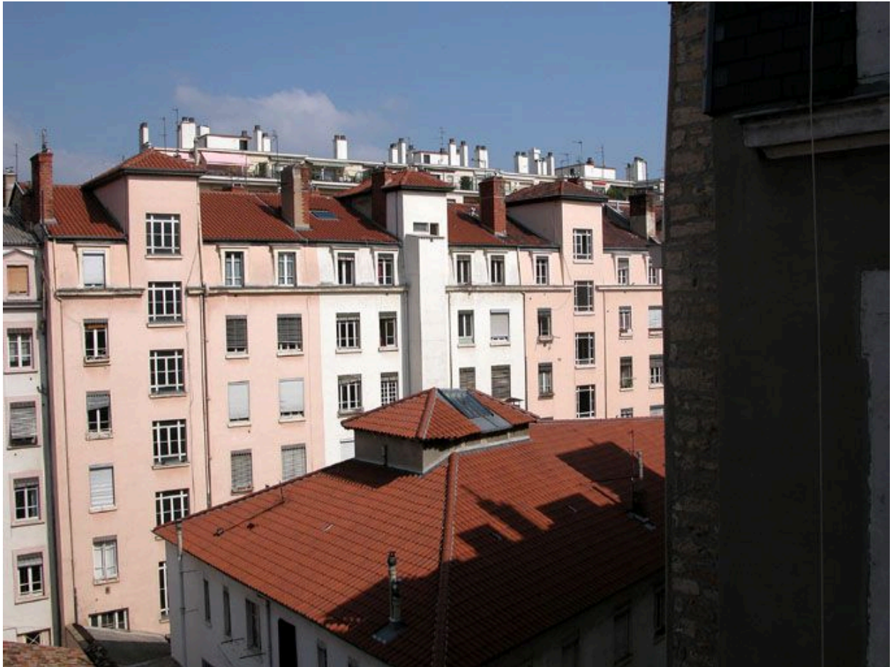
Vue générale depuis un immeuble de l'avenue Jean-Jaurès au sud-est