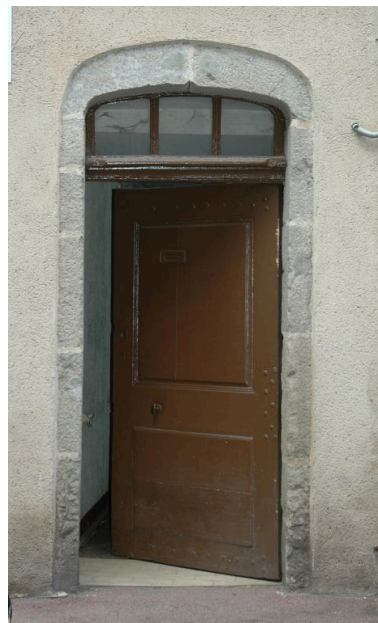
Porte piétonne avec arc en anse de panier.