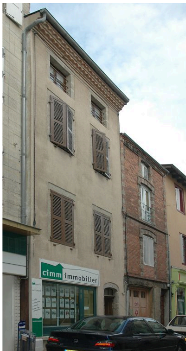
Vue générale. IVR82_20134200565NUCA