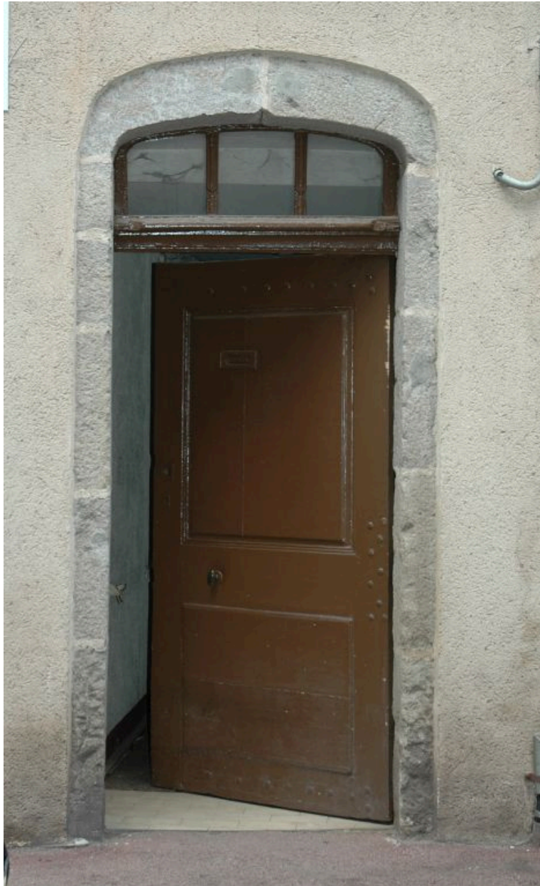
Porte piétonne avec arc en anse de panier.