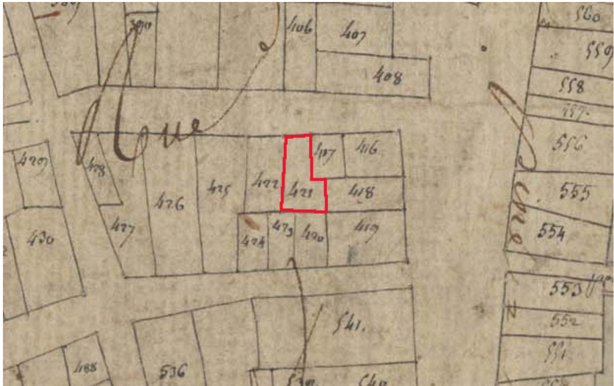
Extrait du plan cadastral de 1809, parcelle E 421.