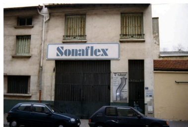
Ancienne maison-atelier, façade sur la rue Pierre-Robin