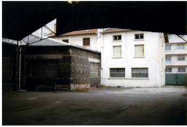
Ancienne maison-atelier : vue depuis l'intérieur du hangar IVR84_20166901654NUCA