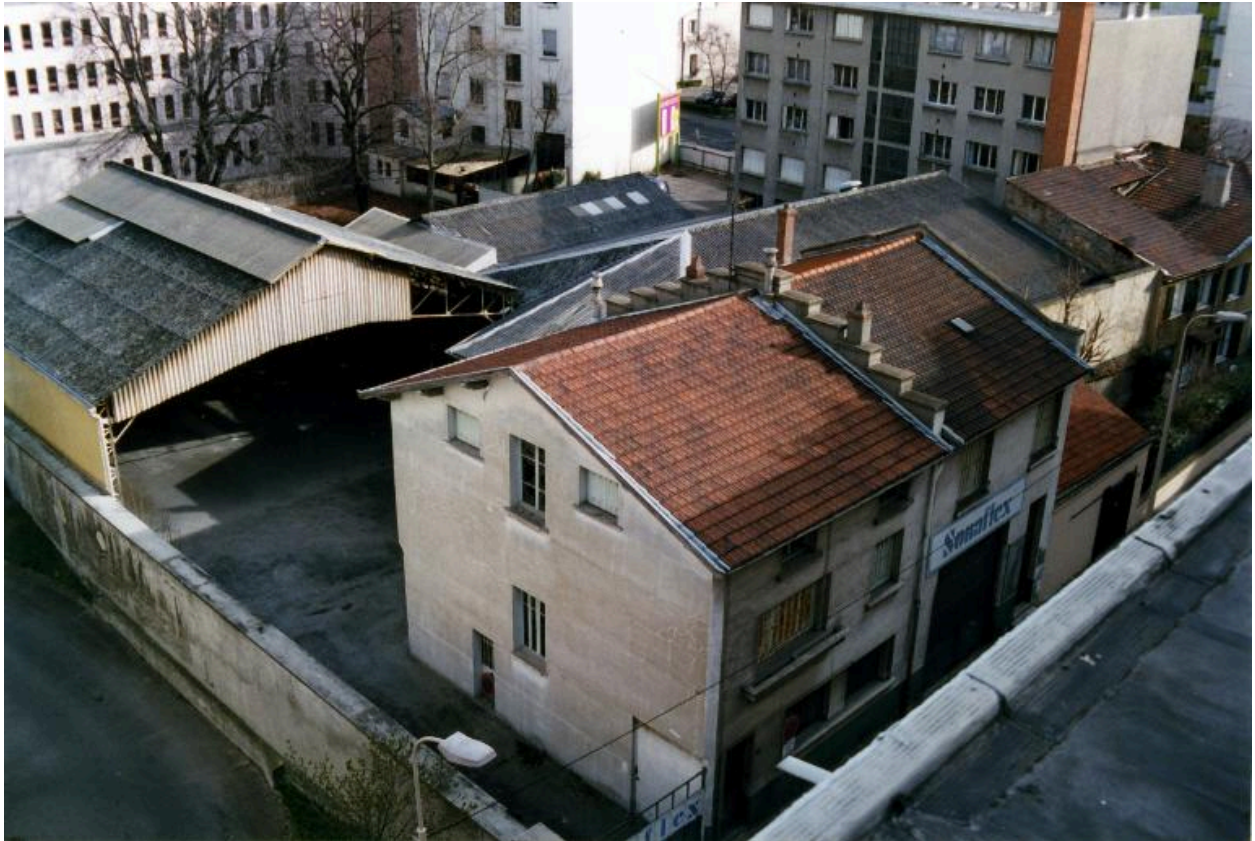
Ancienne maison-atelier : vue générale, depuis le haut