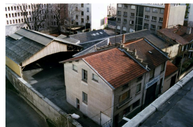
Ancienne maison-atelier : vue générale, depuis le haut IVR84_20166901653NUCA