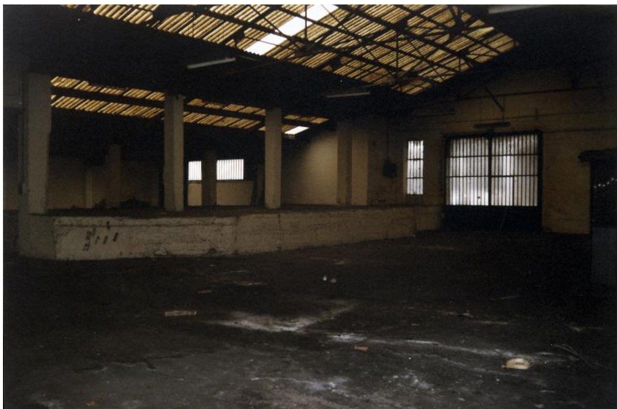
Ancienne maison-atelier : intérieur du hangar