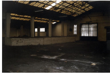
Ancienne maison- atelier : intérieur du hangar IVR84_20166901655NUCA