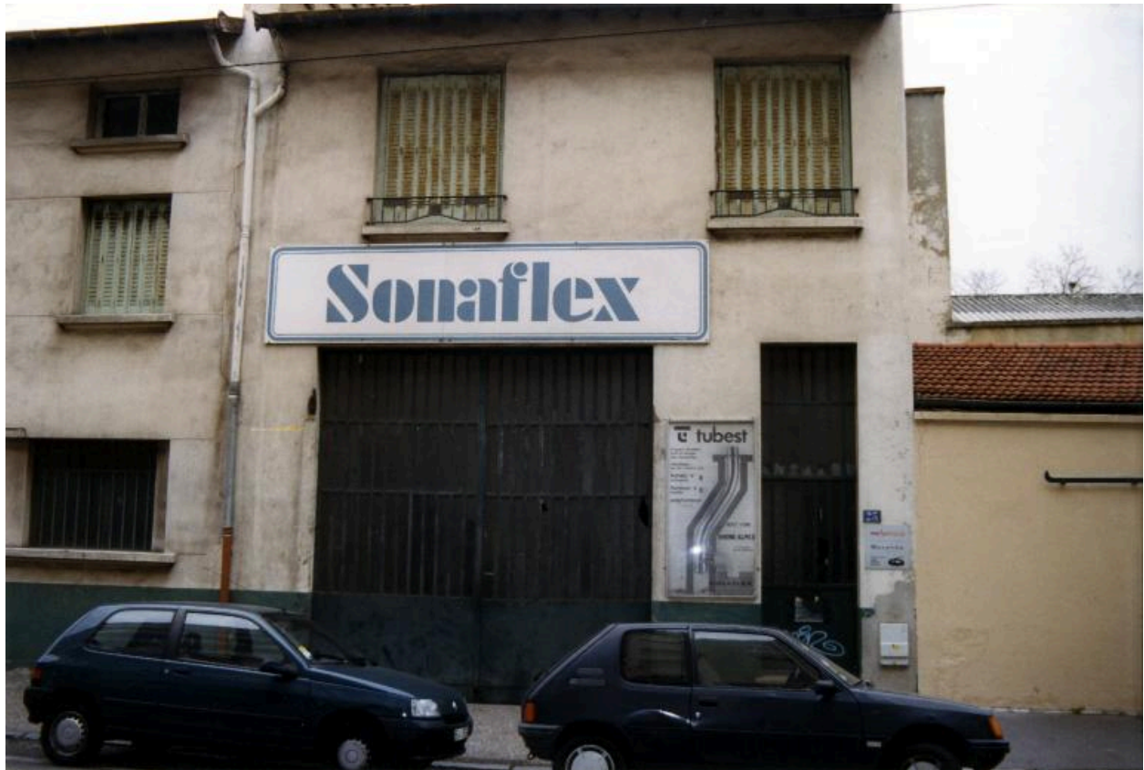
Ancienne maison-atelier, façade sur la rue Pierre-Robin