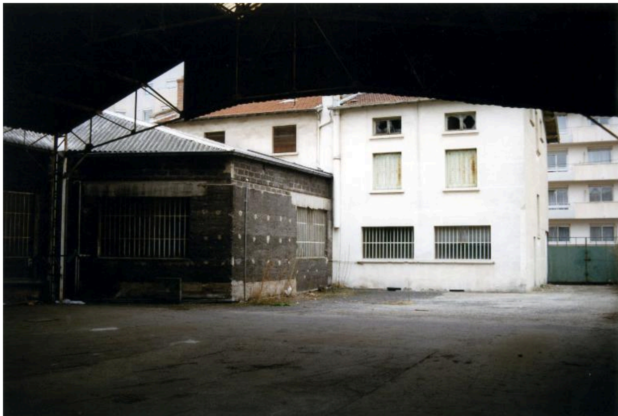
Ancienne maison-atelier : vue depuis l'intérieur du hangar