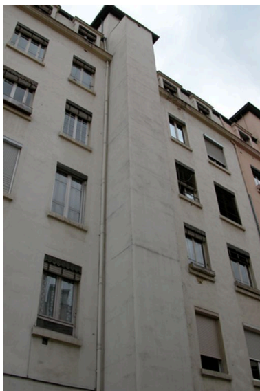
Colonne d'ascenseur rajouté sur l'élévation sur cour IVR82_20046904173NUCA