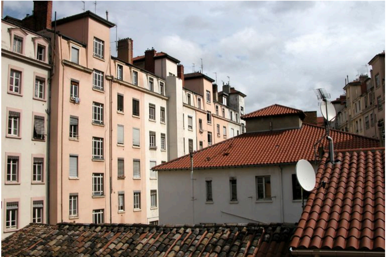
Elévation postérieure depuis un immeuble de l'avenue Jean-Jaurès