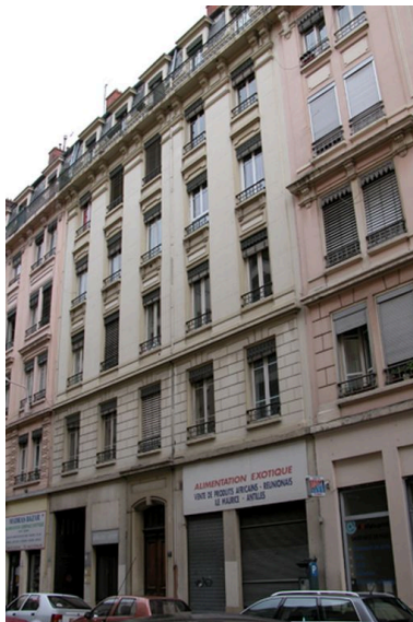
Vue générale de la façade sur rue IVR82_20046904172NUCA