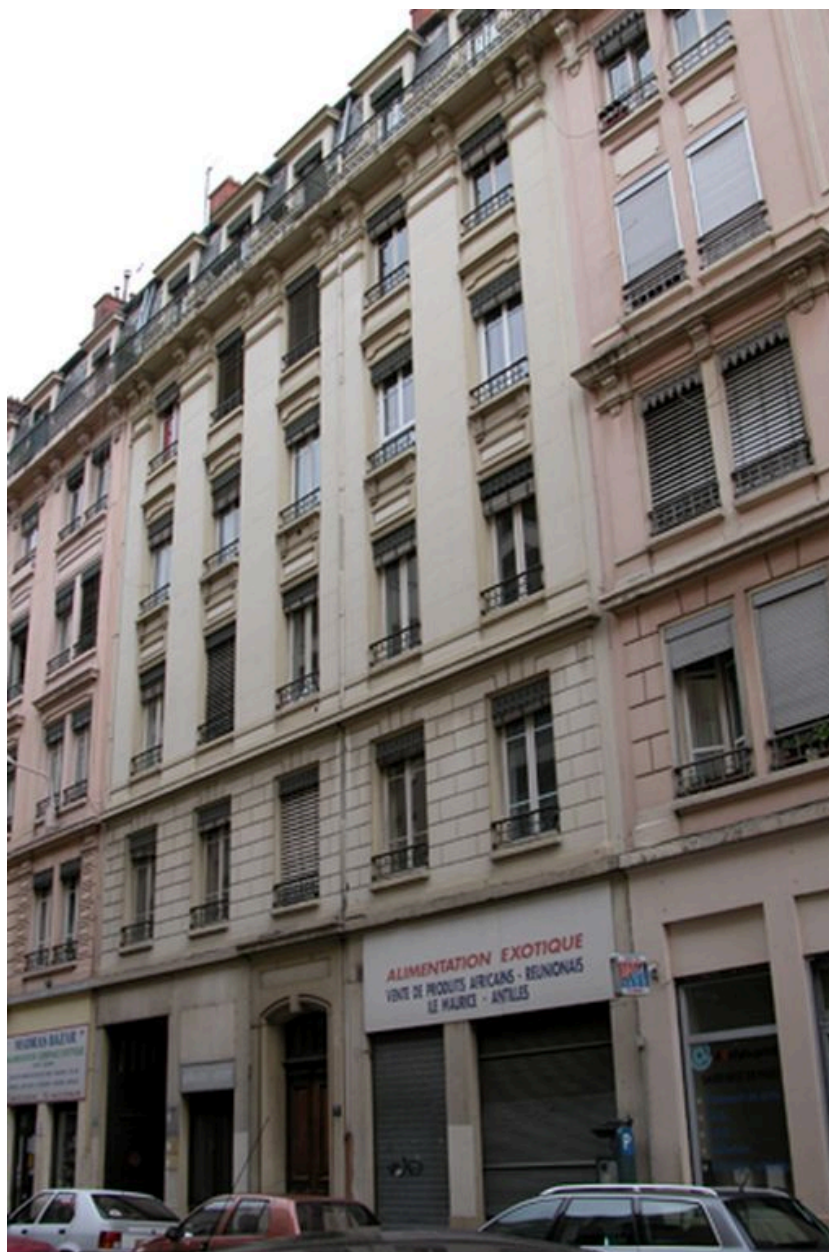
Vue générale de la façade sur rue