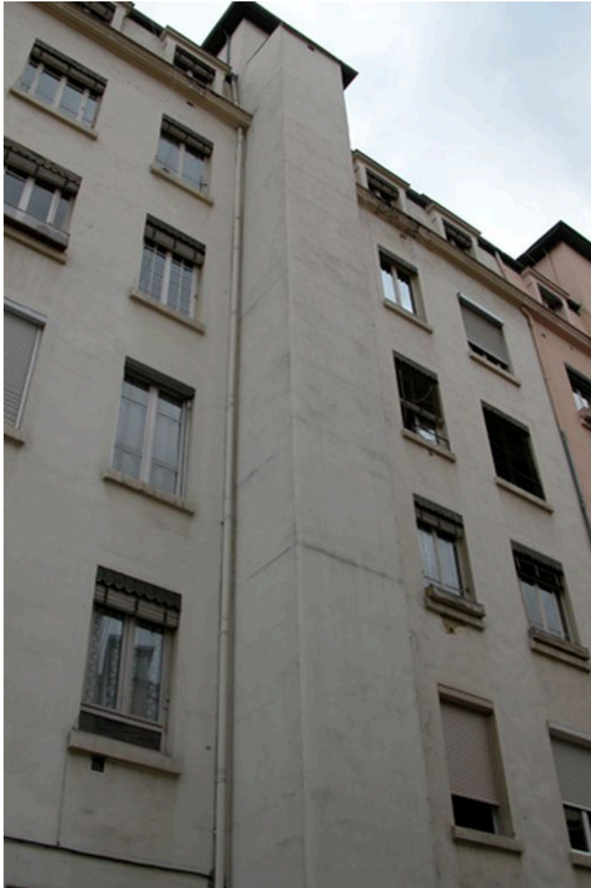
Colonne d'ascenseur rajouté sur l'élévation sur cour