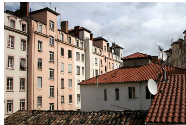
Elévation postérieure depuis un immeuble de l'avenue Jean-Jaurès IVR82_20046904609NUCA