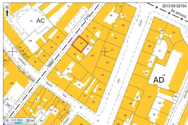
Plan masse et de situation, extrait de http://cadastre.gouv.fr IVR82_20136902194NUDA