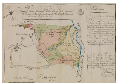
Plan extrait de la mappe de la commune de Trévignin dans lequel est représenté une partie des biens du Grand Séminaire... (1827).

IVR84_20177301717NUCA