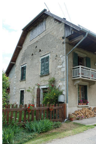
Vue du mur pignon ouest.