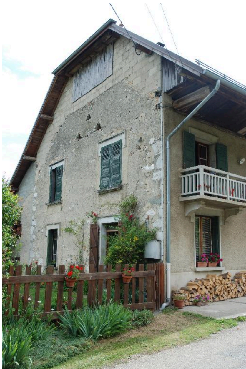
Vue du mur pignon ouest.