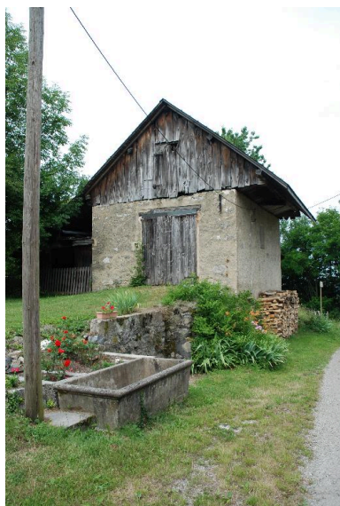
Vue de l'annexe (cellier, remise) et du bassin. IVR84_20167304601NUCA