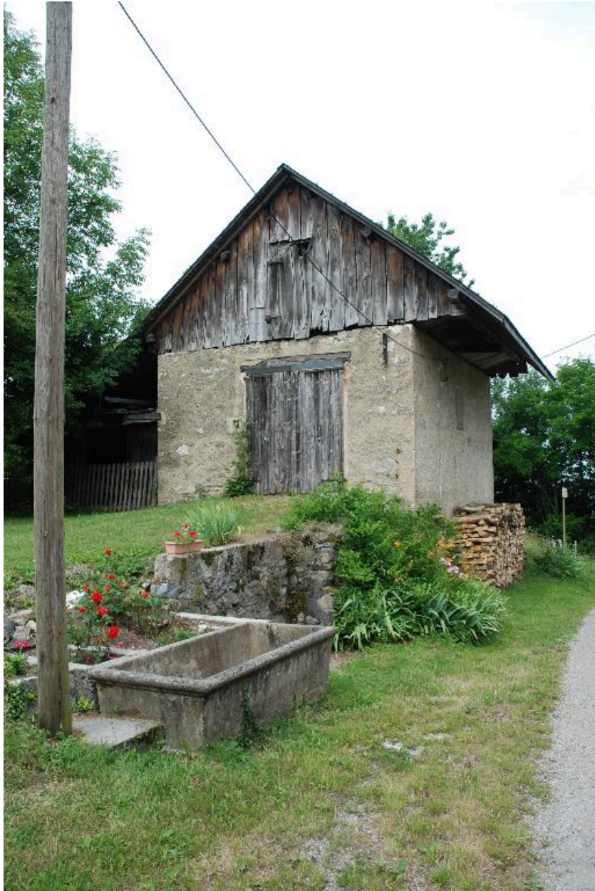
Vue de l'annexe (cellier, remise) et du bassin.