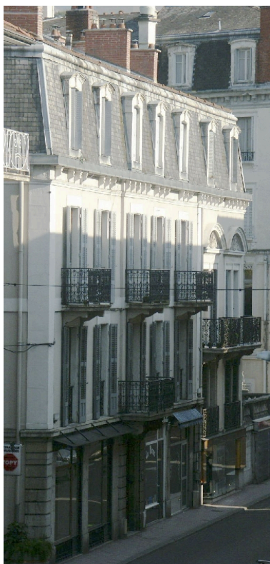
Élévation sur rue IVR82_20037300041NUCA