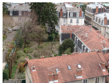
Jardin postérieur IVR82_20057300697NUCA