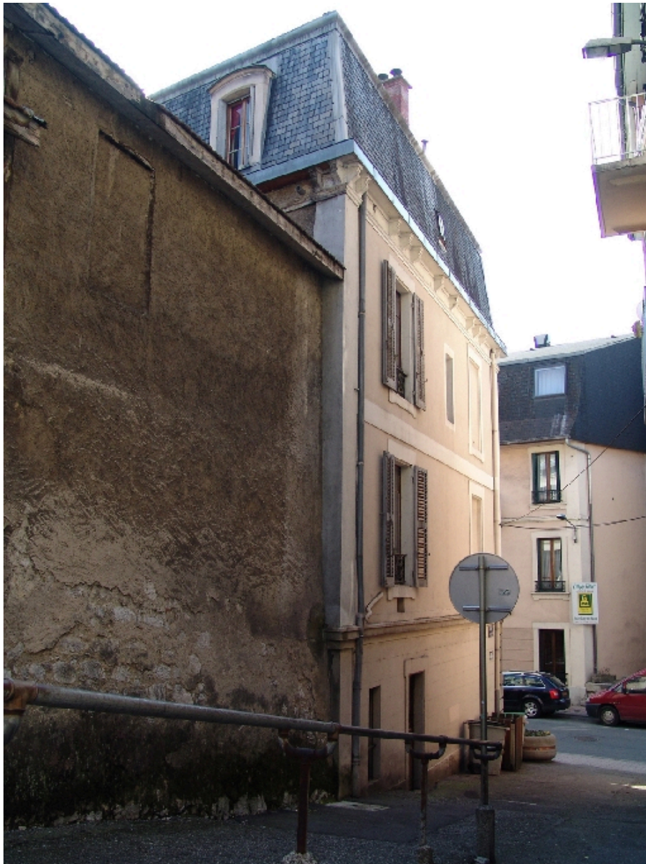
Elévation latérale gauche