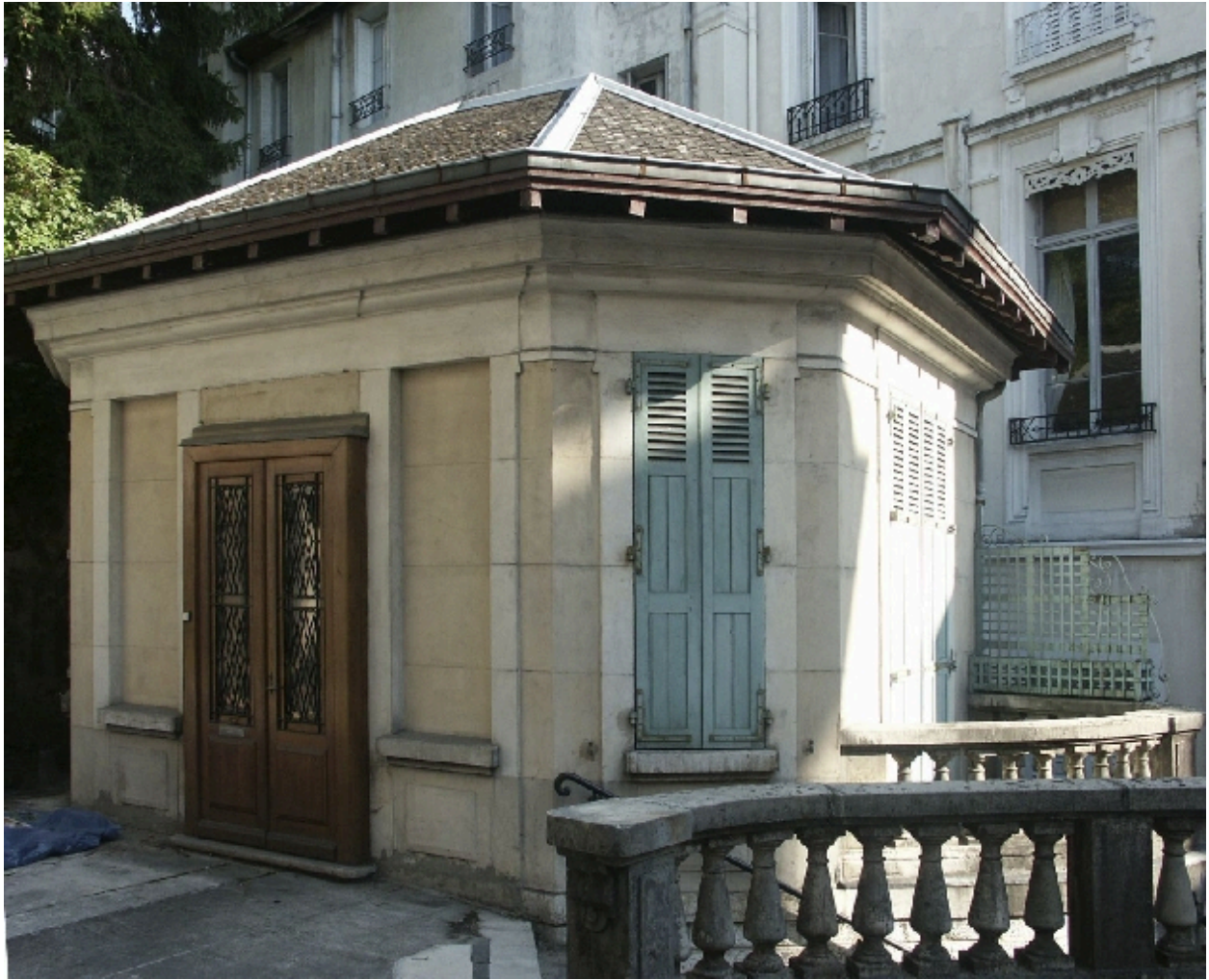
Pavillon construit sur la terrasse