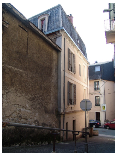
Élévation latérale gauche IVR82_20047300114NUCA