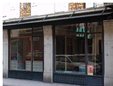
Détail des vitrines IVR82_20047300252NUCA