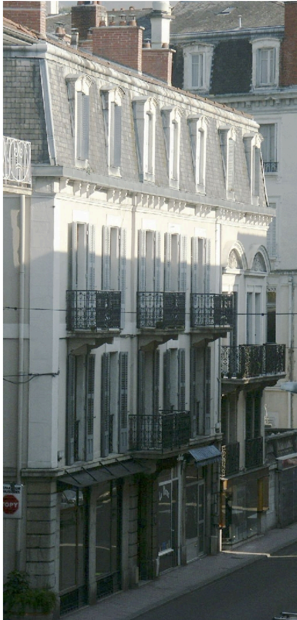
Elévation sur rue