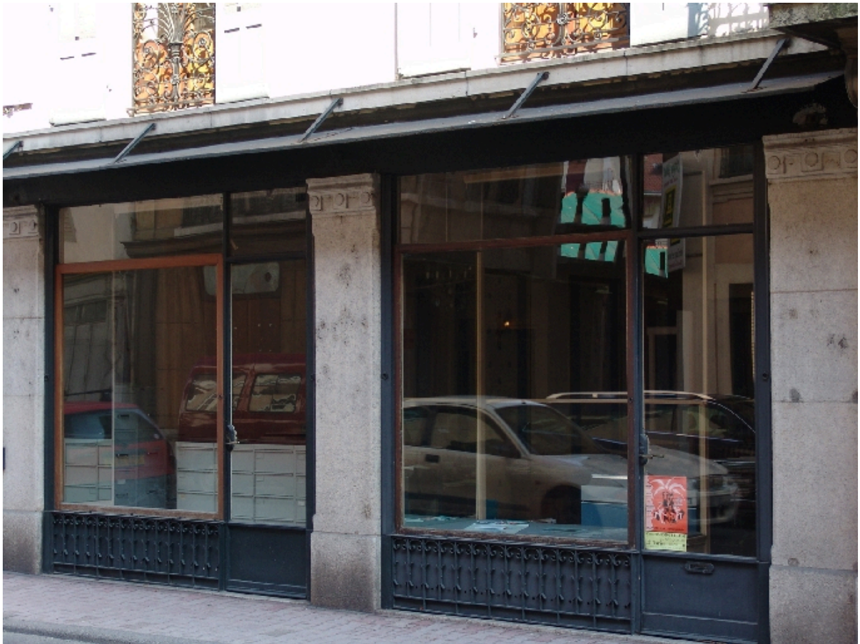
Détail des vitrines