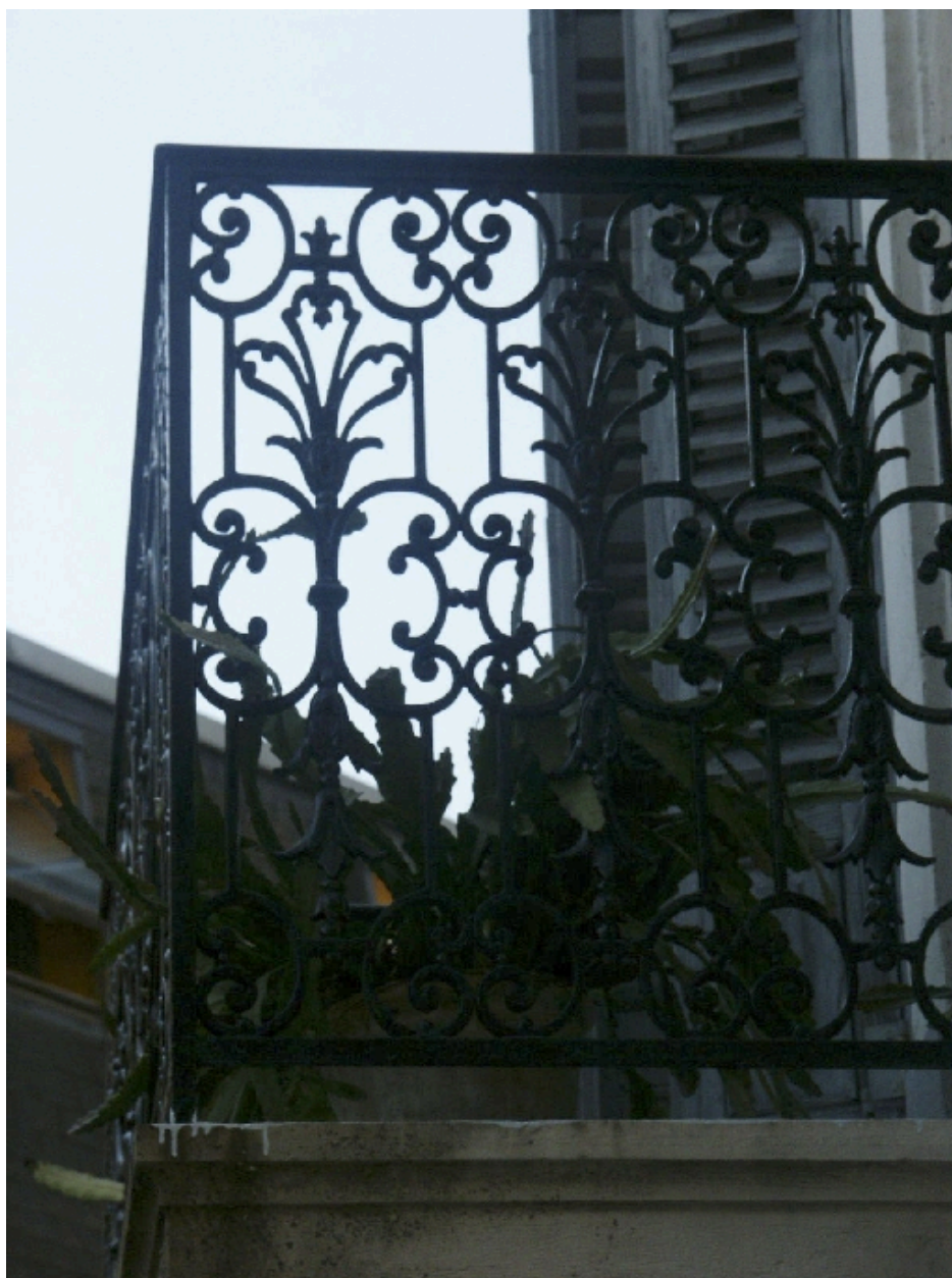
Vue d'un balcon