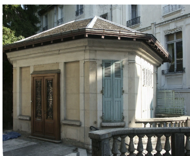
Pavillon construit sur la terrasse IVR82_20037300042NUCA