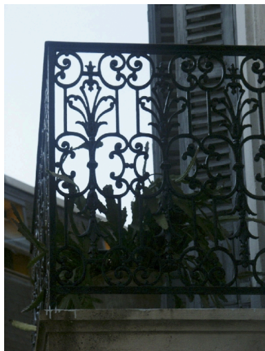
Vue d'un balcon IVR82_20037300043NUCA