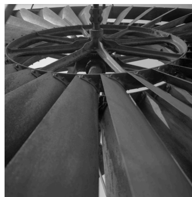
Détail de l'hélice à pales de l'éolienne.