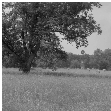
Vue de l'éolienne dans le parc, du sud-est. IVR82_20014201611X