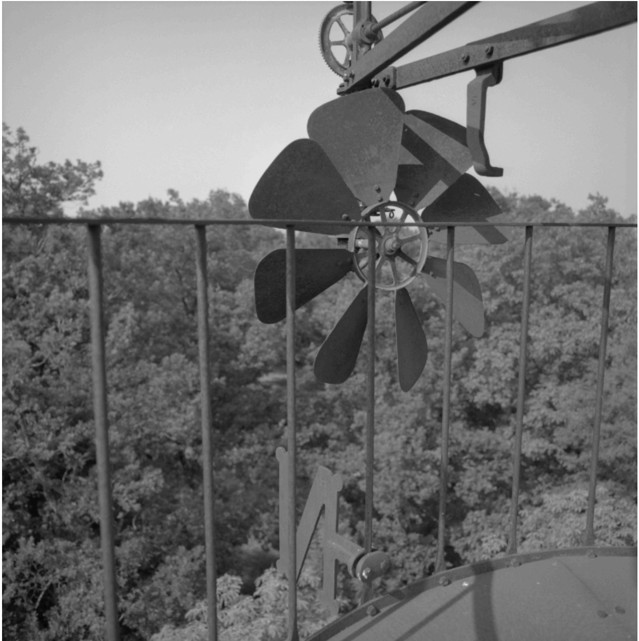
Détail du gouvernail de l'éolienne.