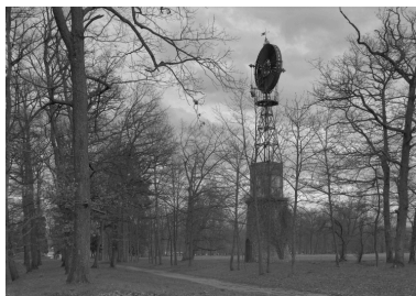
Vue de l'éolienne depuis l'allée ouvrant sur le portail du chemin départemental n°8, du nord-ouest.