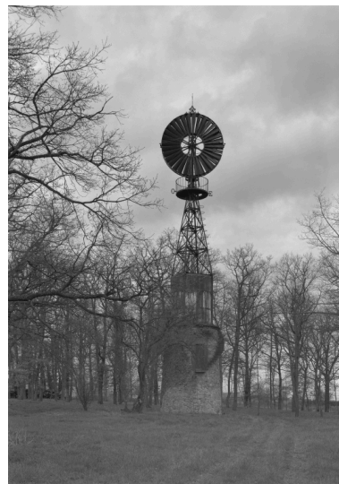
Vue générale de l'éolienne, du sud. IVR82_20014201613P