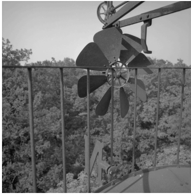
Détail du gouvernail de l'éolienne.