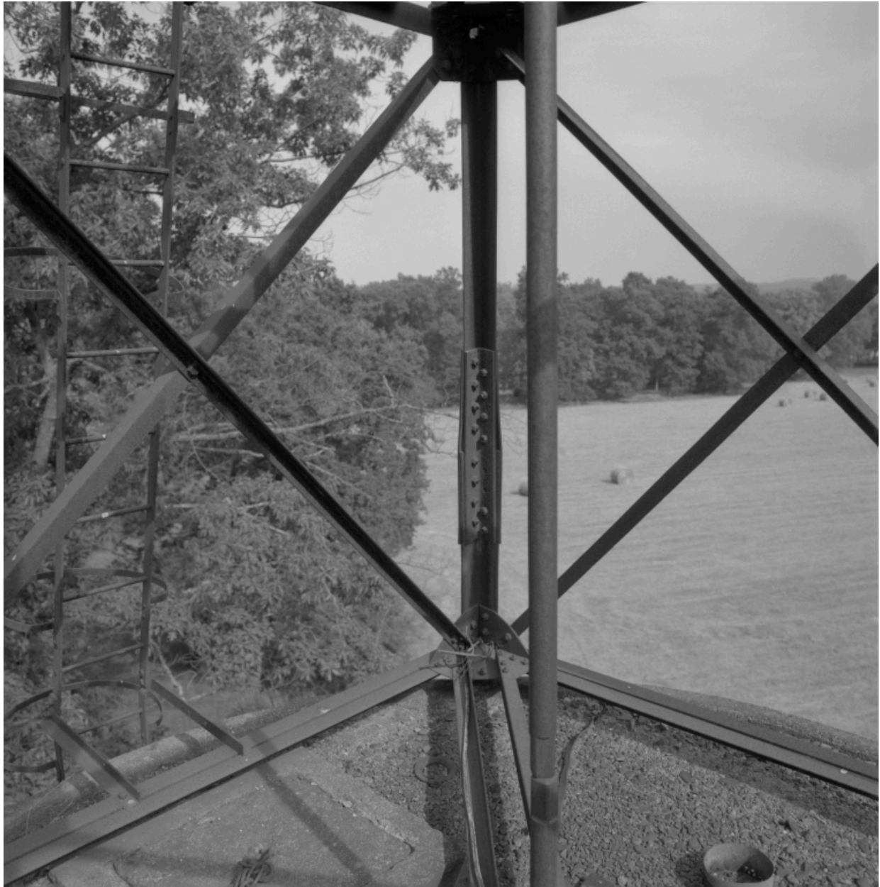
Vue générale du parc depuis le haut de l'éolienne.