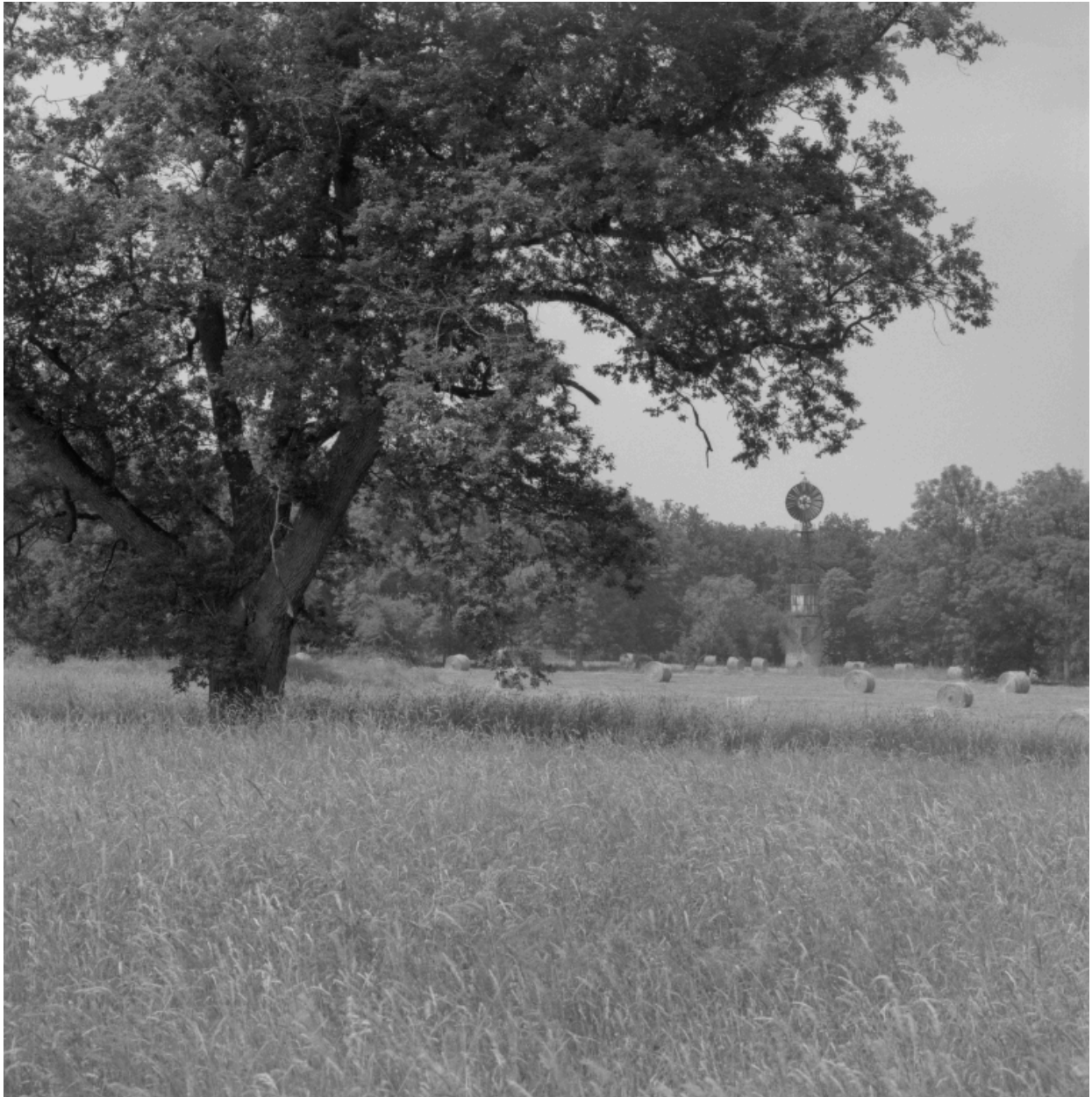
Vue de l'éolienne dans le parc, du sud-est.