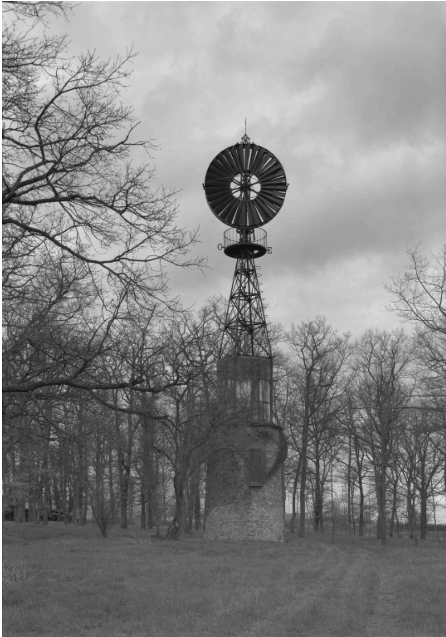
Vue générale de l'éolienne, du sud.