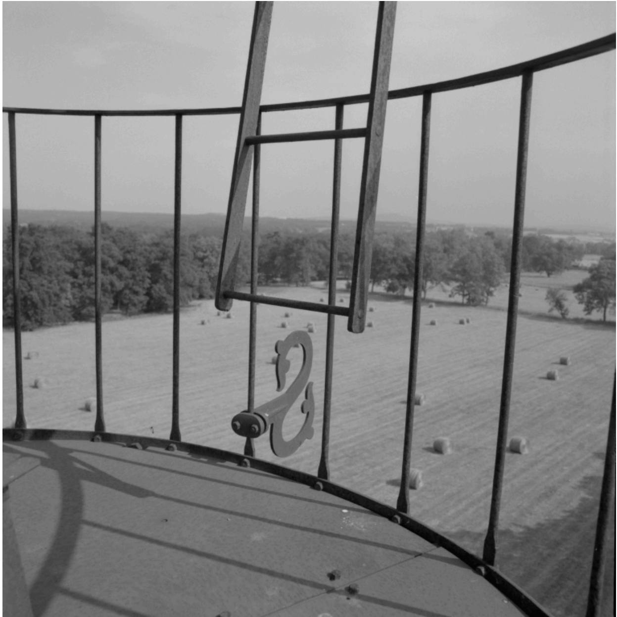
Vue du parc depuis la plate-forme de l'éolienne, du nord-ouest.