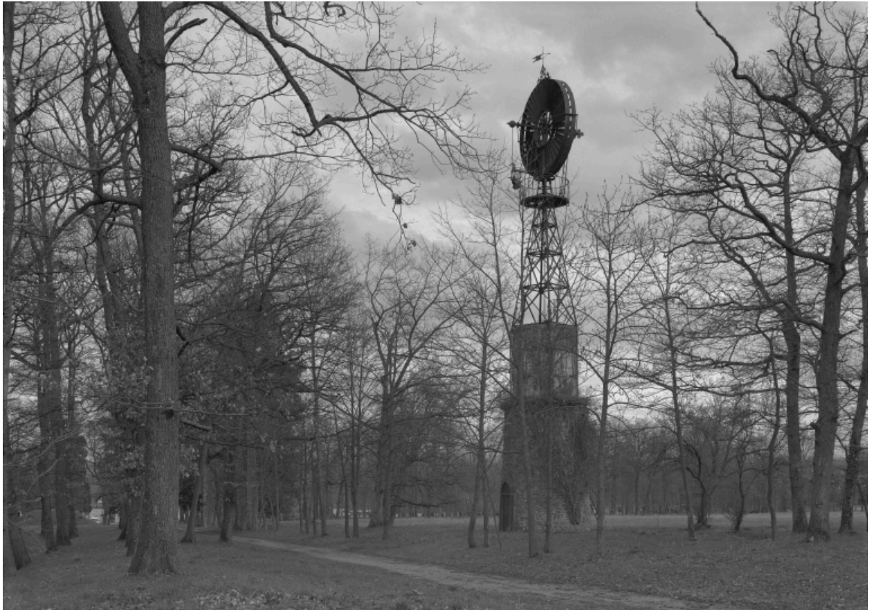
Vue de l'éolienne depuis l'allée ouvrant sur le portail du chemin départemental n°8, du nord-ouest.