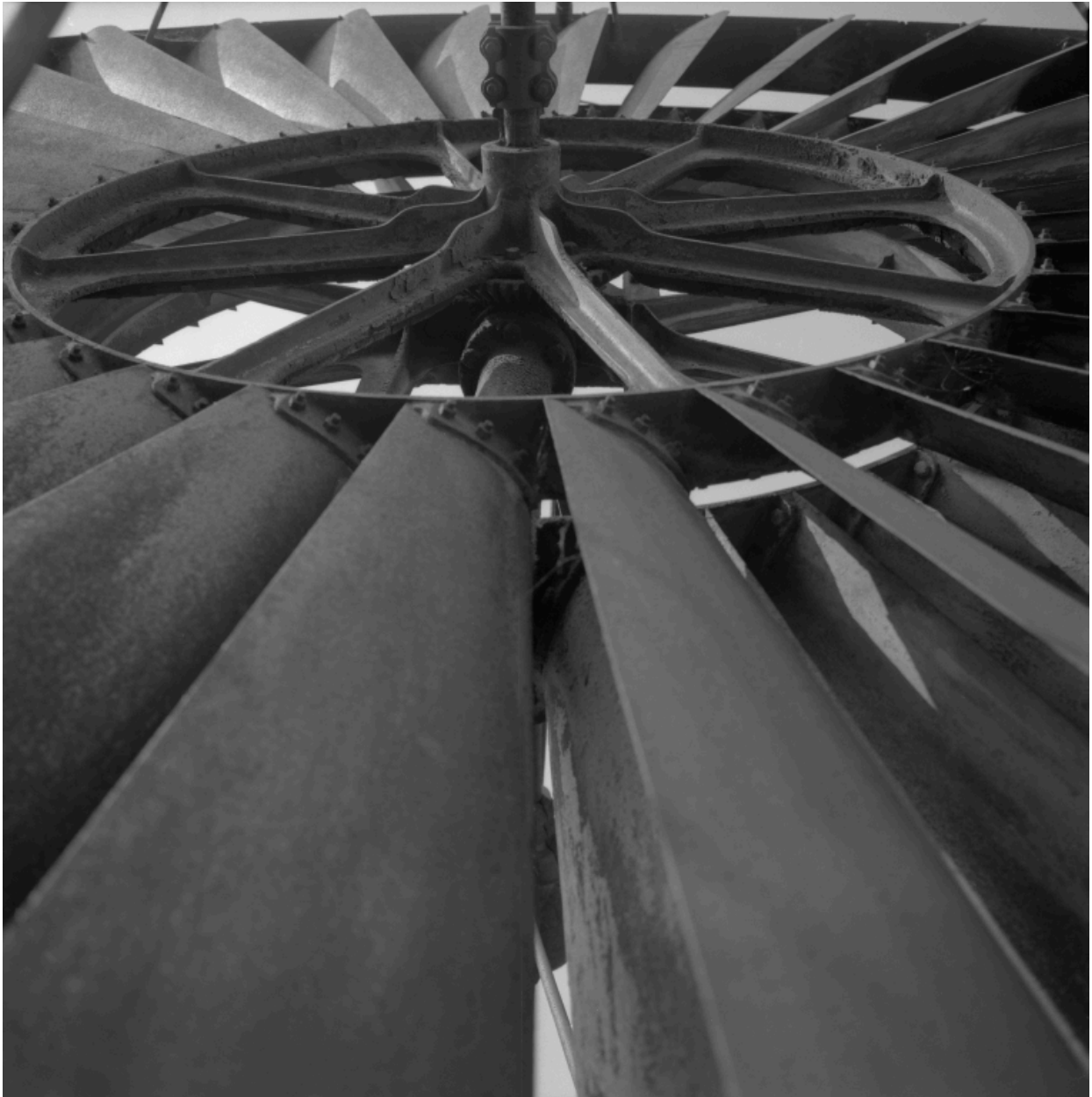
Détail de l'hélice à pales de l'éolienne.