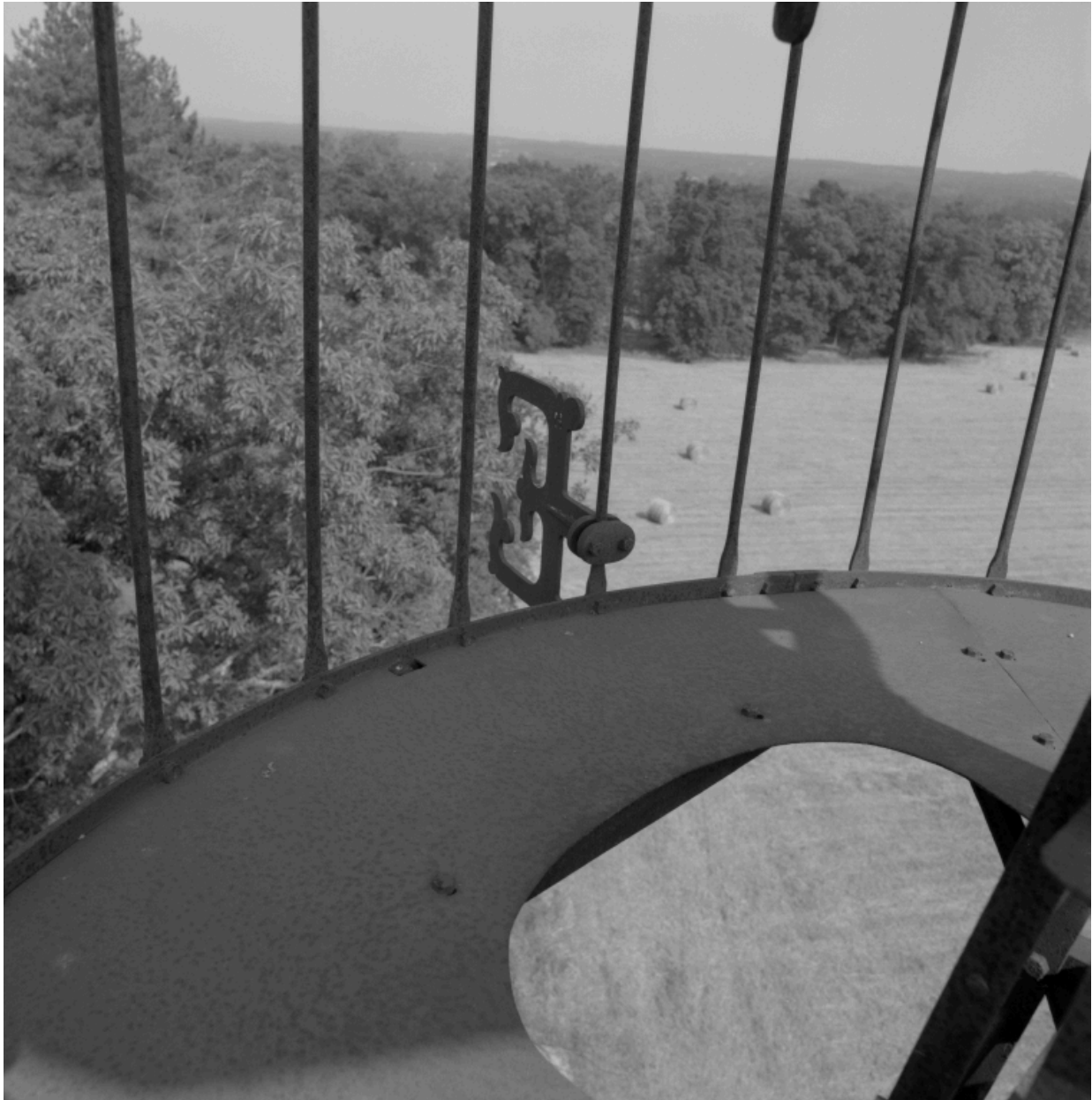
Vue du parc depuis la plate-forme de l'éolienne, du nord-ouest.