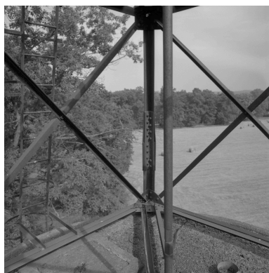
Vue générale du parc depuis le haut de l'éolienne.