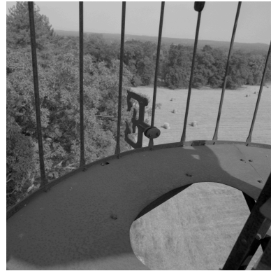
Vue du parc depuis la plate- forme de l'éolienne, du nord-ouest. IVR82_20014201619X