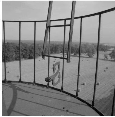
Vue du parc depuis la plate- forme de l'éolienne, du nord-ouest. IVR82_20014201618X