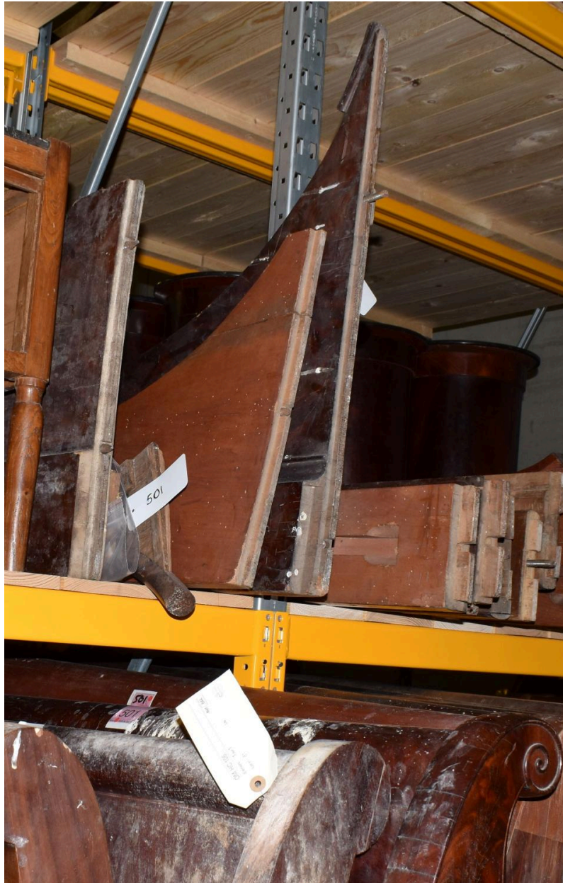
Vue générale - longs pans