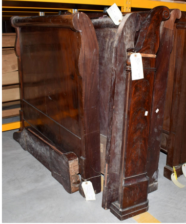
Vue générale - chevets (les deux à gauche) IVR84_20226301224NUC4A