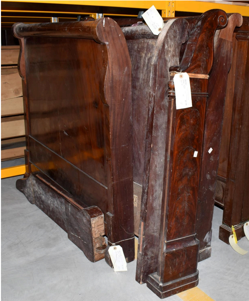
Vue générale - chevets (les deux à gauche)