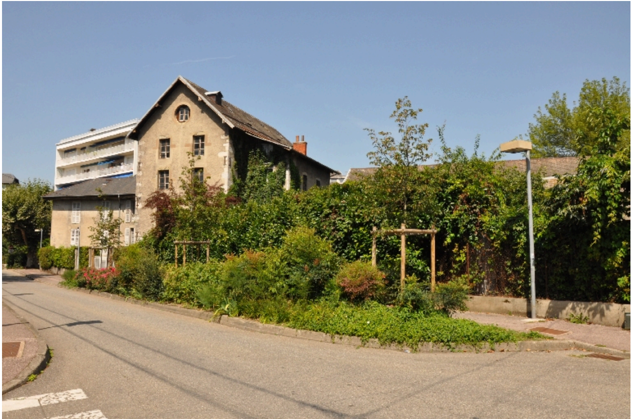
Vue de l'ancien moulin Tissot