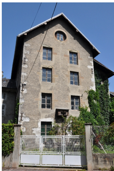
Vue de la façade de l'ancien moulin Tissot