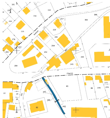
Cadastre actuel, 2012 IVR82_20127301868NUCA