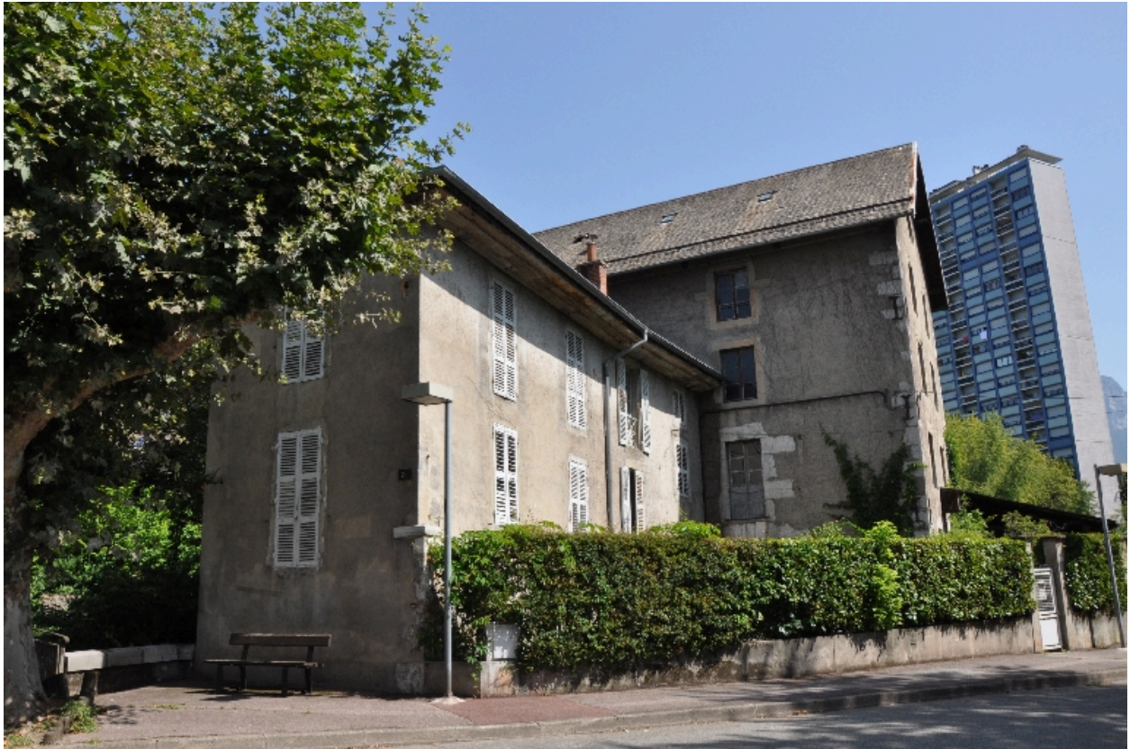
Vue de l'ancien moulin Tissot