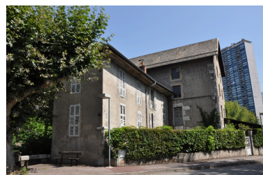
Vue de l'ancien moulin Tissot