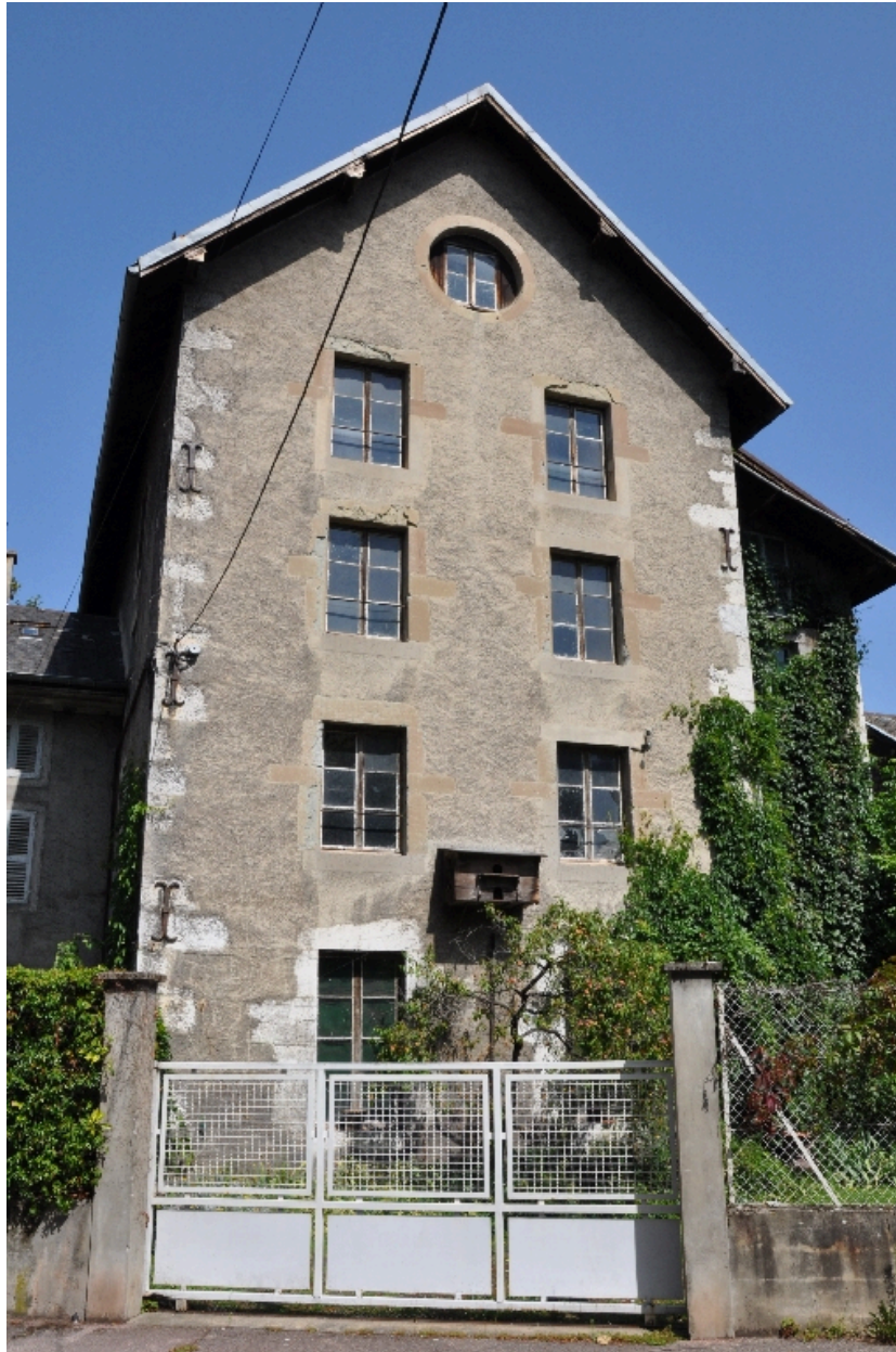
Vue de la façade de l'ancien moulin Tissot