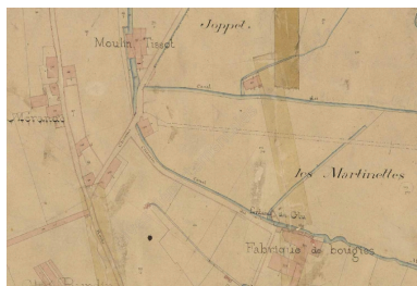
Premier cadastre français, 1865 IVR82_20127301867NUCA