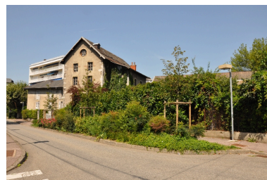
Vue de l'ancien moulin Tissot