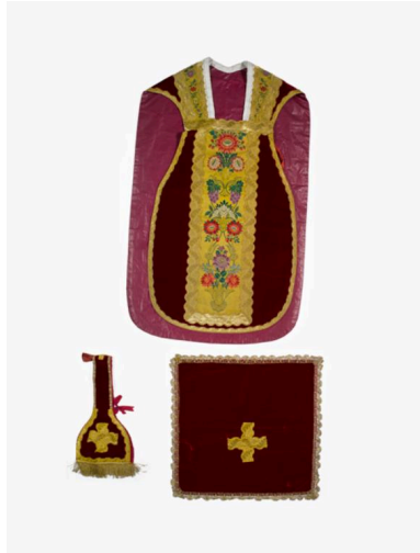
vue de la chasuble, du manipule, du voile de calice IVR84_20174300021NUC4A