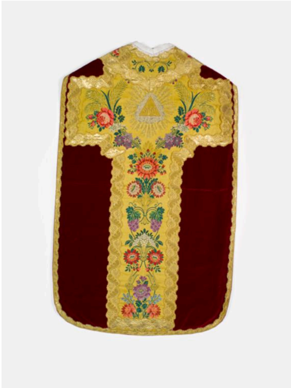
vue générale du dos