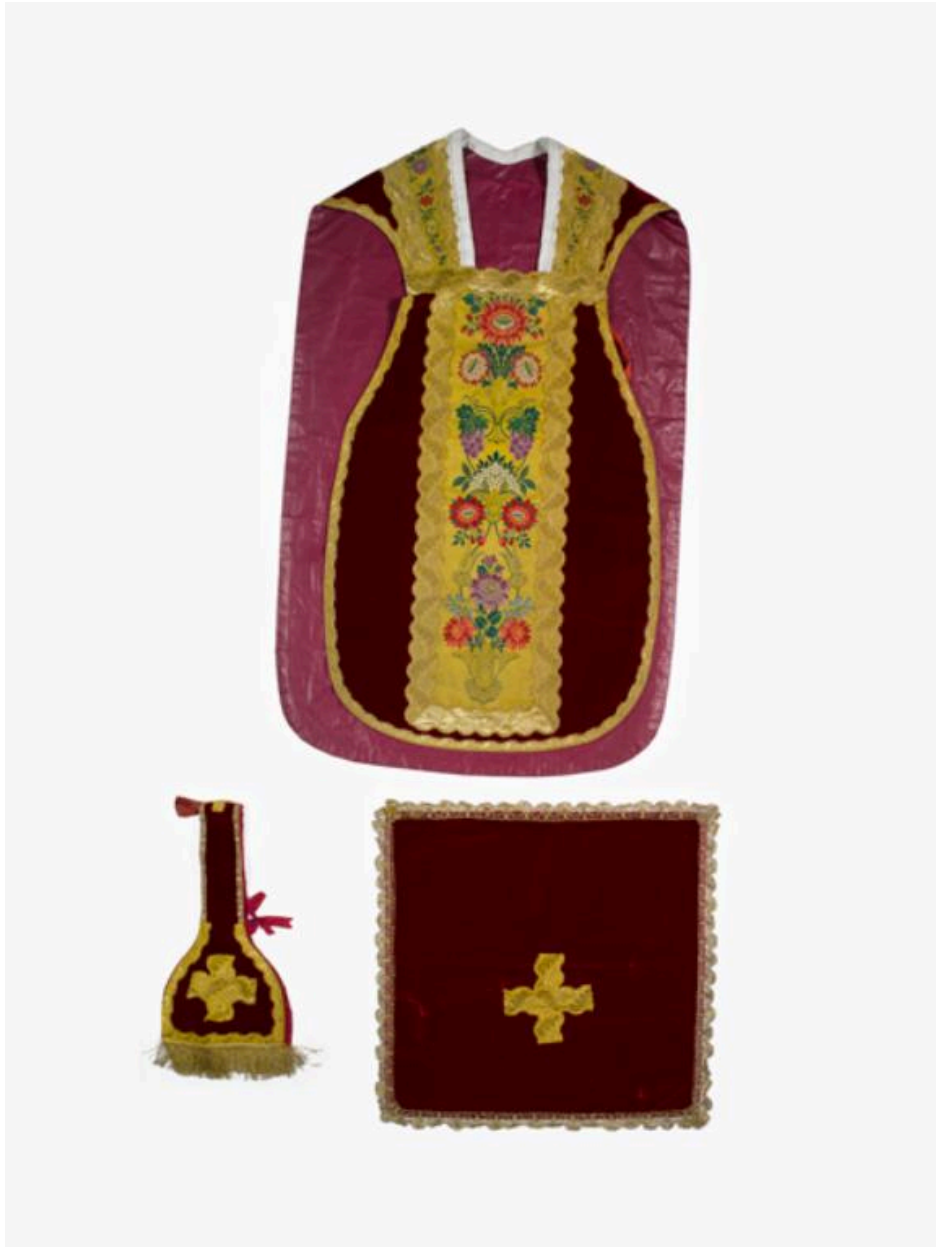
vue de la chasuble, du manipule, du voile de calice