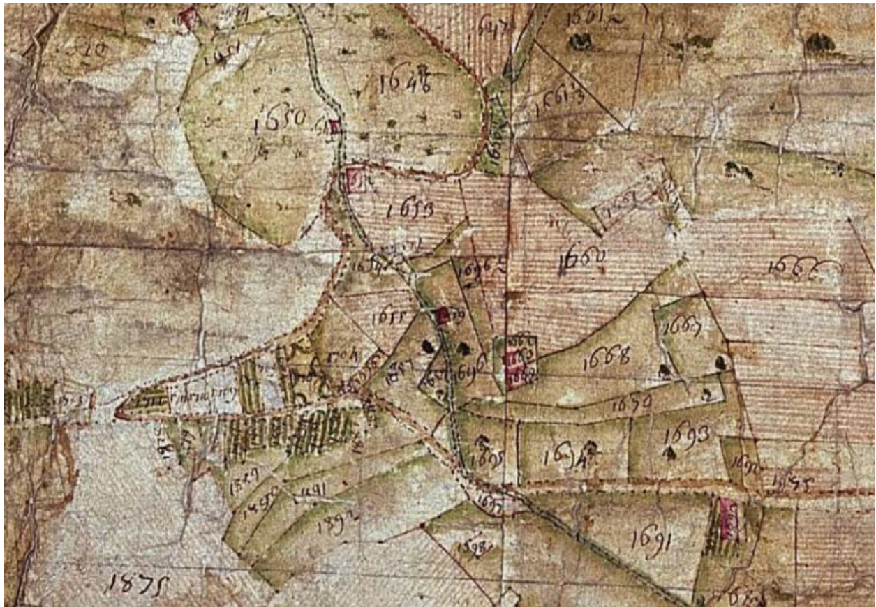
Cadastre de 1728, Châtelard (le), 1732 196, Vue 2 (FR.AD073, C2592).