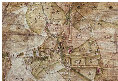
Cadastré de 1728, Châtelard (le), 1732 196, Vue 2 (FR.AD073, C2592). IVR84_20167302715NUCA