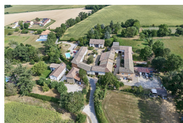
Hameau d'Ouroux, vue aérienne IVR84_20220100275NUCA