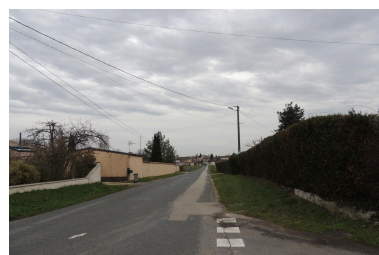
Route de Francheleins en direction du sud-ouest.