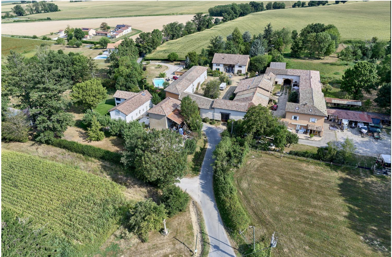
Hameau d'Ouroux, vue aérienne