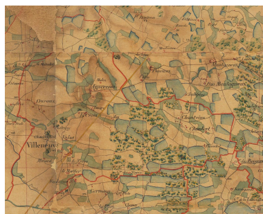
La commune de Villeneuve en 1841 (Carte du pays de Dombes, Gallica / BnF) IVR84_20230100064NUCA