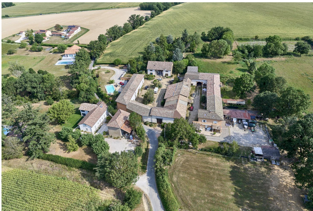
Hameau d'Ouroux, vue aérienne