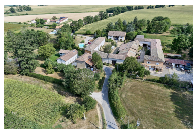
Hameau d'Ouroux, vue aérienne