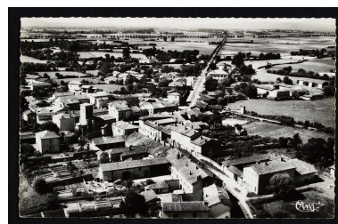
Vue aérienne depuis l'est. IVR84_20210100001NUCB