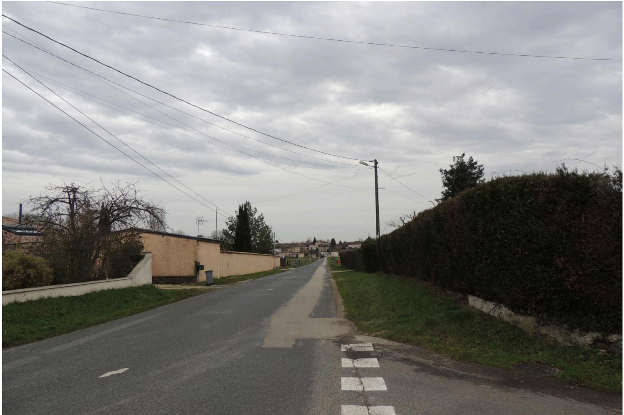
Route de Francheleins en direction du sud-ouest.