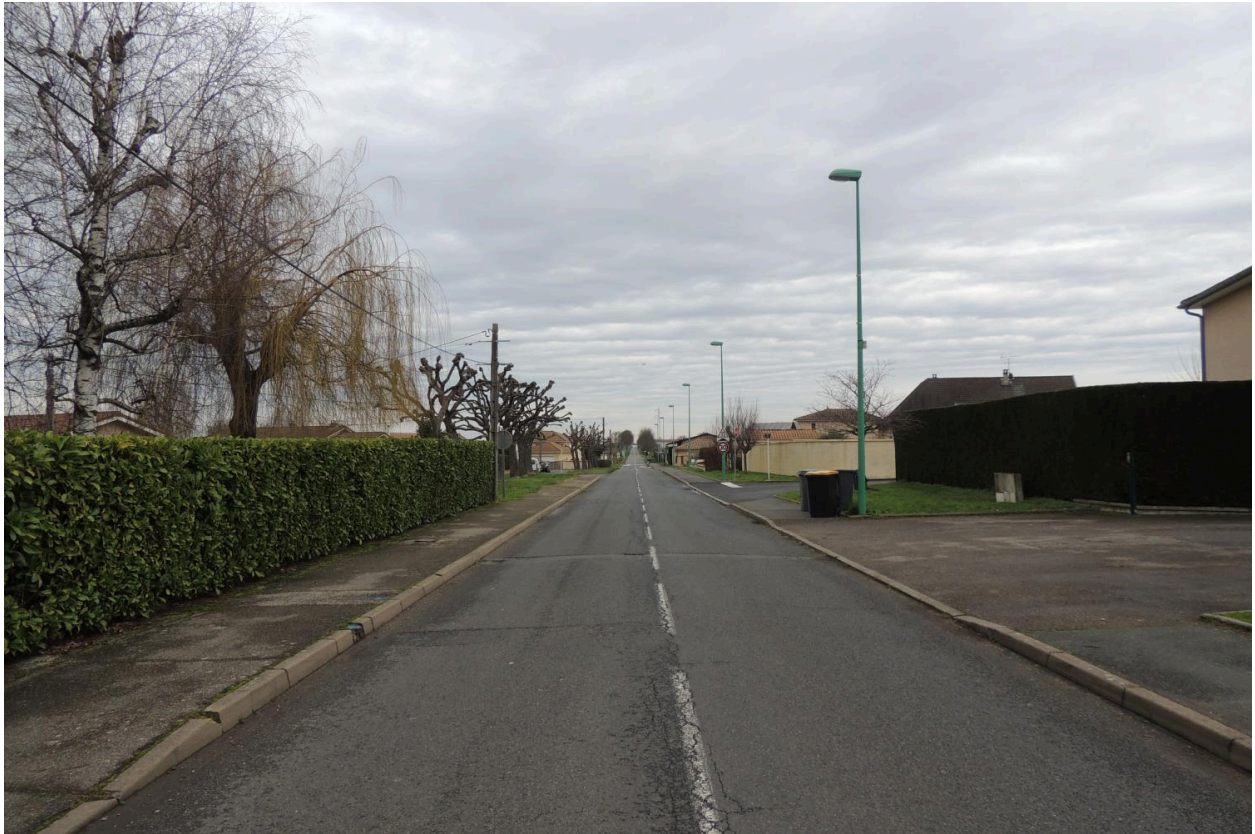
Route de Villars depuis le village.