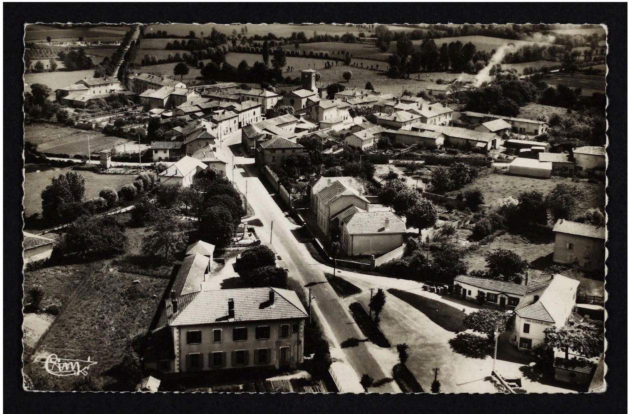
Vue aérienne depuis l'ouest (AD de l'Ain. 5 Fi 446-3).