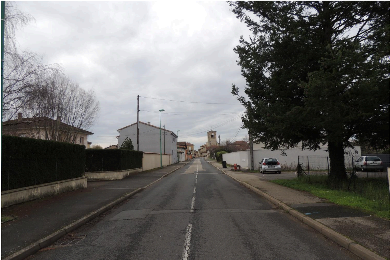
Route de Villars en direction du village.