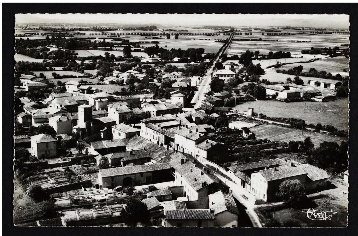
Vue aérienne depuis l'est (AD de l'Ain. 5 Fi 446-2).