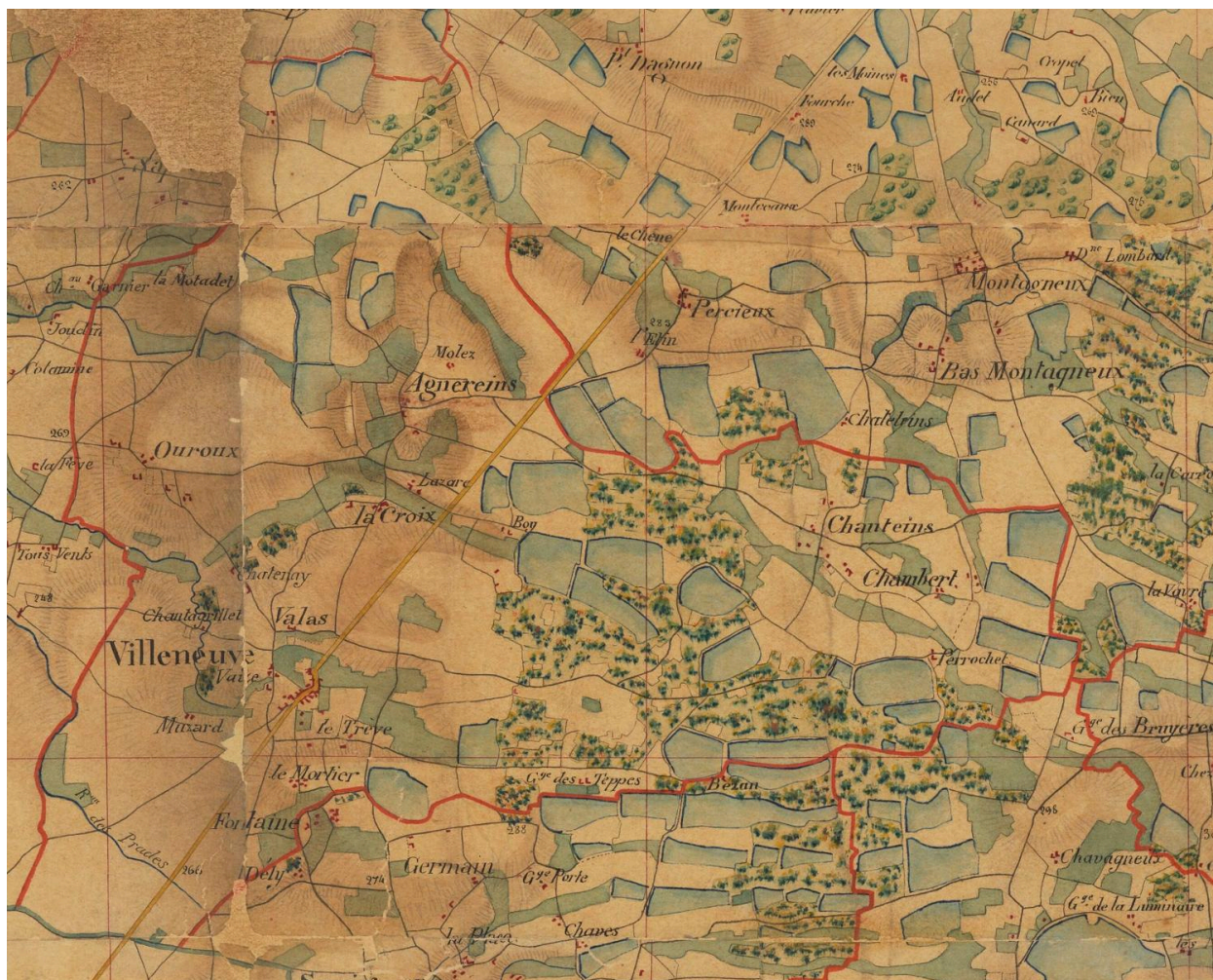
La commune de Villeneuve en 1841 (Carte du pays de Dombes)