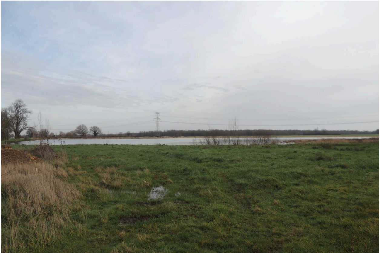
Vue de l'étang Chambert.