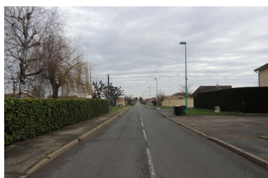
Route de Villars depuis le village. IVR84_20210100003NUCA