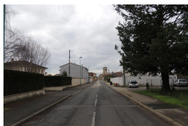
Route de Villars en direction du village.