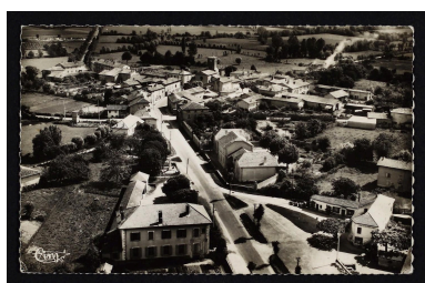
Vue aérienne depuis l'ouest. IVR84_20210100002NUCB