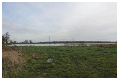
Vue de l'étang Chambert.