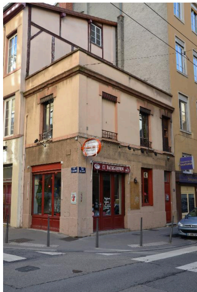
Vue d'ensemble IVR82_20156900517NUCA