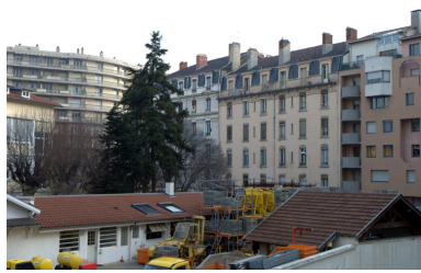
Vue d'ensemble depuis le sud-ouest IVR82_20126902448NUCA