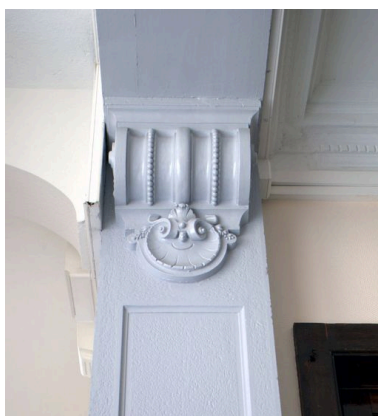
Passage cocher, détail d'une console IVR82_20106905100NUCA