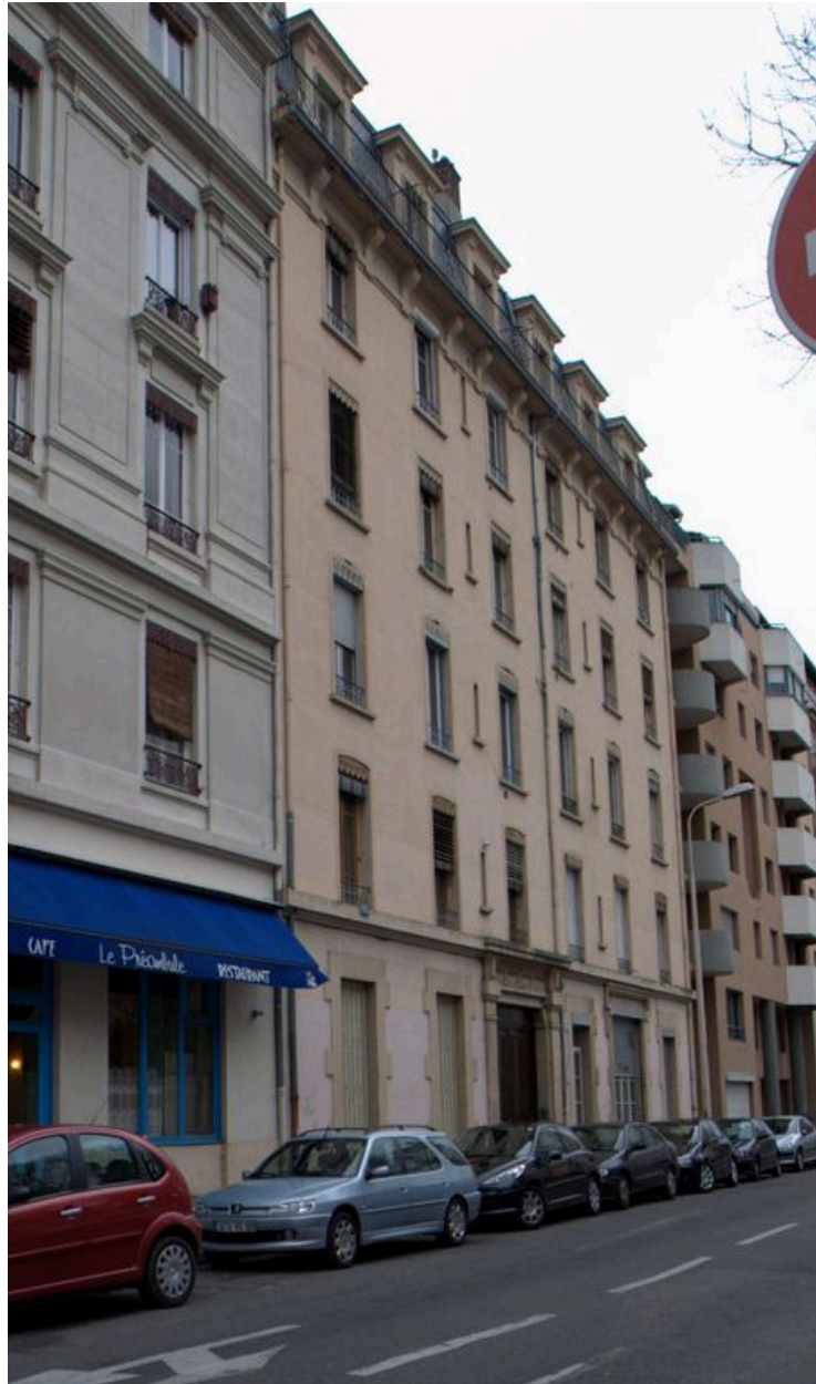
Elévation antérieure, depuis le nord