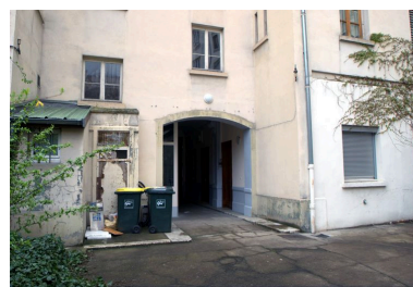
Vue du passage cocher depuis la cour IVR82_20106905098NUCA