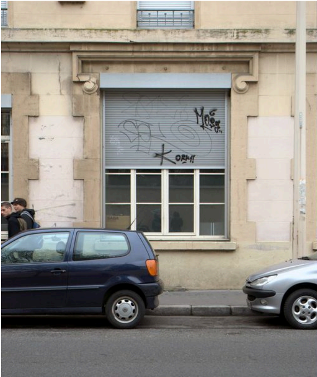
Détail d'une baie du rez-de-chaussée