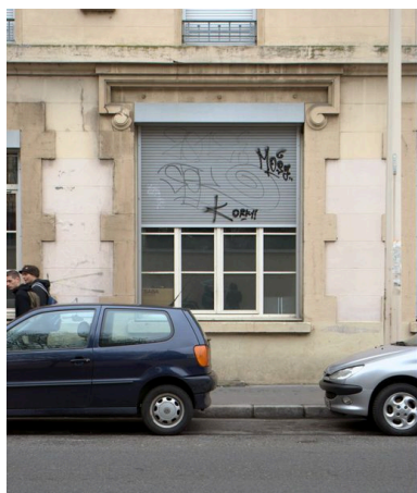
Détail d'une baie du rez-de-chaussée