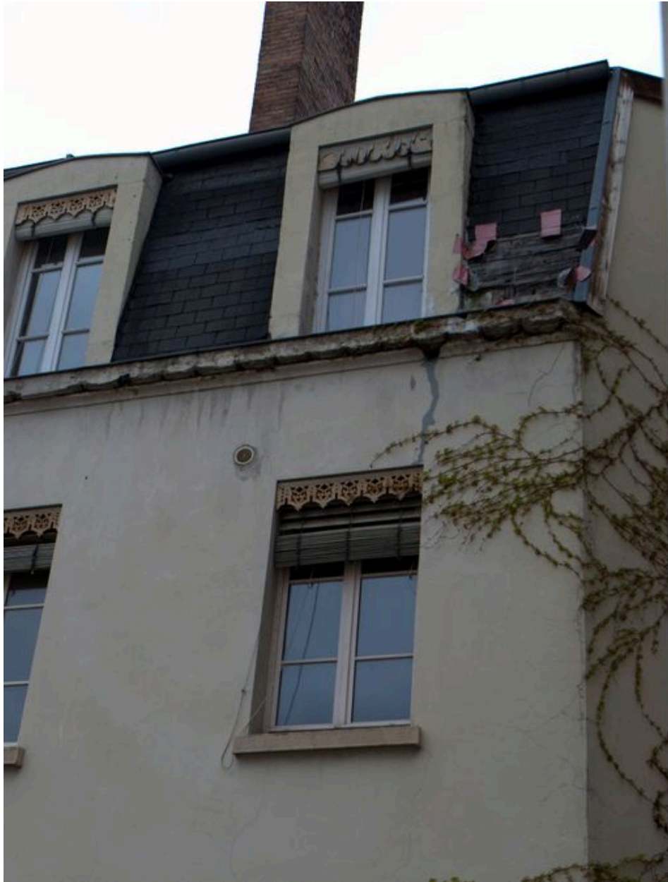
Elévation postérieure, détail de l'étage de comble