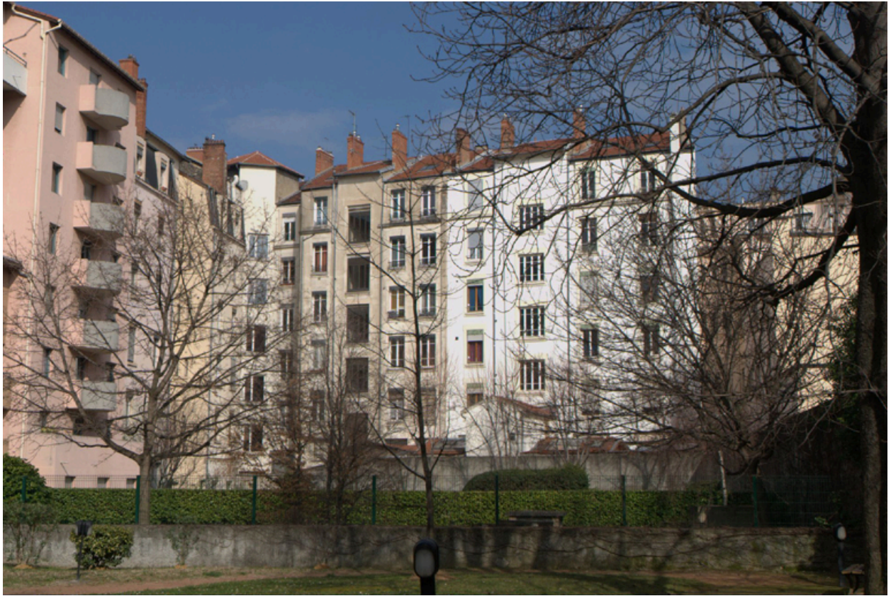
Elévations postérieures des immeubles 3 rue Nicolai et 144, 146 et 148 cours Gambetta