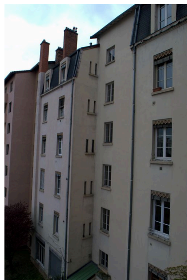
Elévation postérieure IVR82_20106905095NUCA