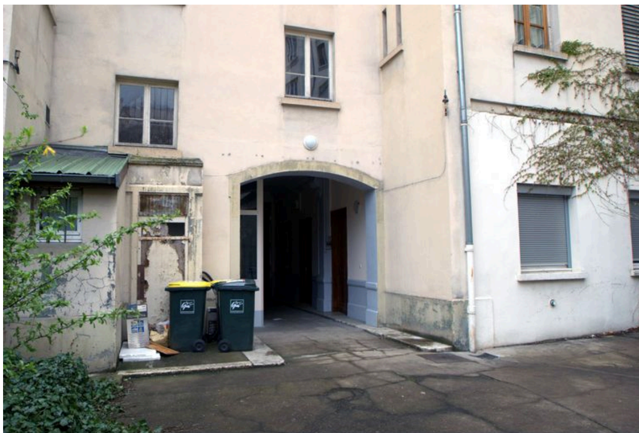
Vue du passage cocher depuis la cour