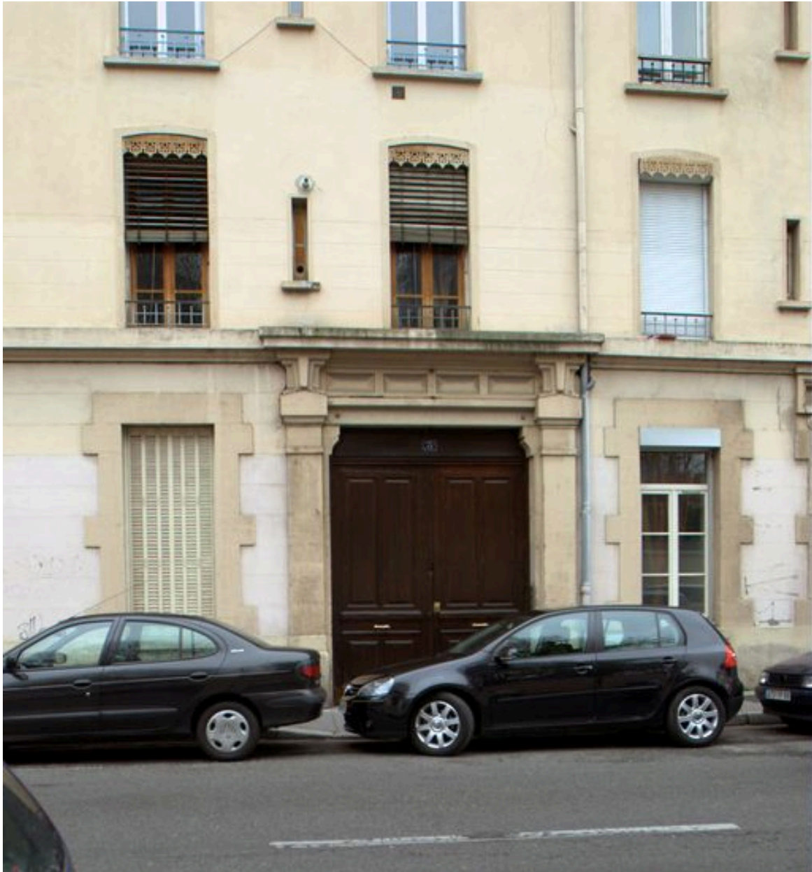
Détail de la porte sur rue