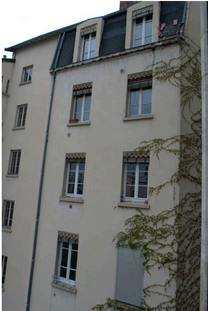
Elévation postérieure, détail