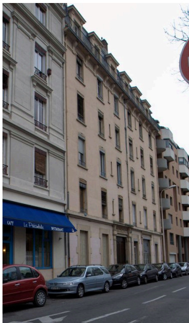
Elévation antérieure, depuis le nord IVR82_20106905092NUCA