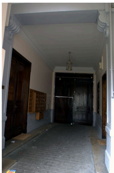
Vue intérieure du passage cocher IVR82_20106905099NUCA