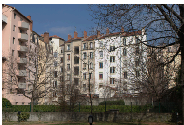
Elévations postérieures des immeubles 3 rue Nicolai et 144, 146 et 148 cours Gambetta IVR82_20126902447NUCA