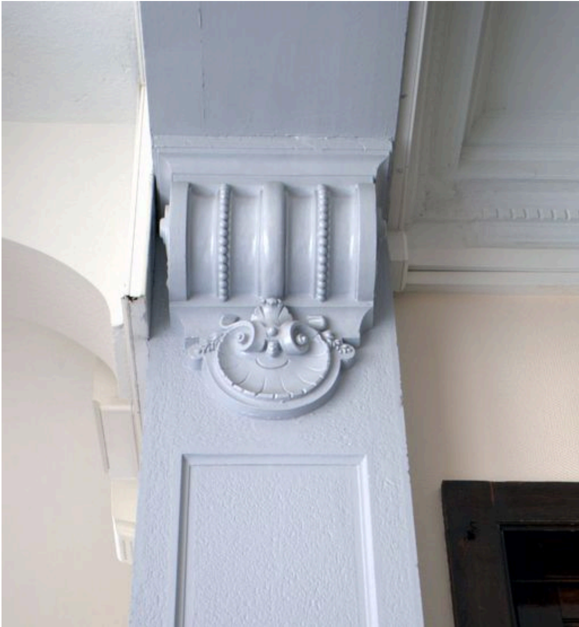
Passage cocher, détail d'une console