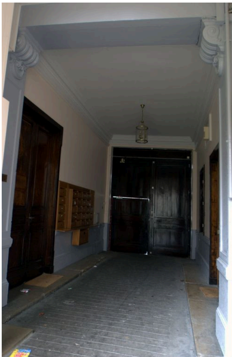
Vue intérieure du passage cocher