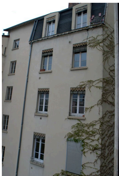
Elévation postérieure, détail IVR82_20106905096NUCA