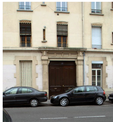
Détail de la porte sur rue IVR82_20106905093NUCA