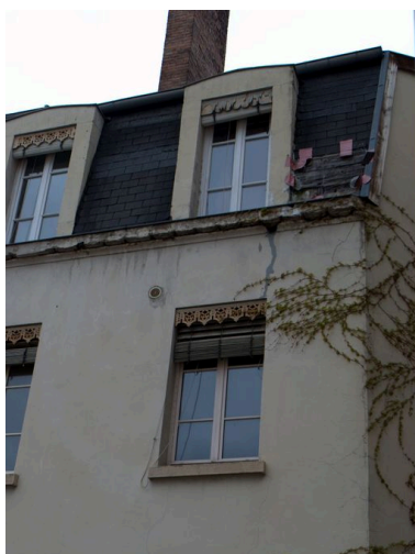
Elévation postérieure, détail de l'étage de comble IVR82_20106905097NUCA