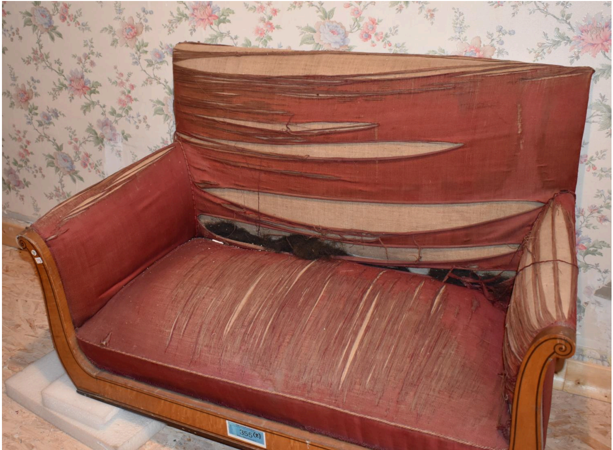
Vue générale du canapé n°1