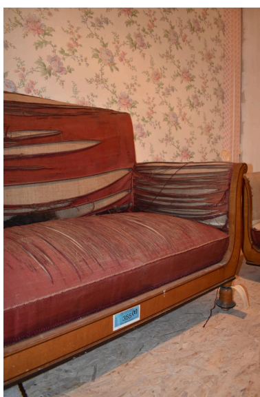
Vue générale du canapé n°1 IVR84_20216301497NUC4A