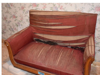
Vue générale du canapé n°1