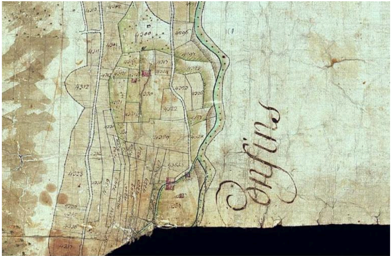
Cadastre de 1728, Arith, 1732 164, Vue 3 (FR.AD073, C2036).