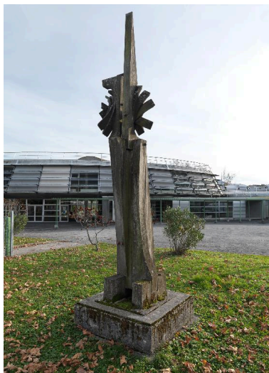
Vue de dos IVR82_20153800240NUCAQ