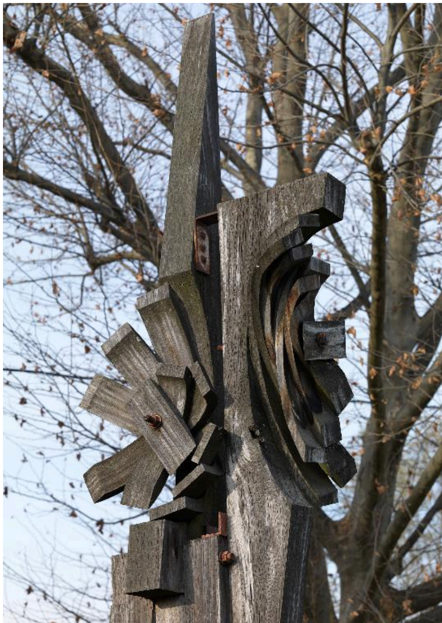
Détail de la partie supérieure