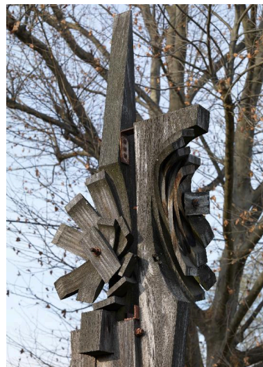
Détail de la partie supérieure IVR82_20153800243NUCAQ