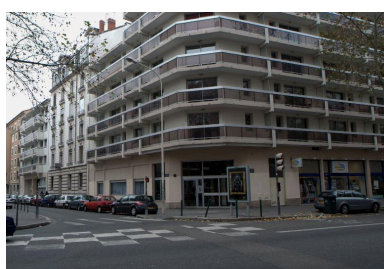
Elévations sur rue, détail IVR84_20166901857NUCA