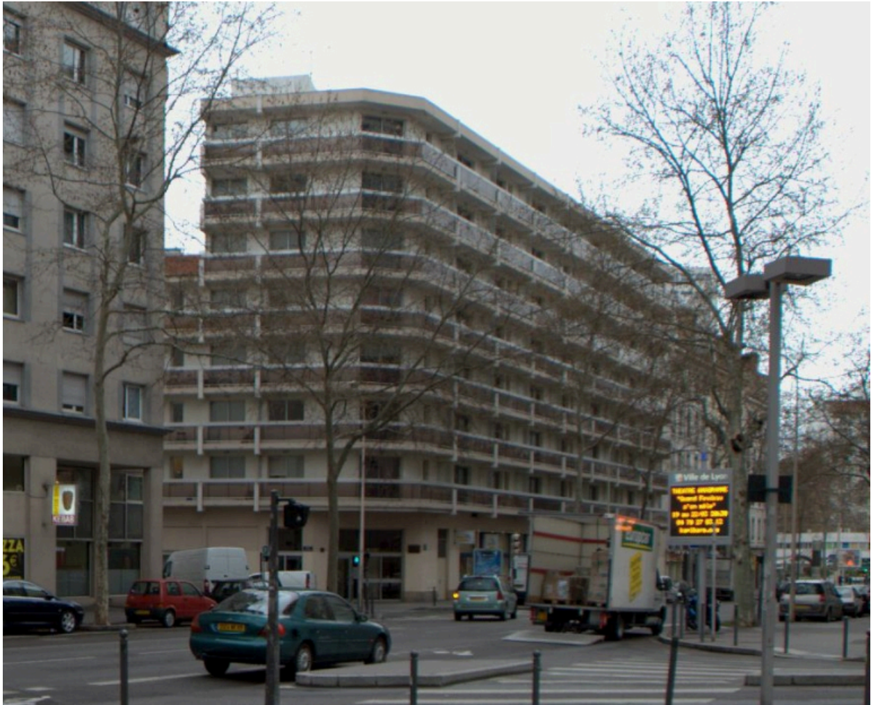
Vue générale depuis le nord-est