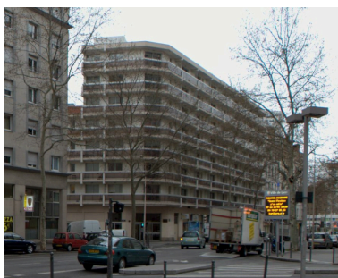
Vue générale depuis le nord-est IVR82_20116905026NUCA