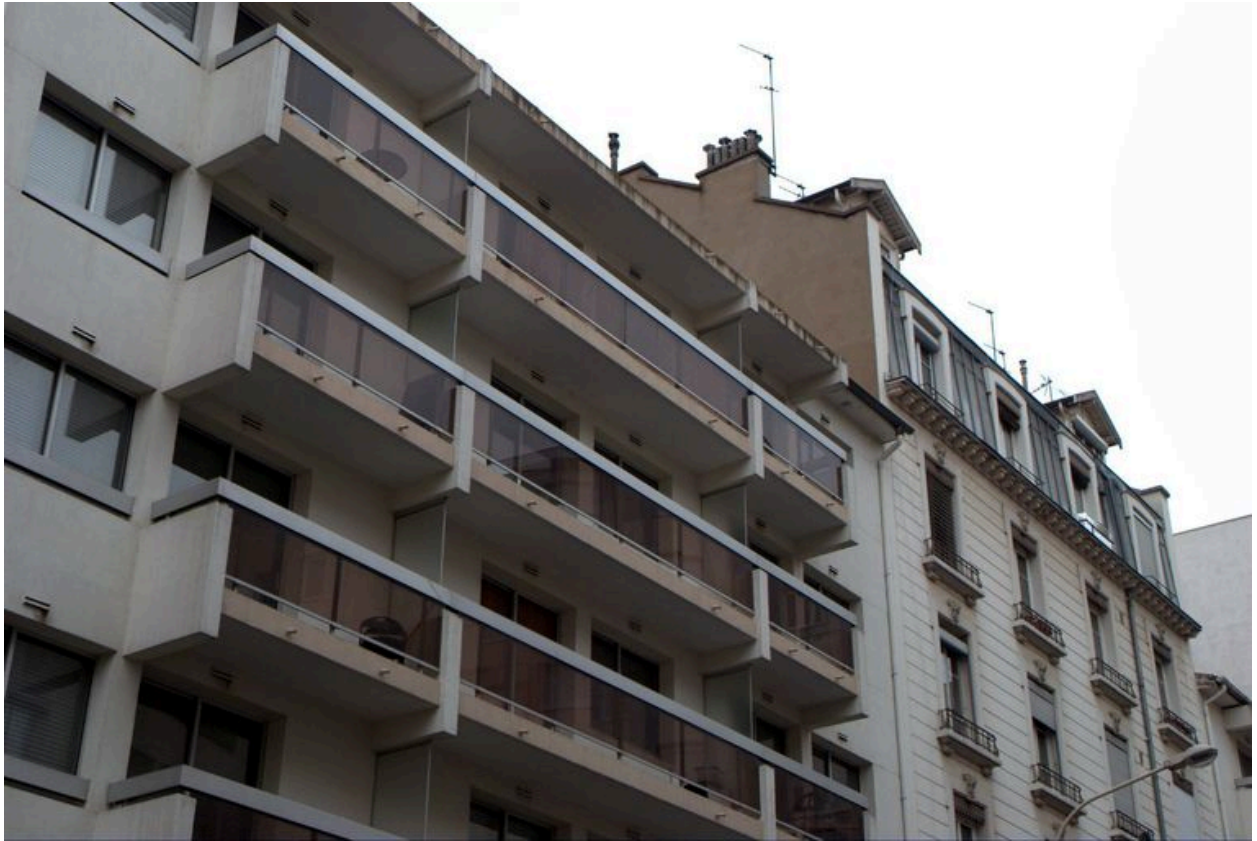
Immeuble 6 rue Victorien-Sardou. Détail des étages supérieurs