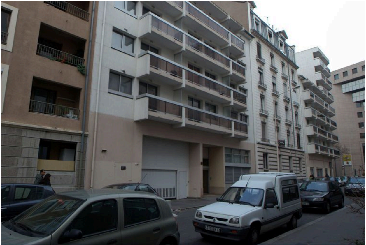
Immeuble 6 rue Victorien-Sardou. Vue générale depuis le sud-est