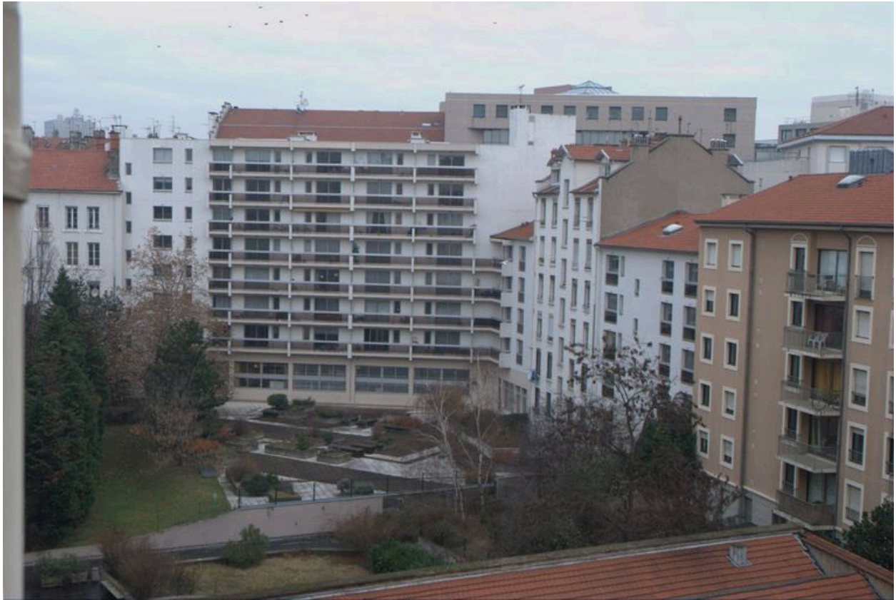
Elévations postérieures depuis le sud-ouest