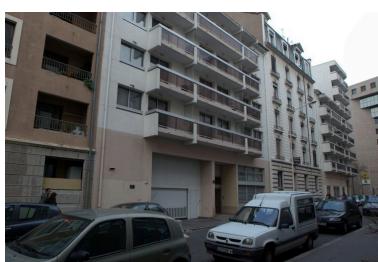
Immeuble 6 rue Victorien-Sardou. Vue générale depuis le sud-est IVR82_20086900746NUCA