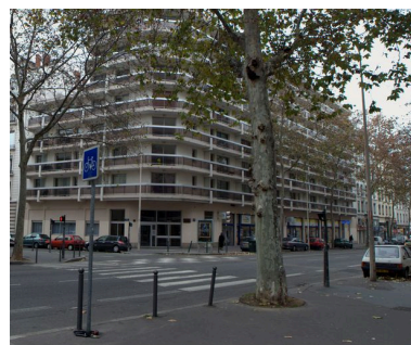
Vue d'ensemble IVR82_20086900744NUCA