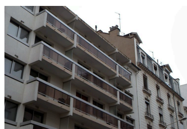
Immeuble 6 rue Victorien-Sardou. Détail des étages supérieurs IVR82_20086900747NUCA