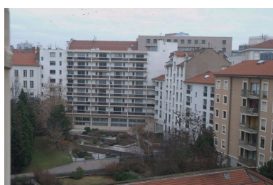
Elévations postérieures depuis le sud-ouest IVR82_20086900745NUCA