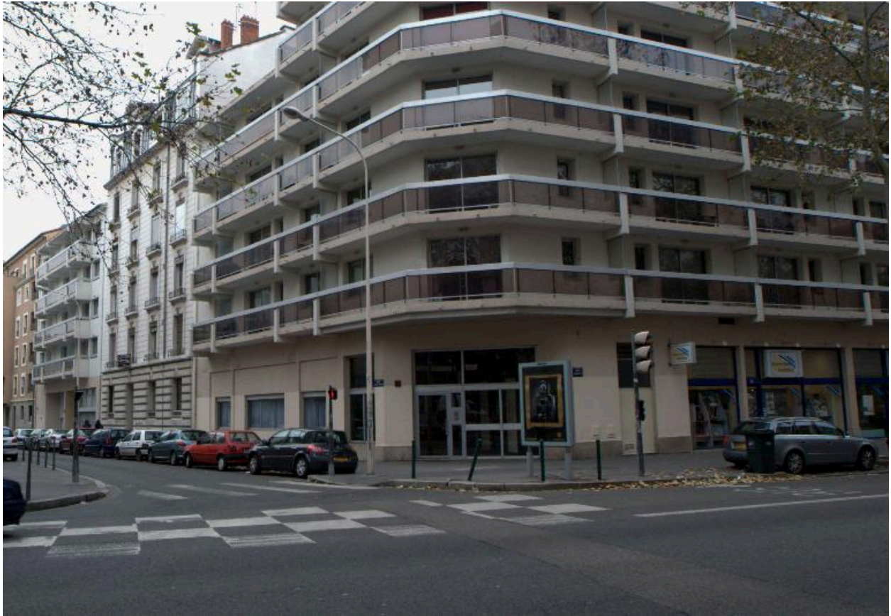
Elévations sur rue, détail