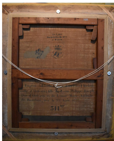
Vue dos du tableau IVR84_20216301137NUCA