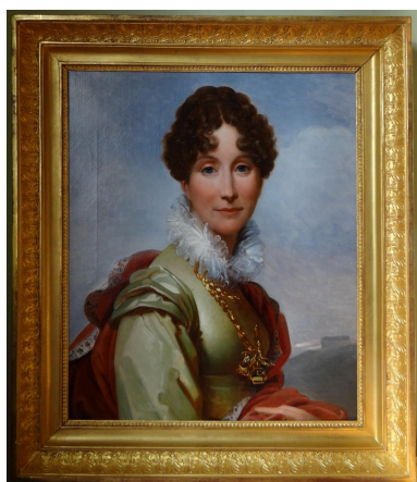
Vue générale IVR84_20216301136NUCA