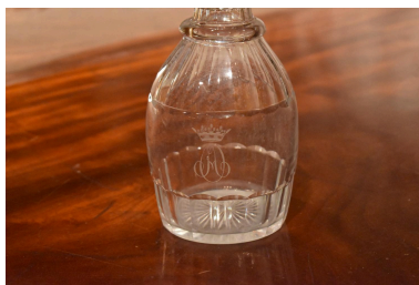
Détail de la carafe IVR84_20216301385NUC4A