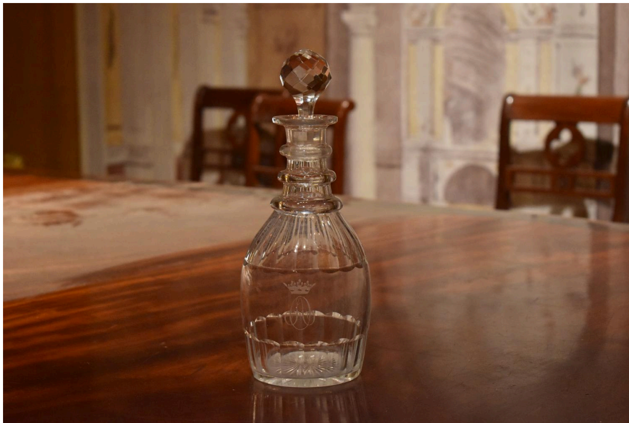
Vue générale de la carafe et du bouchon