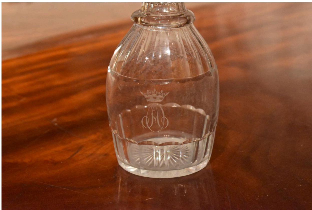
Détail de la carafe