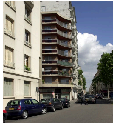
Angle de la rue André-Philip et de la rue Rachais