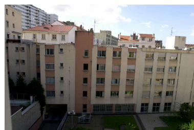
Élévation postérieure du corps de bâtiment rue Rachais