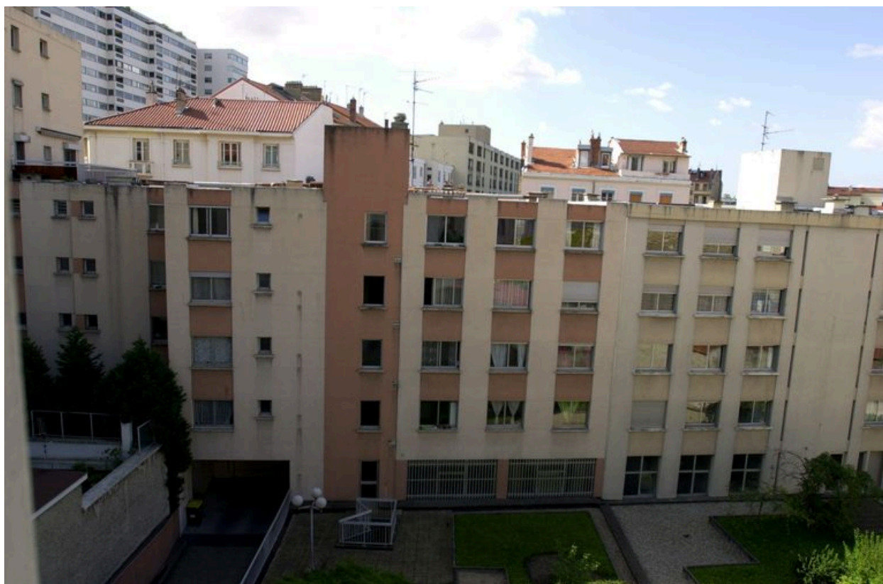
Elévation postérieure du corps de bâtiment rue Rachais