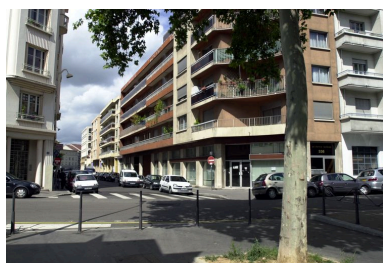
Élévation rue Rachais IVR82_20076902052NUCA