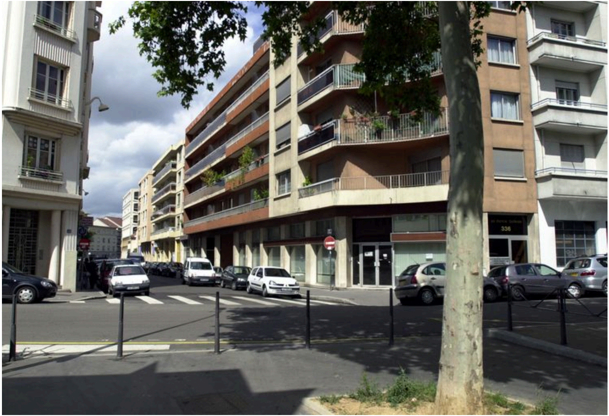
Elévation rue Rachais