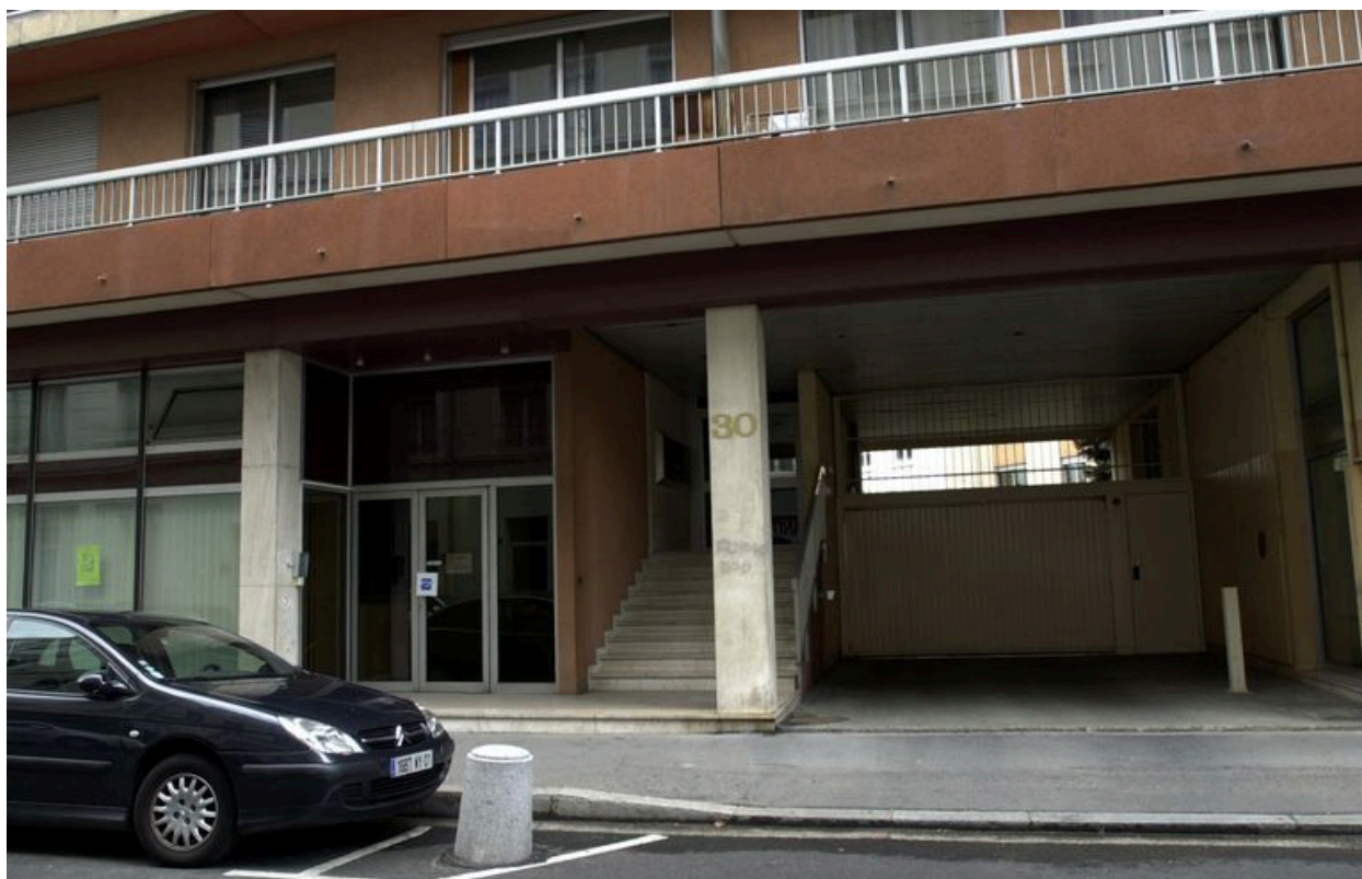
Entrée 30 rue Rachais