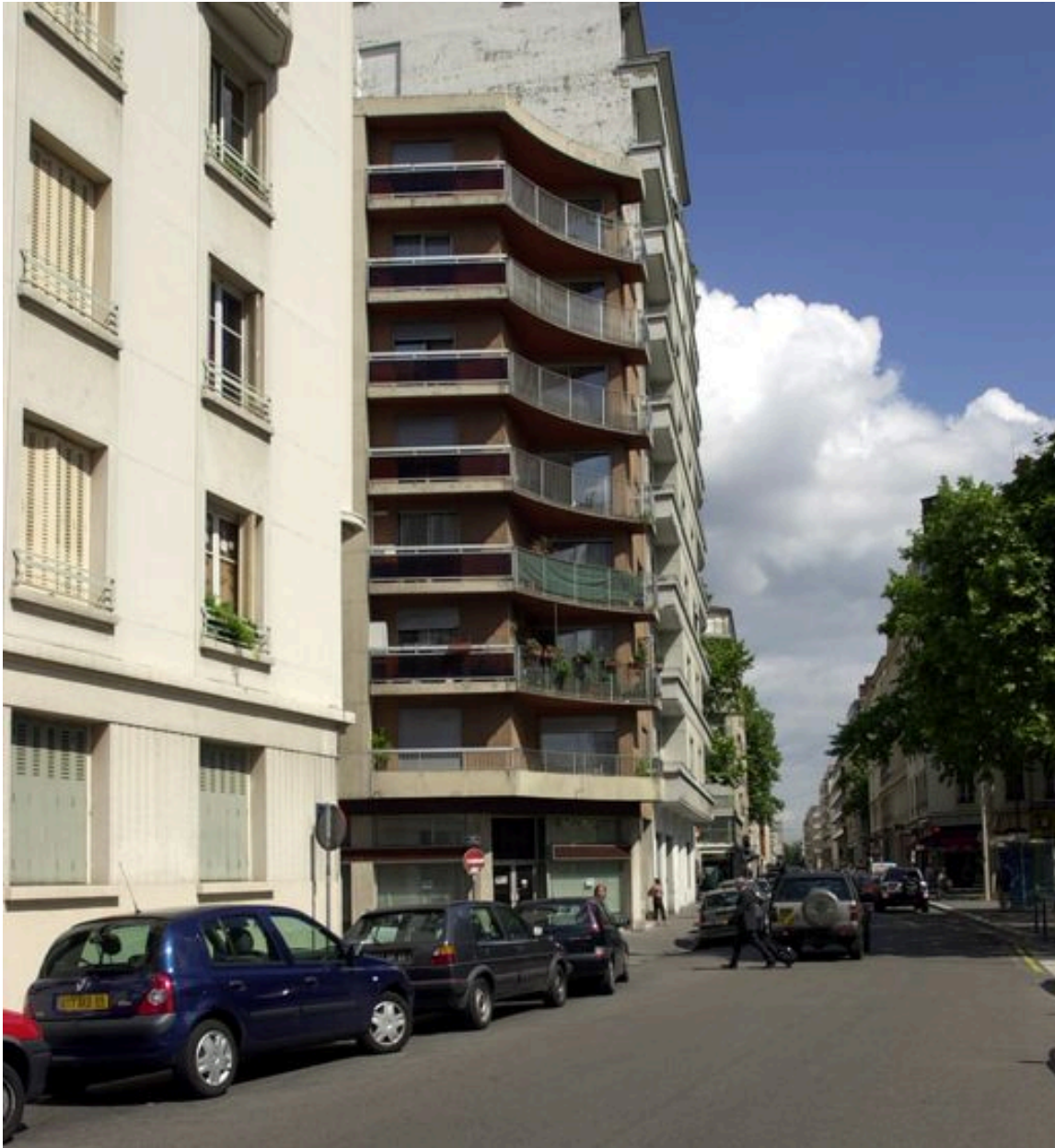
Angle de la rue André-Philip et de la rue Rachais