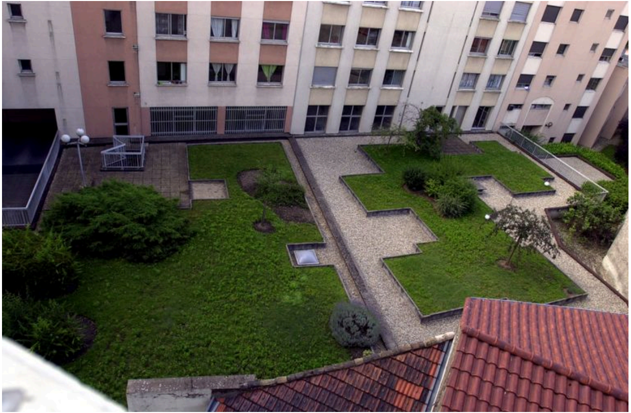
Cour-jardin, 30 rue Rachais