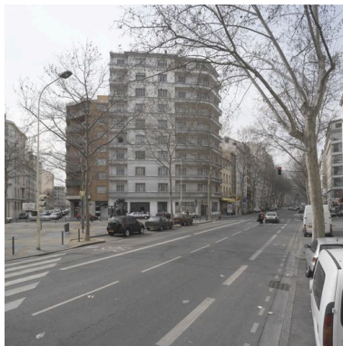
Vue générale depuis l'est IVR82_20056900612NUCA

Plan masse et de situation, extrait de http://cadastre.gouv.fr IVR82_20136902249NUDA