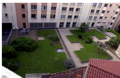
Cour-jardin, 30 rue Rachais IVR82_20076902061NUCA