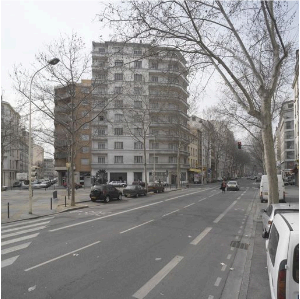
Vue générale depuis l'est