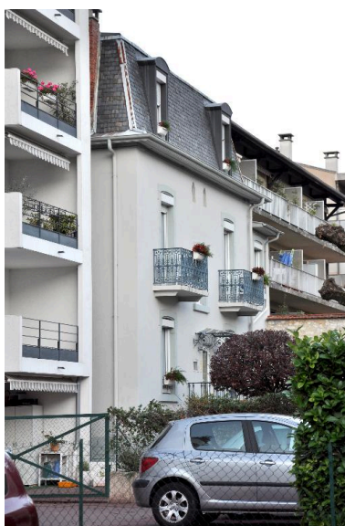
Elévation postérieure IVR82_20097301088NUCA