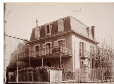
La villa, vers 1898 IVR82_20127300775NUCB