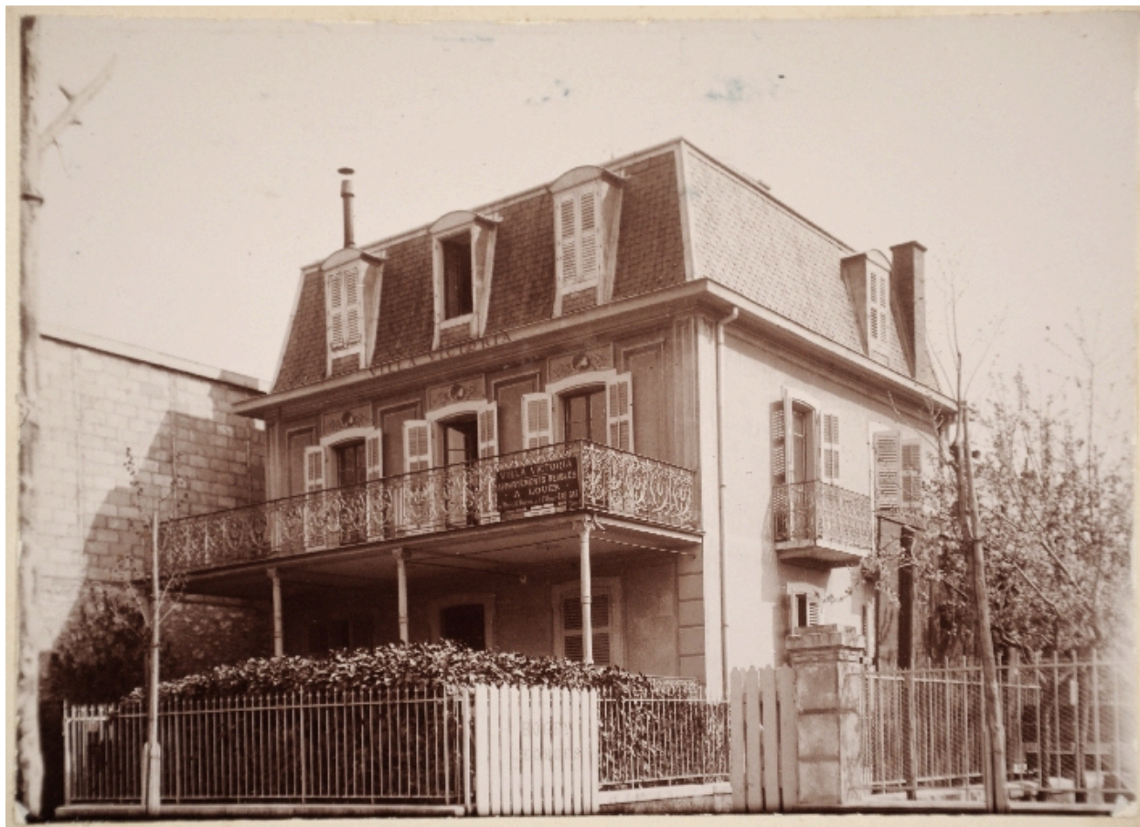
La villa, vers 1898