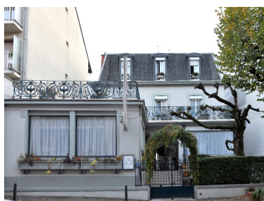
Vue générale IVR82_20097301087NUCA