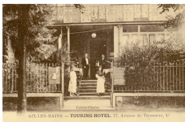
Perron devant l'entrée IVR82_20117300383NUCB