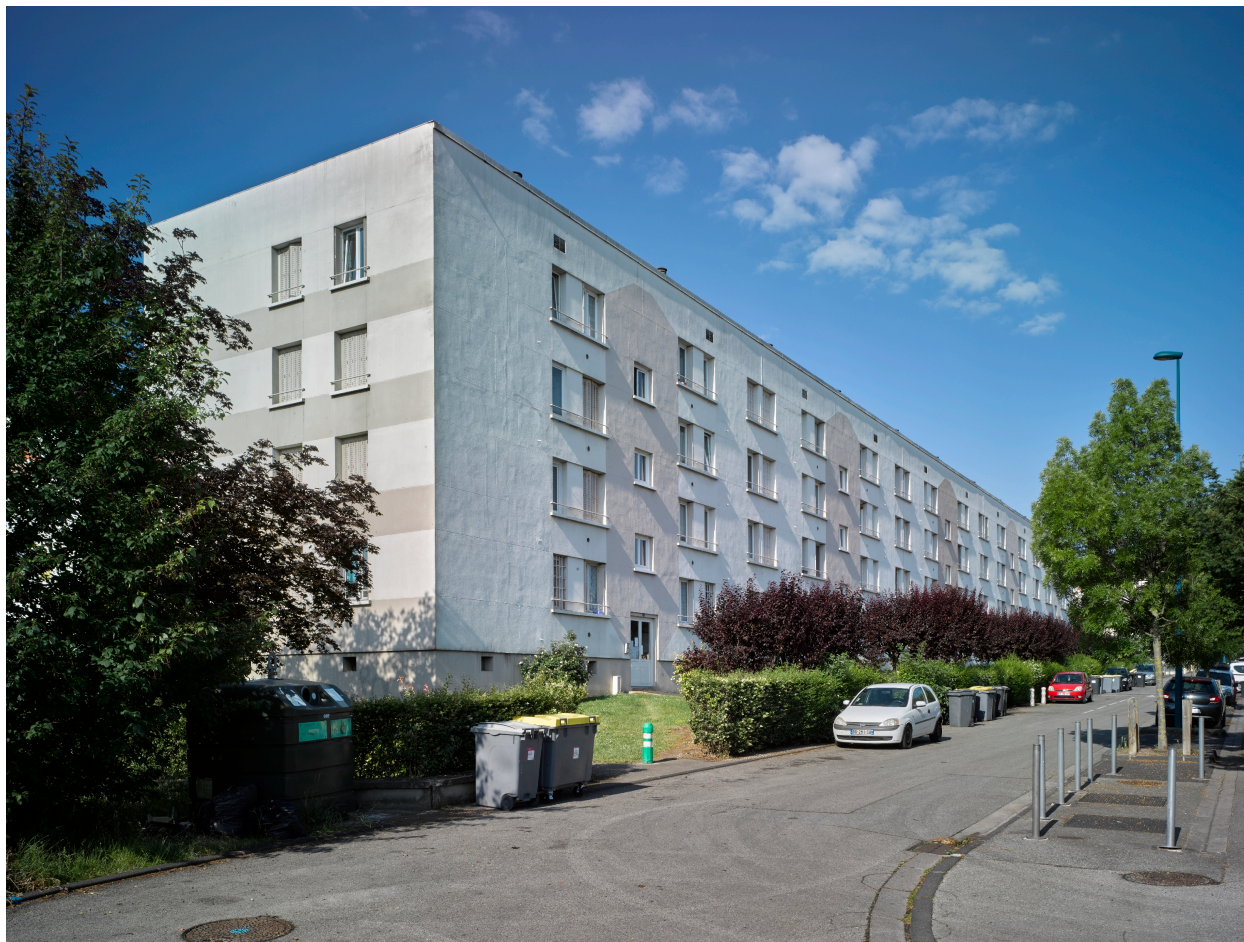
Immeuble collectif n°2 rue de la Fontcimagne, vu depuis le nord-est.