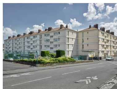
Ensemble collectif n°1, immeubles en bordure de la rue des Planchettes. IVR84_20206300911NUC4A