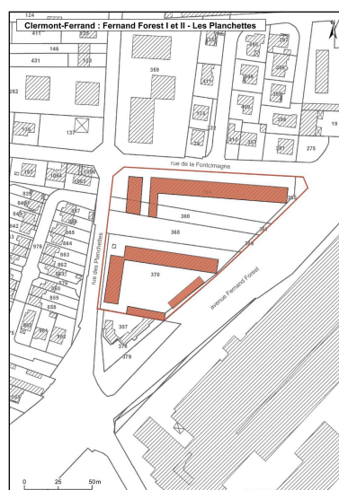
Plan des différents bâtiments d'origine de la cité. IVR84_20216301262NUDA