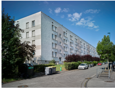
Immeuble collectif n°2 rue de la Fontcimagne, vu depuis le nord-est. IVR84_20206300902NUC4A