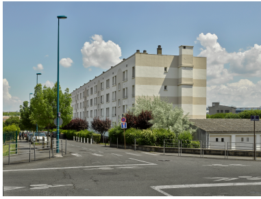
Ensemble collectif n°2, immeuble à l'angle des rues de la Fontcimagne et des Planchettes. IVR84_20206300910NUC4A