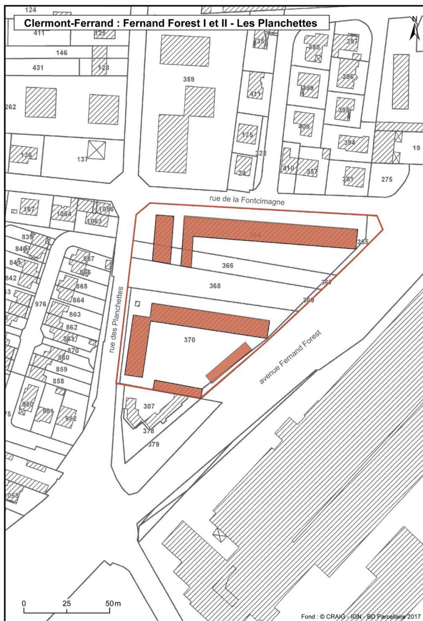
Plan des différents bâtiments d'origine de la cité.