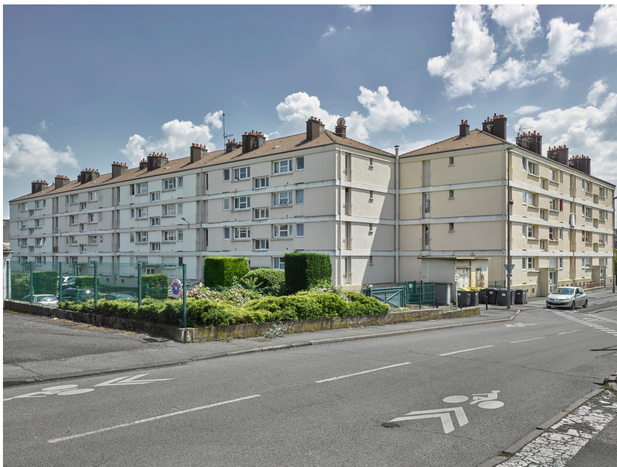
Ensemble collectif n°1, immeubles en bordure de la rue des Planchettes.