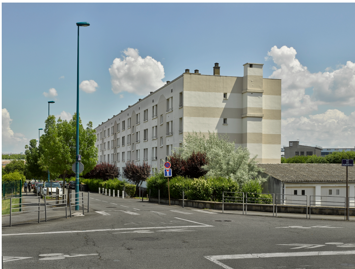
Ensemble collectif n°2, immeuble à l'angle des rues de la Fontcimagne et des Planchettes.