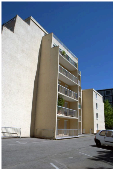
Vue de la façade depuis sud est