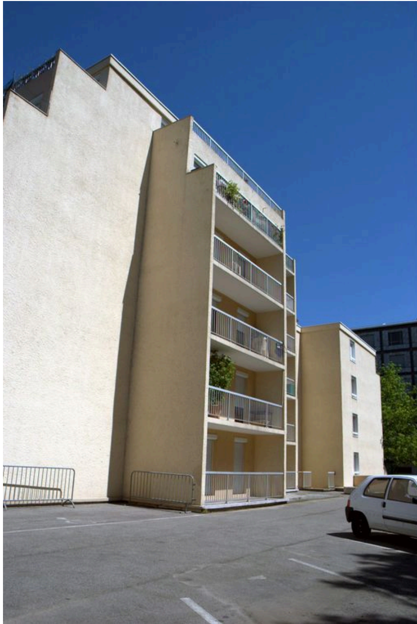
Vue de la façade depuis sud est