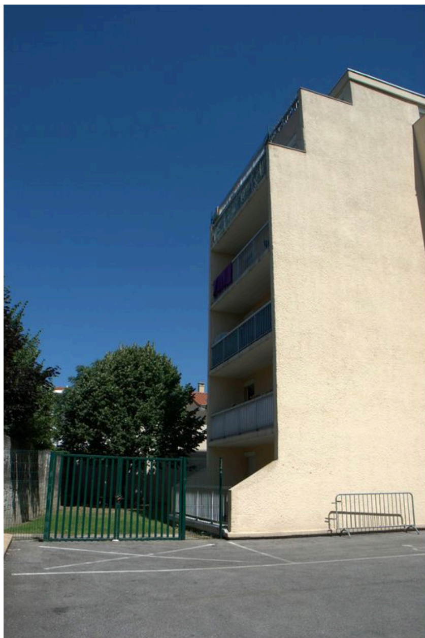
Vue de l'élévation depuis le sud ouest