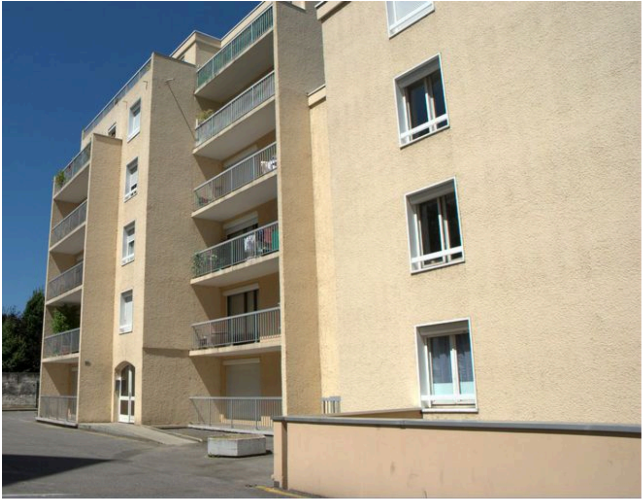
Vue de la façade sud vers le nord ouest