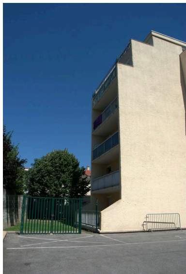
Vue de l'élévation depuis le sud ouest IVR82_20116901573NUCA