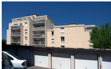
Vue générale depuis le sud est IVR82_20116901570NUCA