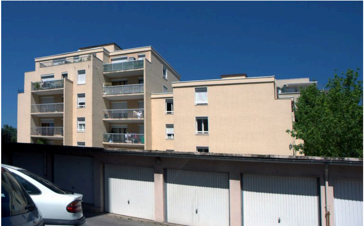
Vue générale depuis le sud est