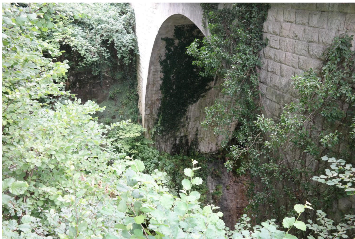
Pont de la Ravoire, détail de la pile en rive gauche face amont