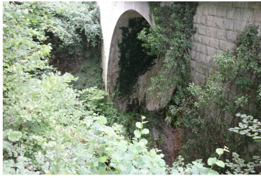
Pont de la Ravoire, détail de la pile en rive gauche face amont