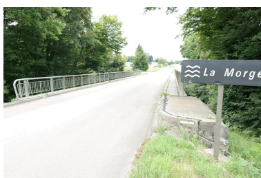
Pont de la Ravoire, chaussée et gardes-corps