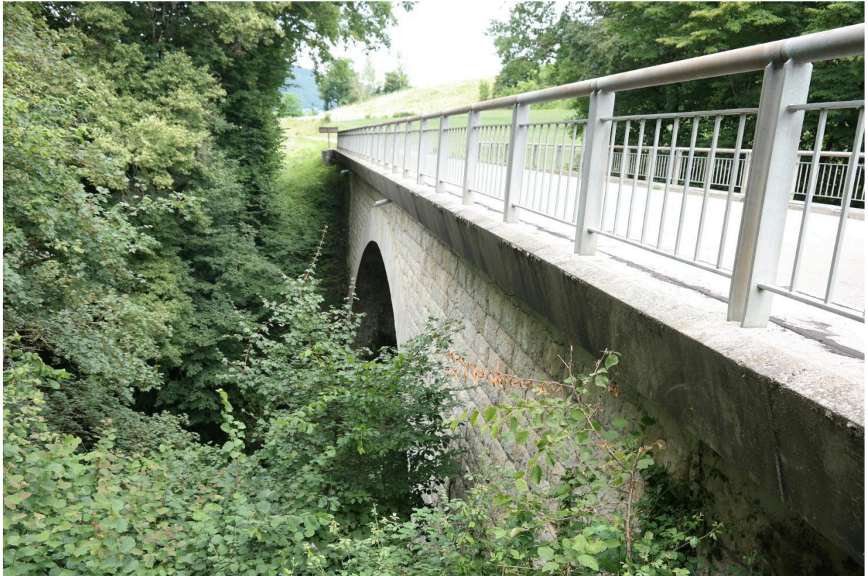
Pont de la ravoire, vue de la face aval