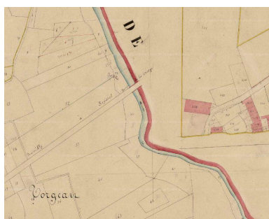
Extrait de la section C feuille n°1 du cadastre de la Vallières. 1863 (AD haute-Savoie. 3P3/8936) IVR84_20207403099NUCA