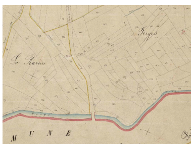
Extrait de la section B feuille unique du cadastre de la Ravoire et le Chenay (Sion). 1863 IVR84_20207403100NUCA