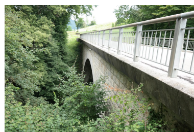
Pont de la ravoire, vue de la face aval IVR84_20207403095NUCA