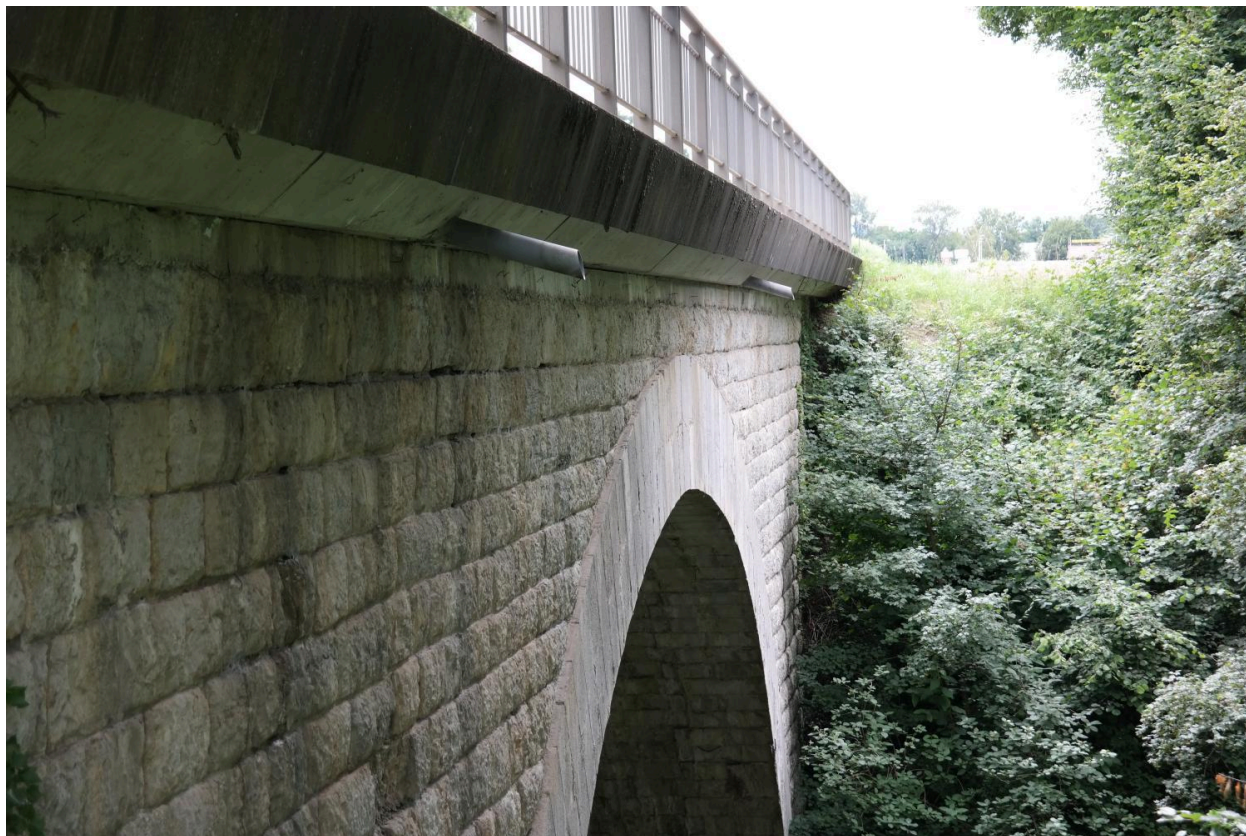
Pont de la Ravoire, détail de la face aval