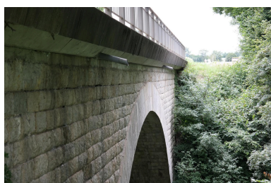
Pont de la Ravoire, détail de la face aval IVR84_20207403096NUCA