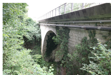
Pont de la Ravoire, vue de la face amont