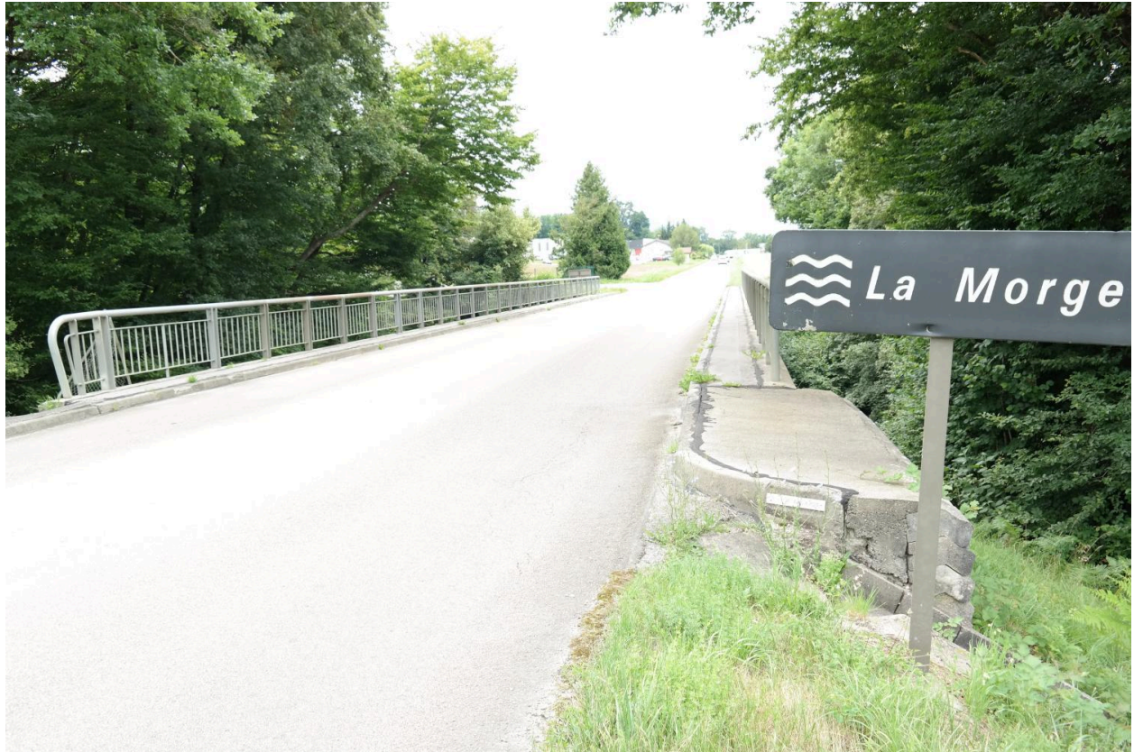
Pont de la Ravoire, chaussée et gardes-corps