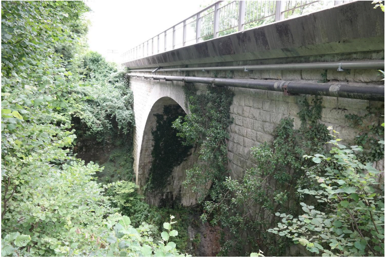
Pont de la Ravoire, vue de la face amont