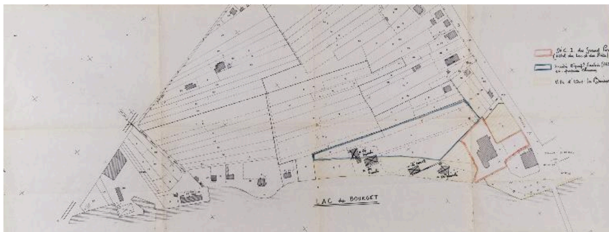
Plan parcellaire, 1978-1981