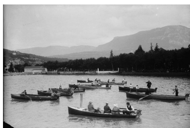
La villa à gauche, vers 1910