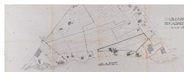
Plan parcellaire, 1978-1981 IVR82_20157300746NUCB