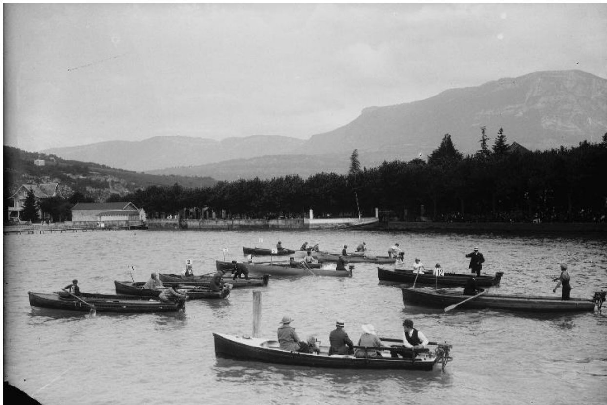
La villa à gauche, vers 1910