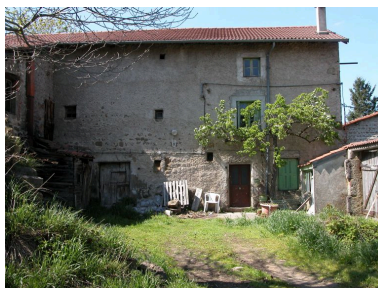
Vue générale IVR82_20114202010NUCA

Plan de situation, sur fond de plan cadastral, section AH, échelle originale 1:2500e. Source : Direction générale des Finances Publiques - Cadastre ; mise à jour : 1987. Dess. Thierry Monnet IVR82_20114202011NUD