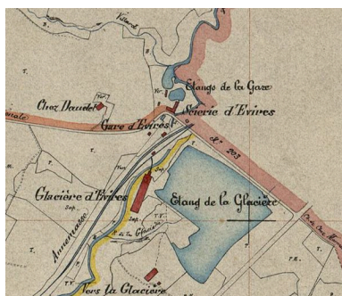
Extrait du tableau d'assemblage du cadastre de la commune d'Evires. 3P3/4548 IVR82_20107400104NUCA