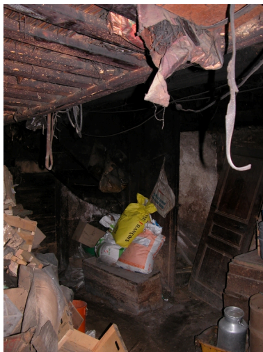
Vue intérieure de la cuisine : départ de l'escalier. IVR82_20124201008NUCA