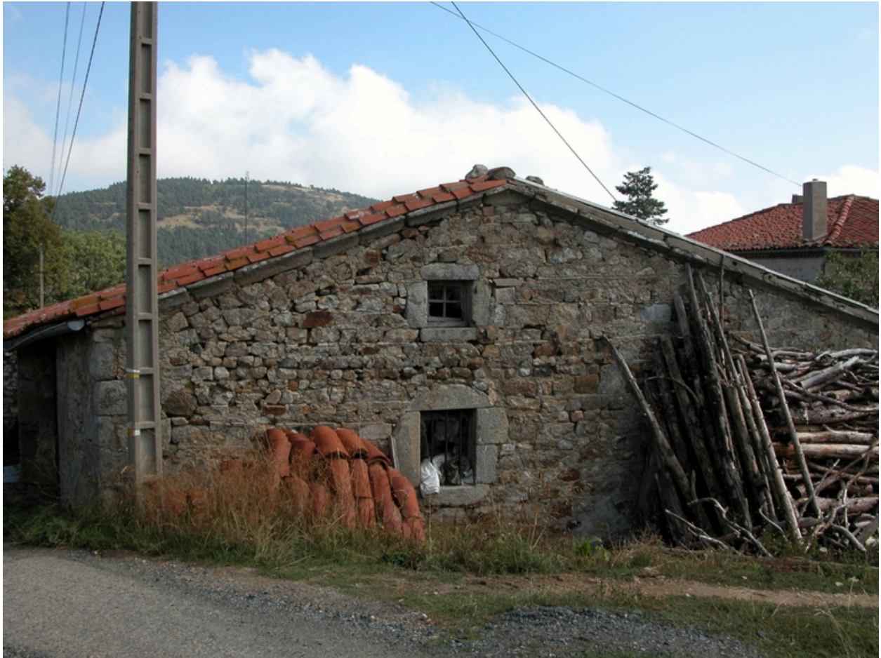
Vue du pignon du logis, depuis le chemin.