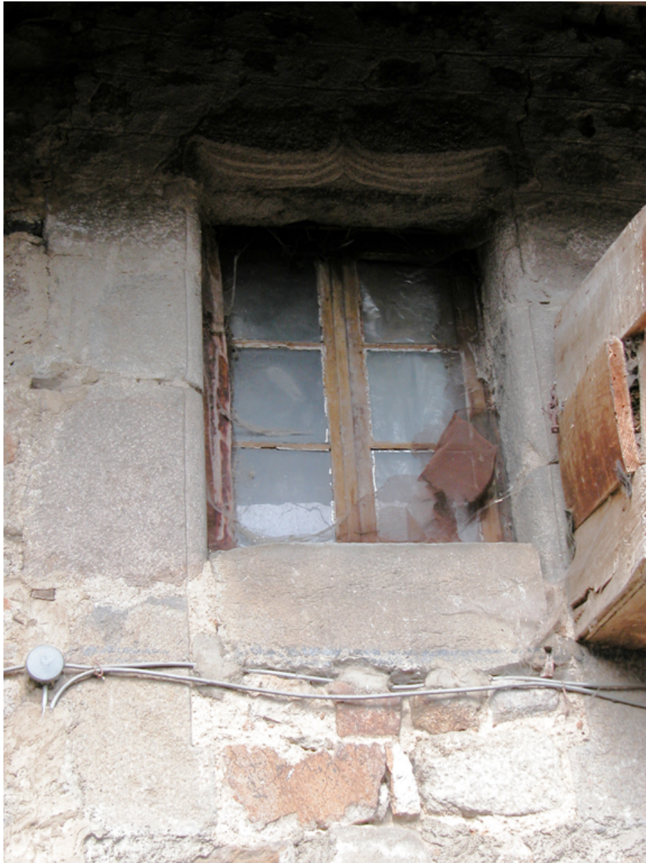
Détail de la fenêtre du rez-de-chaussée surélevé du logis.