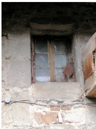
Détail de la fenêtre du rez-de-chaussée surélevé du logis.