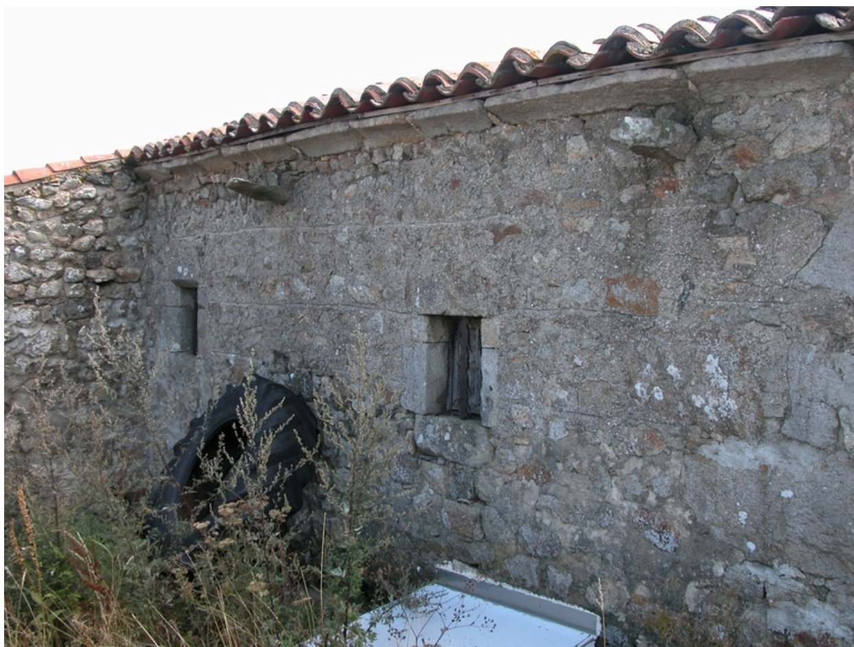
Vue de l'élévation arrière du logis.