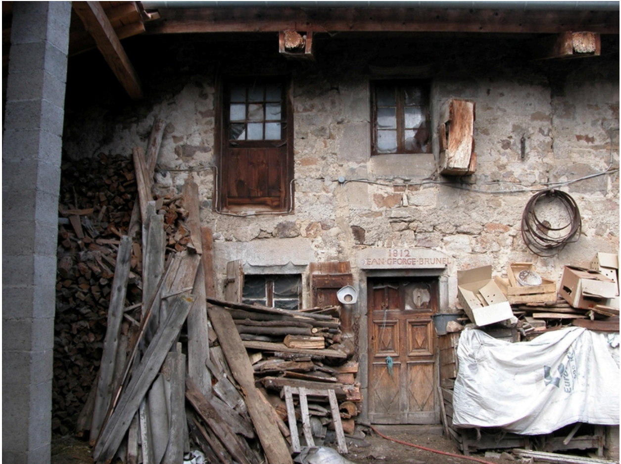
Vue d'ensemble de la façade sur cour du logis.