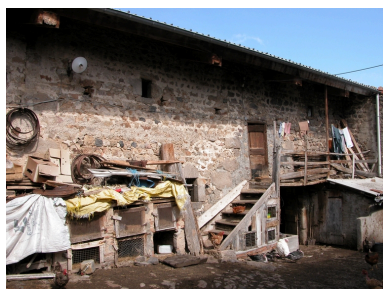
Vue de la grange- étable, depuis la cour. IVR82_20124201014NUCA