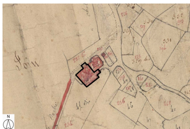
Plan de situation, d'après le cadastre de 1818 (?), section E, échelle originale 1:2500 Plan cadastral, dit cadastre napoléonien Dessin au crayon, plume et lavis d'encre colorées sur papier, 1818 (?). AD Loire. 3P-1682VT IVR82_20124201029NUD