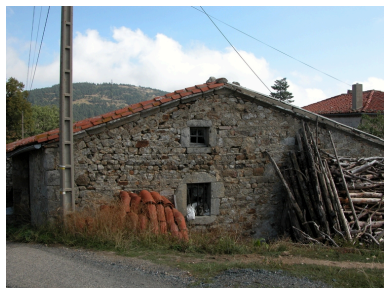
Vue du pignon du logis, depuis le chemin. IVR82_20124201017NUCA