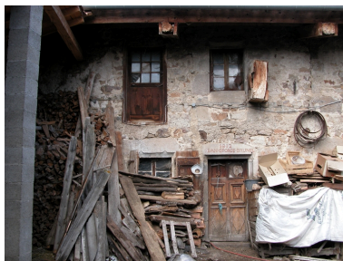
Vue d'ensemble de la façade sur cour du logis. IVR82_20124201011NUCA