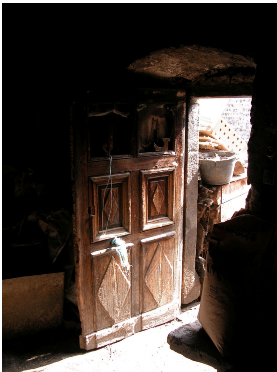
Vue intérieure de la cuisine : vantail de la porte du logis.