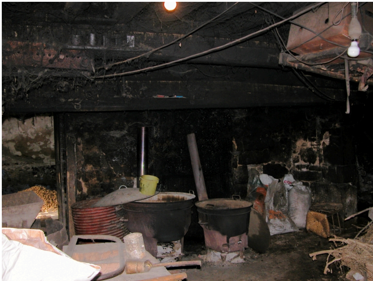
Vue intérieure de la cuisine : cheminée, porte vers la bretagne.