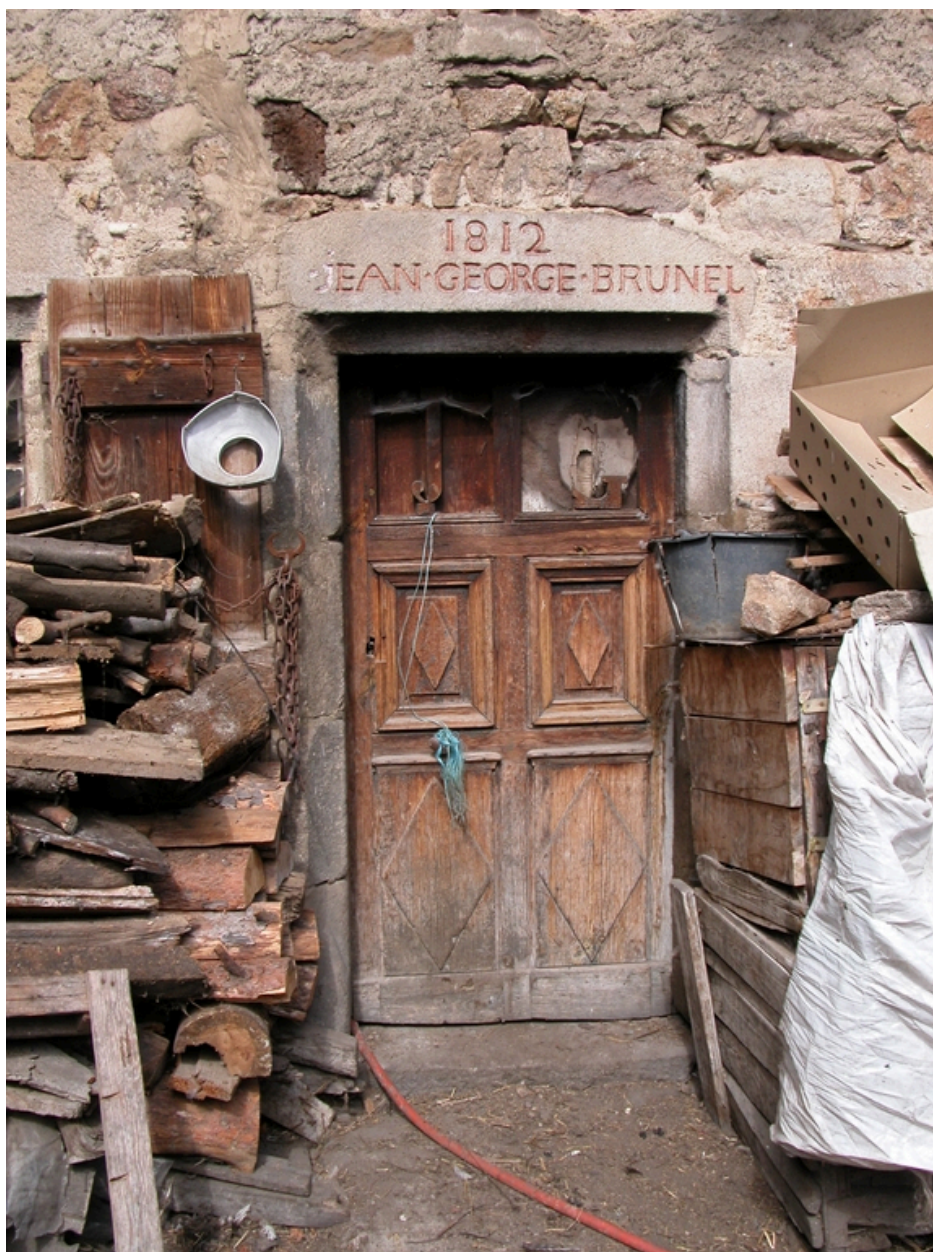
Détail de la porte d'entrée du logis.