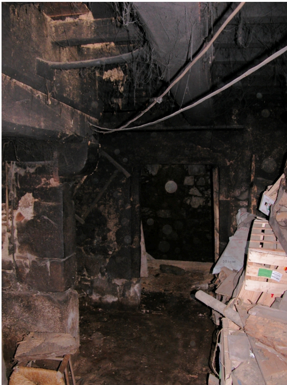
Vue intérieure de la cuisine : piédroit de la cheminée, porte de la cave à pommes de terre.