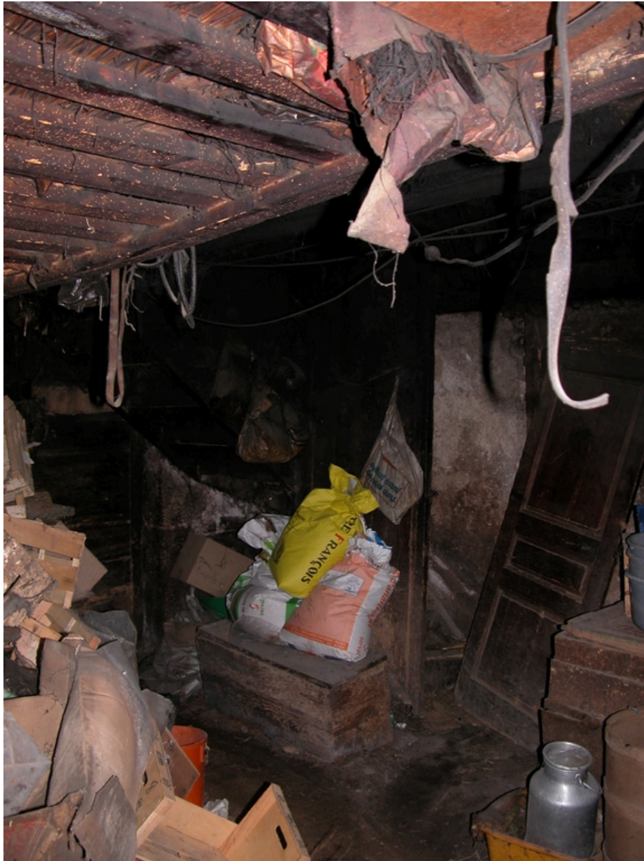
Vue intérieure de la cuisine : départ de l'escalier.