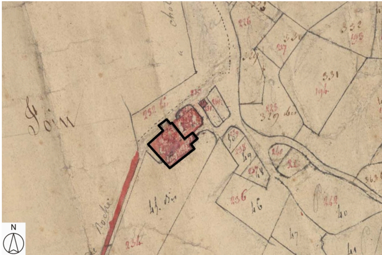
Plan de situation, d'après le cadastre de 1818 (?), section E, échelle originale 1:2500 Plan cadastral, dit cadastre napoléonien Dessin au crayon, plume et lavis d'encre colorées sur papier, 1818 (?). AD Loire. 3P-1682VT