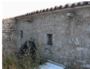
Vue de l'élévation arrière du logis. IVR82_20124201018NUCA