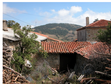
Vue du passage couvert sud-ouest ; à gauche, l'extrémité du logis (couvert en fibrociment), avec la bretagne qui dépasse à l'extérieur de la cour (à droite, toit à croupes du logis de la ferme IA42002338). IVR82_20124201016NUCA