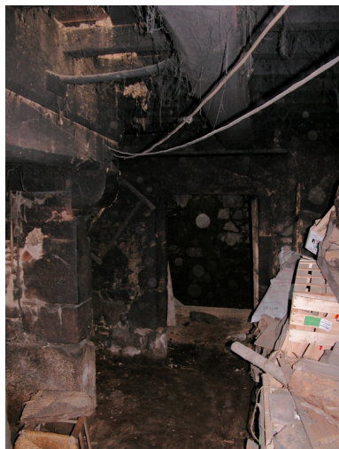
Vue intérieure de la cuisine : piédroit de la cheminée, porte de la cave à pommes de terre.