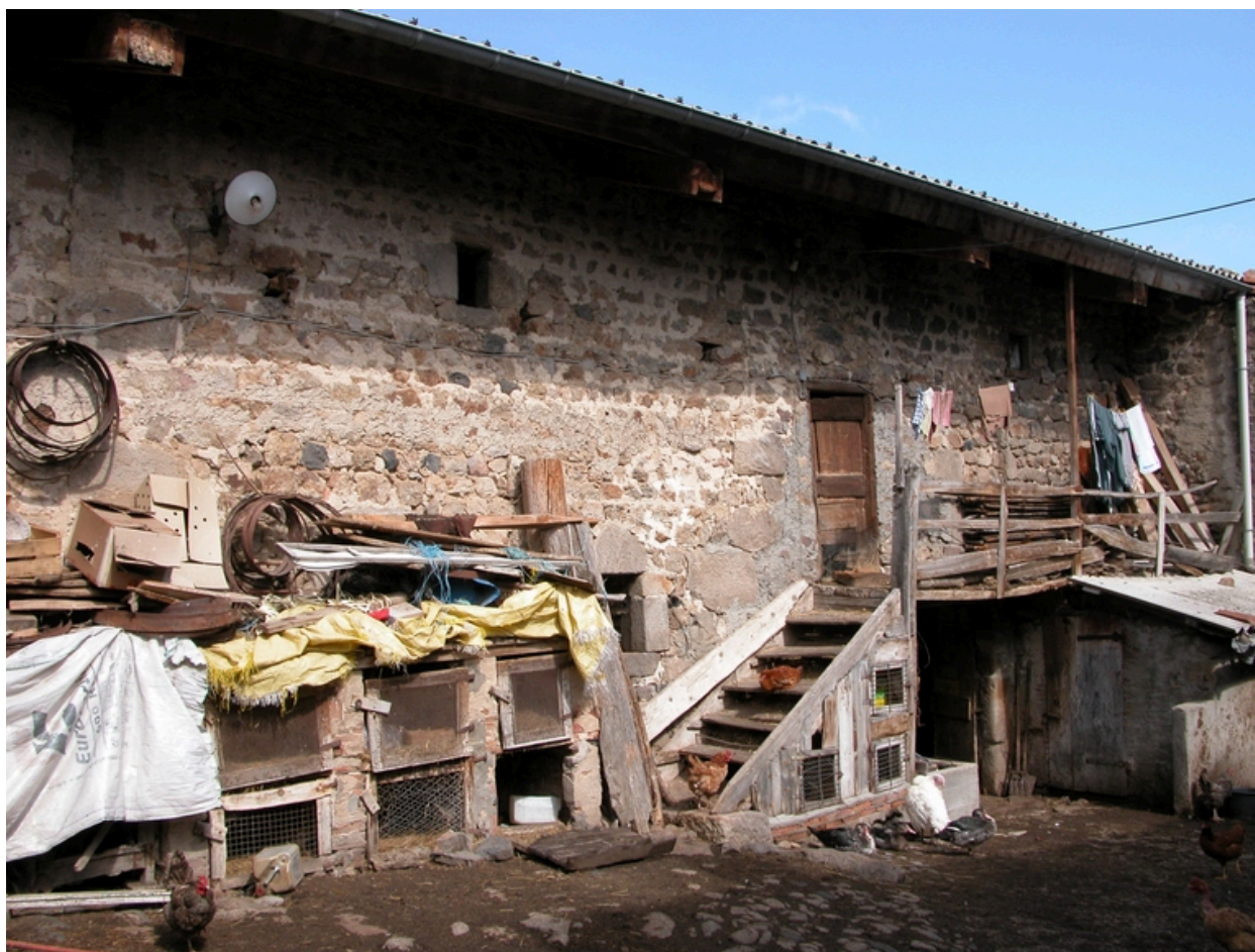
Vue de la grange-étable, depuis la cour.