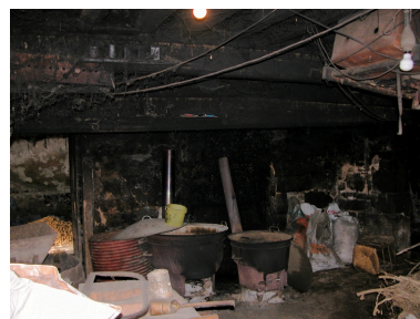
Vue intérieure de la cuisine : cheminée, porte vers la bretagne.