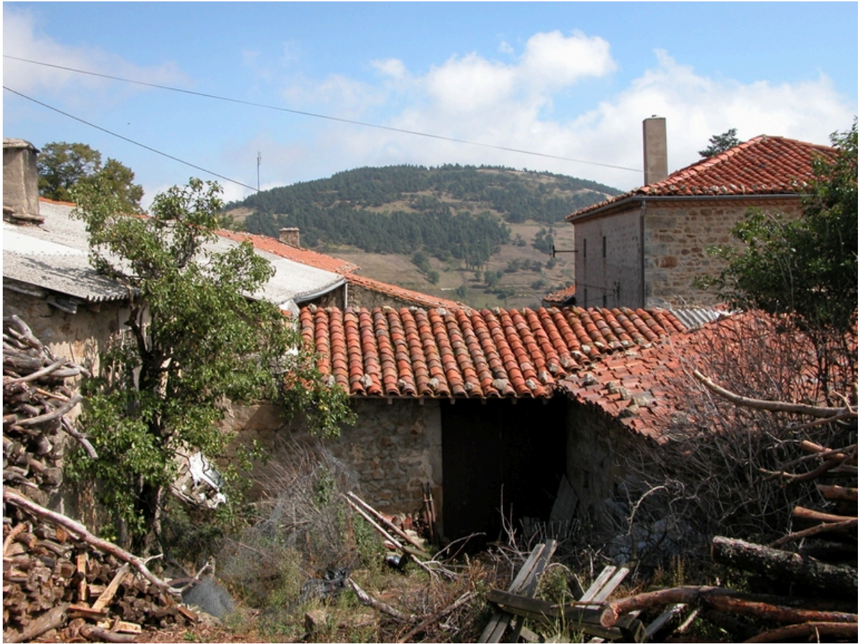
Vue du passage couvert sud-ouest ; à gauche, l'extrémité du logis (couvert en fibrociment), avec la bretagne qui dépasse à l'extérieur de la cour (à droite, toit à croupes du logis de la ferme IA42002338).