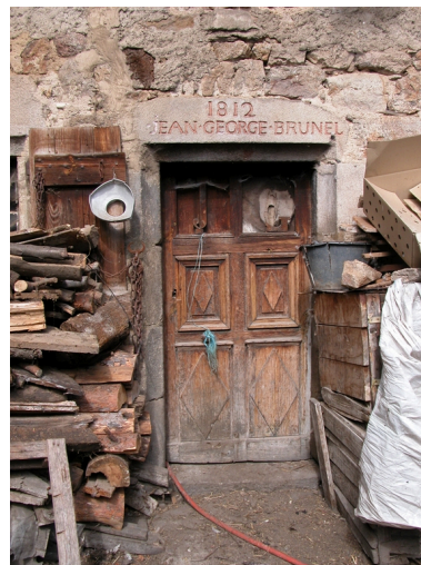
Détail de la porte d'entrée du logis.